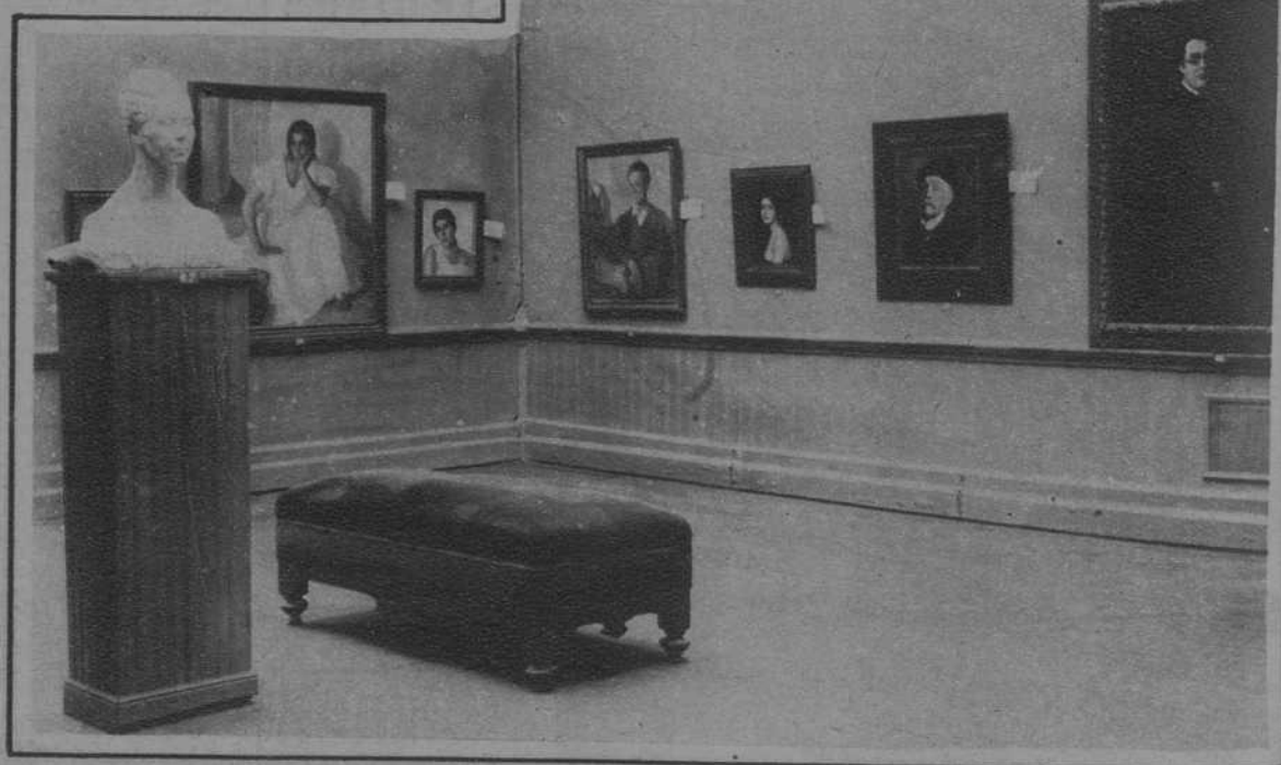
Detalle de una de las salas