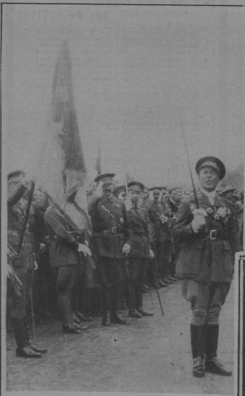
Santander.—Entrega de la bandera de la República al regimiento de Valencia, con el que se ha refundido el de Andalucía. El coronel de dicho Cuerpo dirigiendo una arenga a la tropa, después de recibir la enseña de la patria.