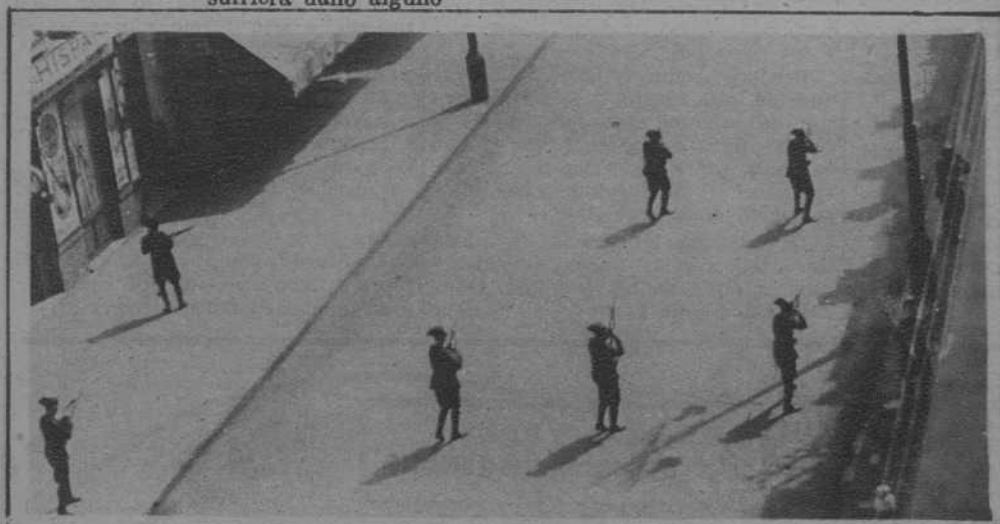
La Guardia Civil, repeliendo una agresión