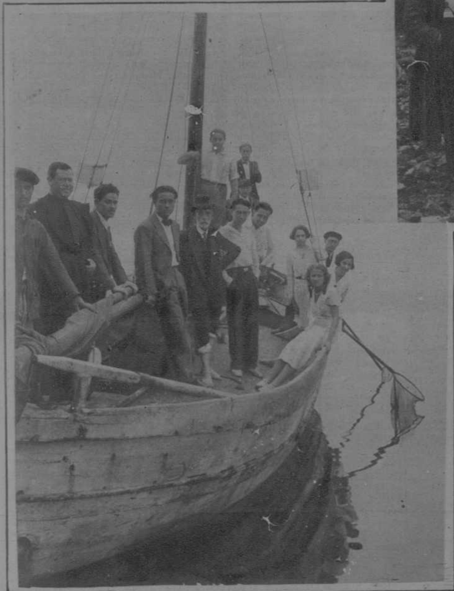
Los excursionistas, en la embarcación que utilizan para sus investigaciones, con sus profesores

LOS AVIADORES HUNGAROS ENDRESZ Y MAGYAR, BATEN EL RECORD DE TRAVESIA DEL ATLANTICO, CRUZANDOLO EN CATORCE HORAS DE TERRANOVA A HUNGRIA.