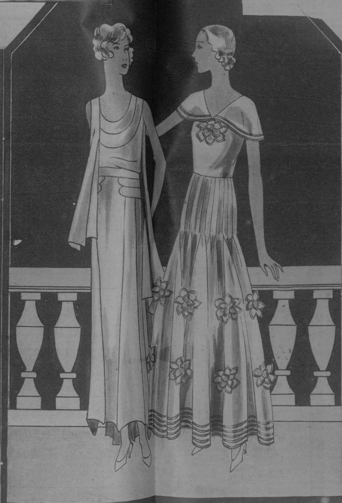
3.—Vestido de georgette blanco. El bajo, recortado en puntas a la altura del tobillo. El alto, adornado con recortes. Una tira de chal cae sobre la espalda, agraciando el perfil.