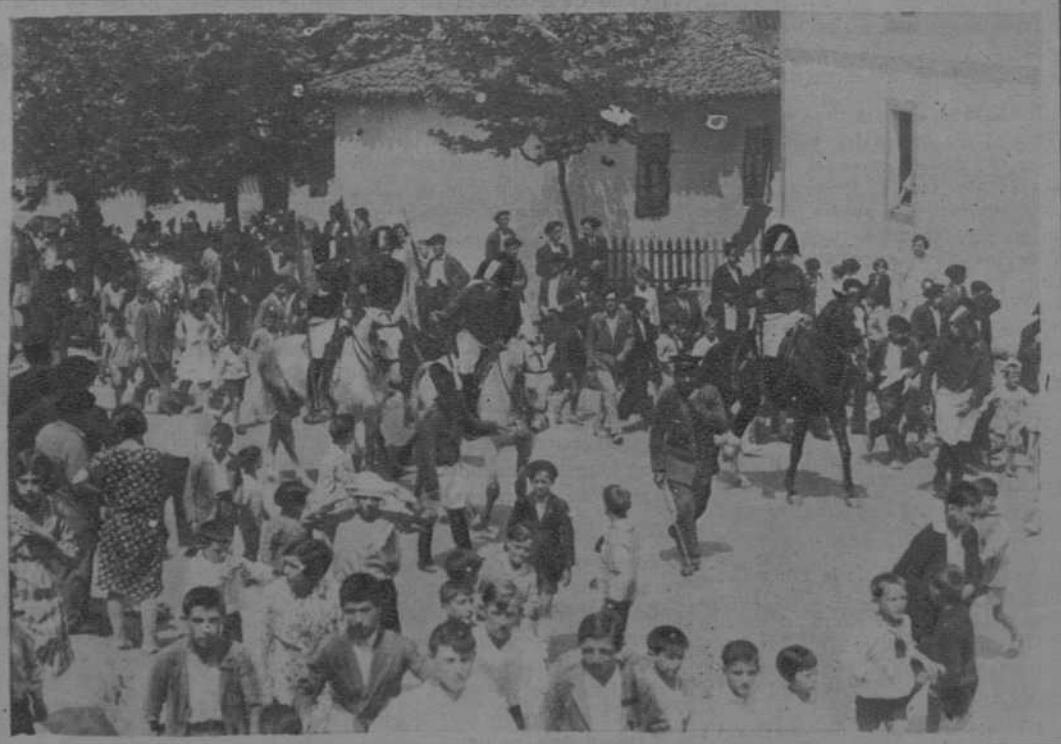
La típica «tamborrada», recorriendo las calles

SANTANDER. — EXCURSION CIENTIFICA DE LOS ALUMNOS DE CIENCIAS NATURALES DE LA UNIVERSIDAD CENTRAL. - (Fots. Samot)