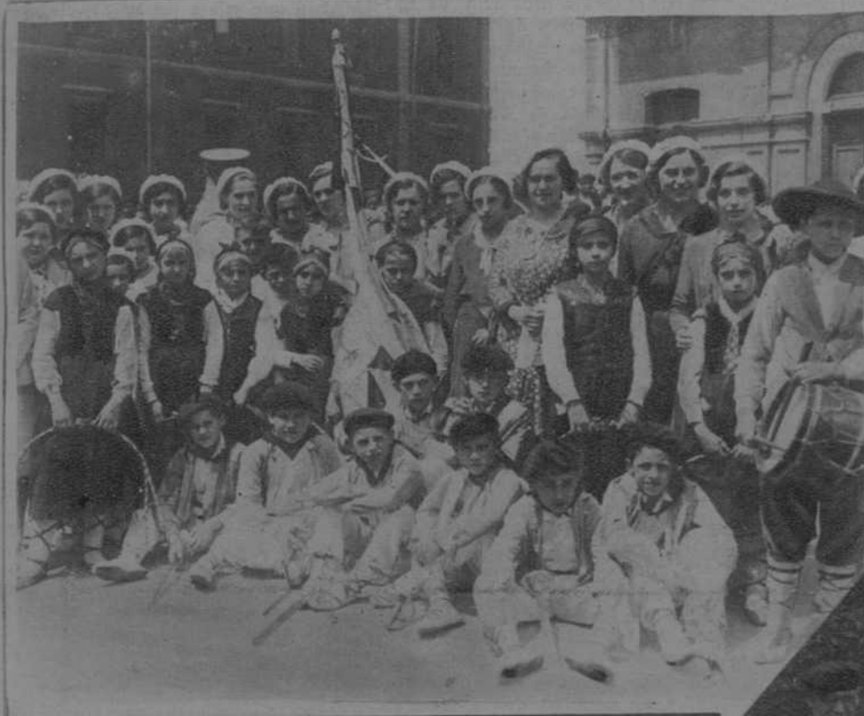
El coro «Elai Alai», de Guernica, que tomó parte en las fiestas

BARACALDO (VIZCAYA).—LAS FIESTAS DEL CARMEN.