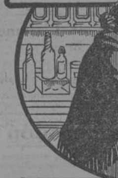
SI, Señora, son de GUSTIN.