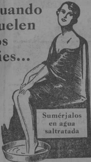
Sumérjalos en agua saltrata