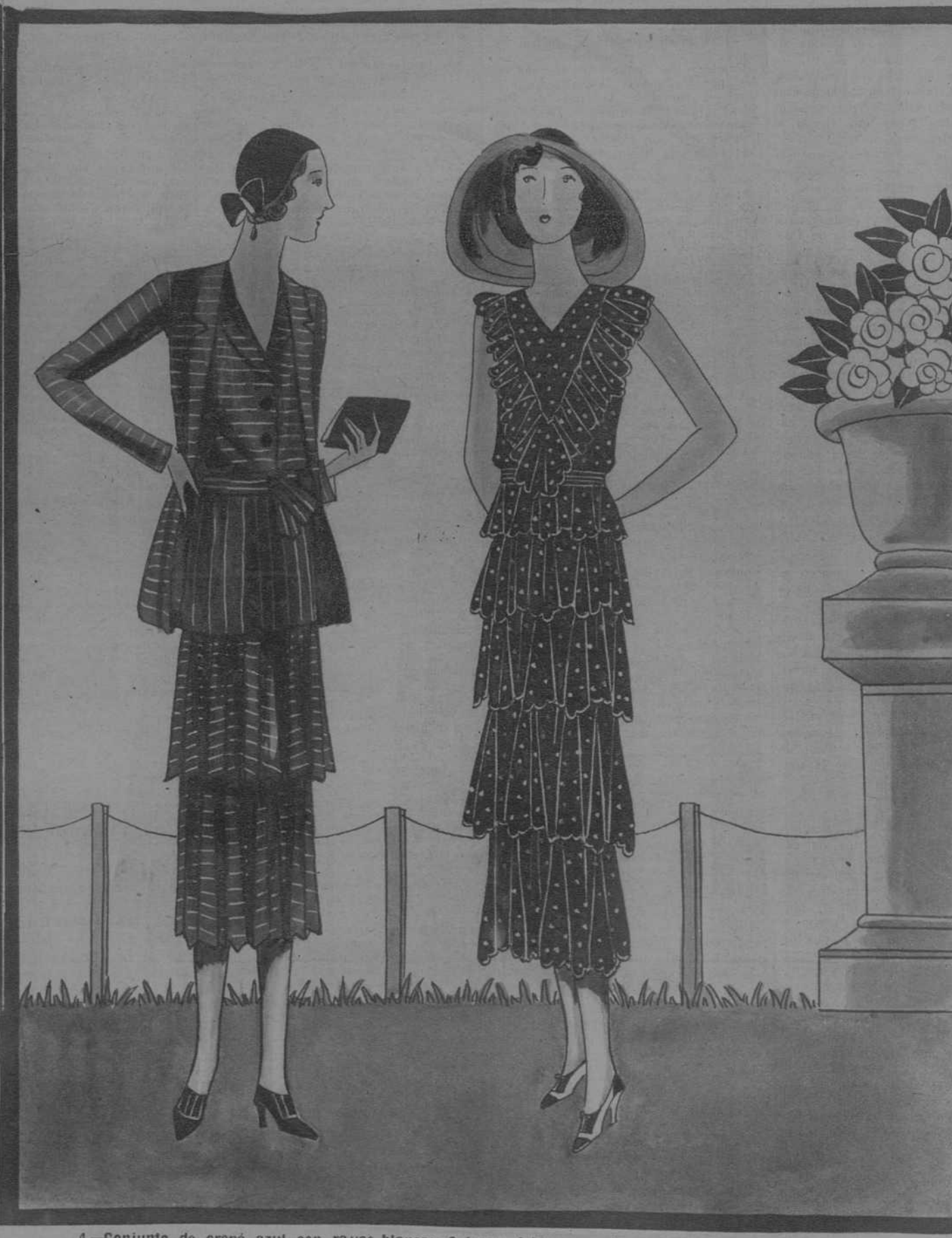
4.—Conjunto de crepe azul con rayas blancas. Sobre la falda, dos volantes plisados. La blusa, cerrada por dos botones, tiene un cinturón del mismo tejido. Acentúa aún más su ligereza cinco volantes blancos festoneados y fruncidos. Un volante igualmente festoneado y fruncido, describe sobre la blusa una gran V. El cinturón anudado, respuntado con hilo de oro. 5.—Vestido de muselina roja, con lunares blancos. Acentúa aún más su ligereza cinco volantes blancos festoneados y fruncidos. Un volante igualmente festoneado y fruncido, describe sobre la blusa una gran V. El cinturón anudado, respuntado con hilo de oro.