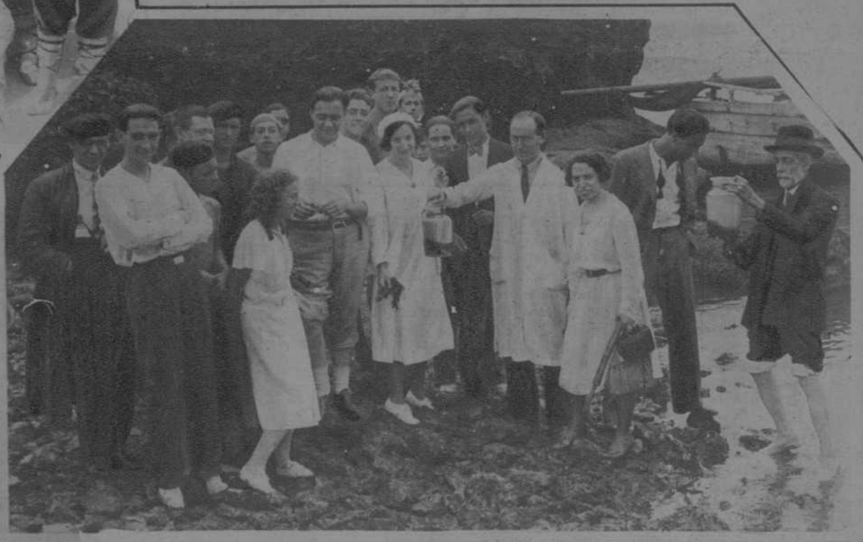
Los escolares mostrando algunos de los curiosos ejemplares de peces capturados en el mar

SANTANDER. — EXCURSION CIENTIFICA DE LOS ALUMNOS DE CIENCIAS NATURALES DE LA UNIVERSIDAD CENTRAL. - (Fots. Samot)