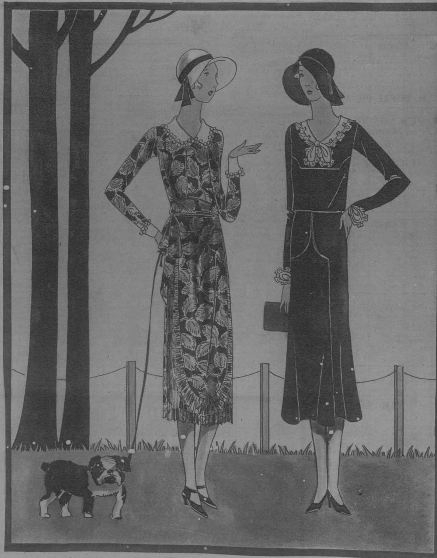
1.—Vestido de china impresa, rojo, blanco y azul, llevando sobre una falda plisada una suerte de delantal cuyos contornos están igualmente adornados con un plisado fino. Cuello y puños, en organdi trabajado. 2.—Vestido de crepe de China marino, cuello y puños de lino y encajes.

Venta: en Droguerías y Colmados. Fábrica: San Eusebio 69. Telef. 79606. BARCELONA