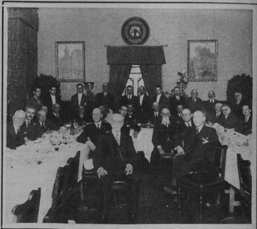
Bilbao.—Banquete con que la Sociedad «El Sitio» ha obsequiado a los supervivientes del sitio de Bilbao.