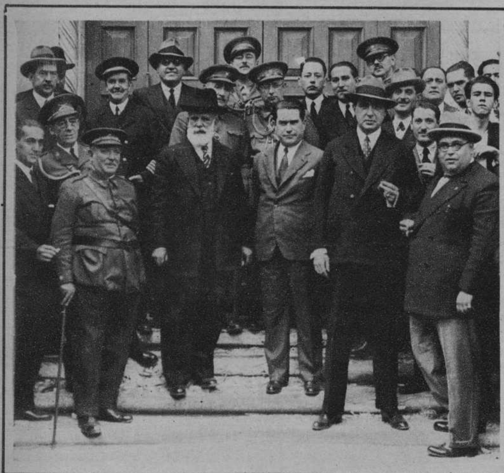
Sevilla.—El gobernador; el alcalde y las demás autoridades y representaciones, durante la inauguración de la Bolsa Municipal del Trabajo.