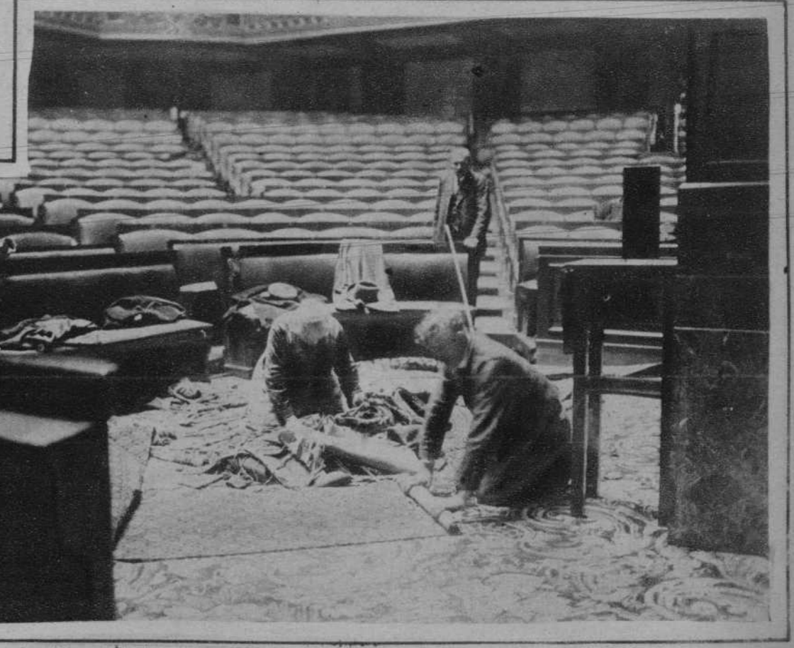
Paris.—Obreros tapiceros, acondicionando la Sala del Congreso, de Versalles, donde ha de celebrarse la próxima elección presidencial.