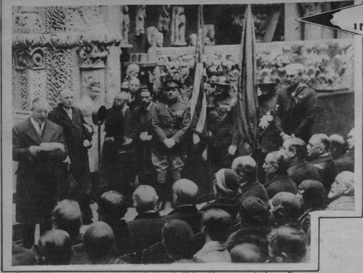
Paris.—El embajador de los Estados Unidos, M. Walter Edge, pronunciando un discurso en el acto inaugural de la estatua del general Grasse, erigida en los jardines del Trocadero.