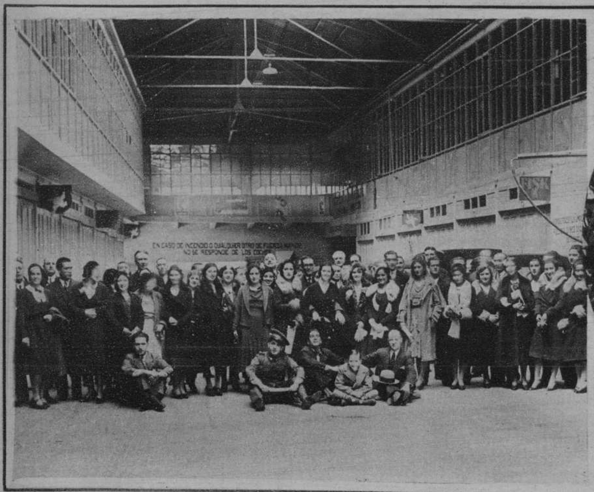
Vigo.—Los rotarios de Coruña y Vigo, después del banquete en que se reunieron, con ocasión de la visita de aquéllos a nuestra ciudad.