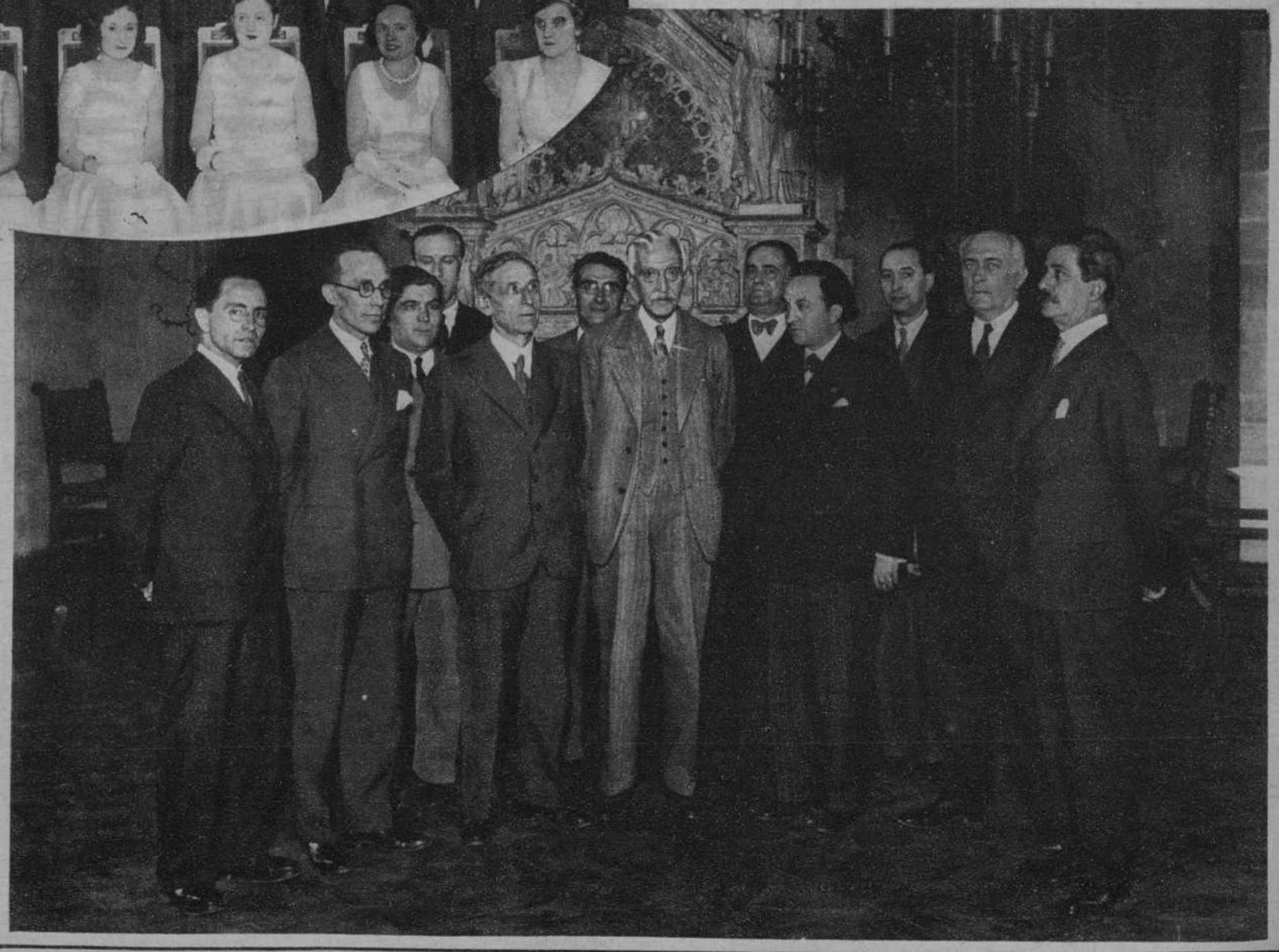
La Junta Directiva de la Sociedad «Cultura y Sports», en su visita de presentación al Presidente de la Generalidad de Cataluña.