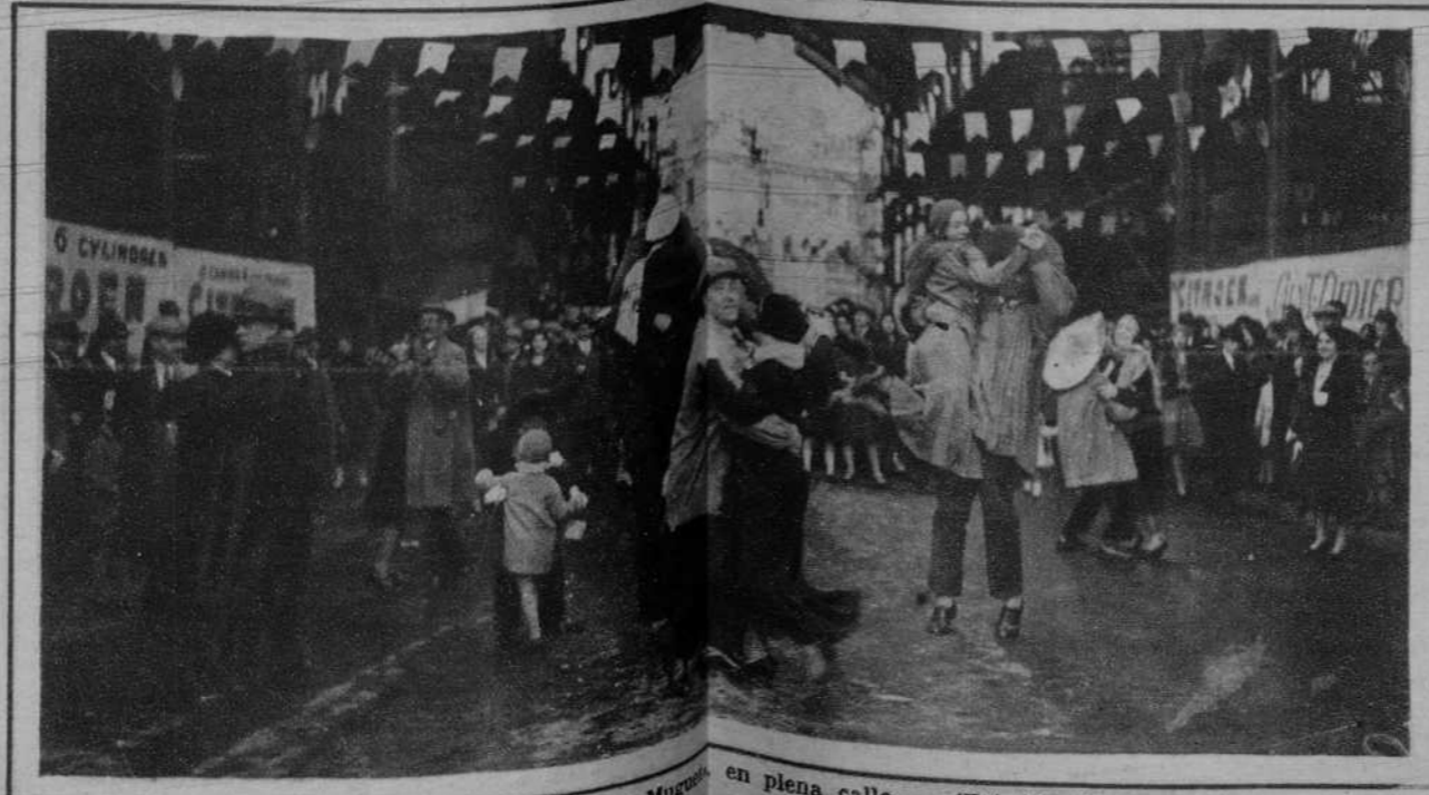
Paris.—La «Fiesta del Museo» en plena calle.