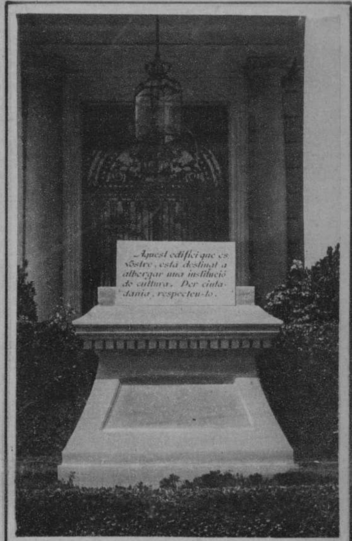
Los jardines del ex palacio real de Pedralbes, abiertos al público. Uno de los rótulos en que se advierte que el edificio será destinado a albergar una institución de cultura y debe respetarse.