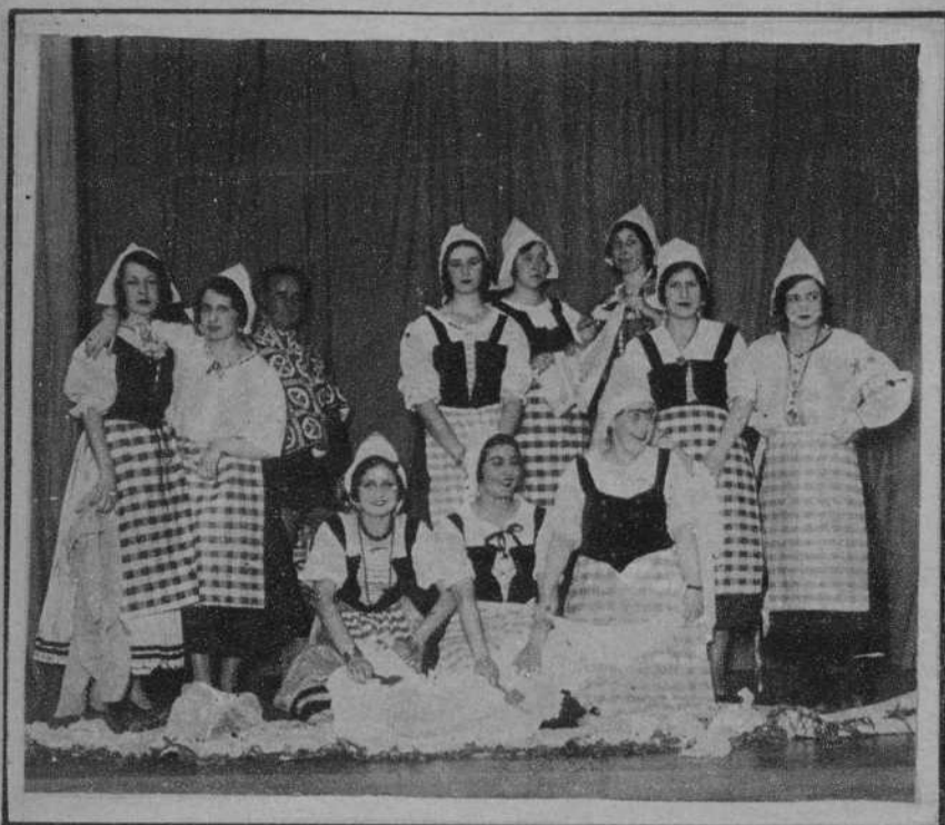
San Sebastián.—Señoritas que tomaron parte en la función benéfica celebrada en el Teatro Novedades. — (Fot. Photo-Carte)