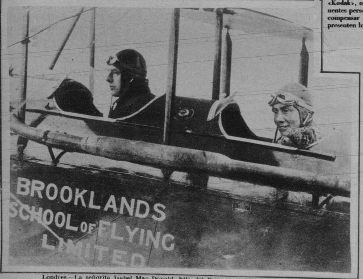
Londres.—La señorita Isabel Mac Donald, hija del Primer ministro de Inglaterra, durante los exámenes que ha realizado para obtener el título de piloto aviador.