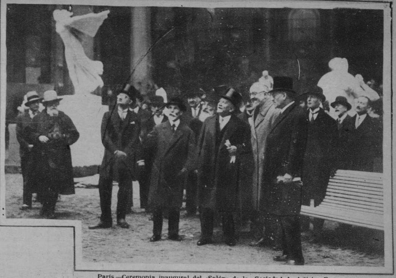
Paris.—Ceremonia inaugural del «Salón» de la «Sociedad de Artistas Franceses», cuyo acto presidió el señor Doumergue.