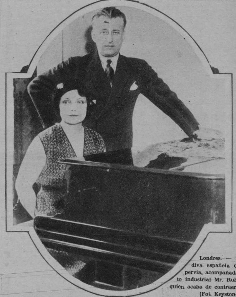
Londres.—La eminente diva española Conchita Supervia, acompañada del opulento industrial Mr. Rubenstein, con quien acaba de contraer matrimonio.