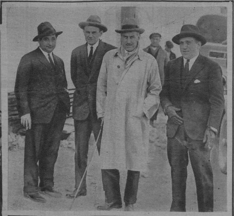
Los aviadores Franco y Ruiz de Alda en el campo del "Betis Balompié" de Sevilla.