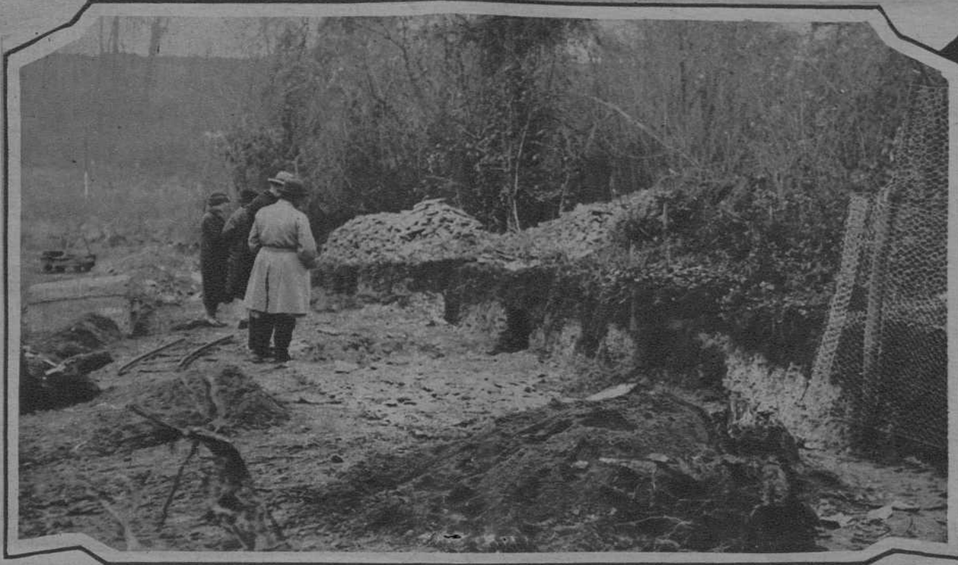
Yacimientos prehistoricos descubiertos en Saint Auen (Francia) Proyecto de monumento a Hungesser y Coli, que se levantará en Etrerat. (Francia)

Barcelona, viernes 10 de Febr. ro de 1928