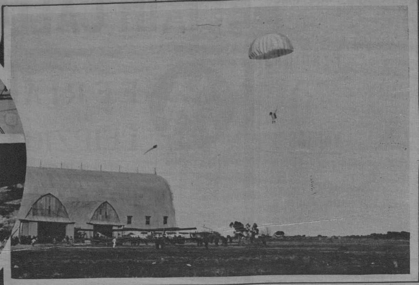
Pruebas de un paracaídas en el aeródromo del Prat. Momento de aterrizar el paracaídas