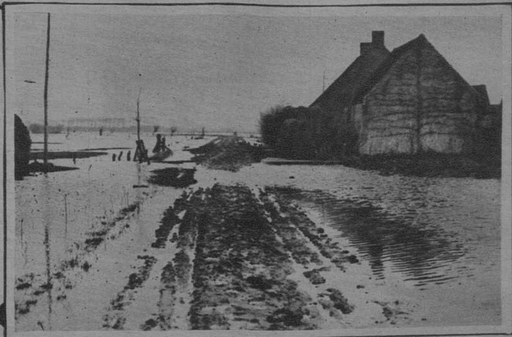
Las inundaciones de Flandes. - Dos detalles de la campiña convertida en laguna.