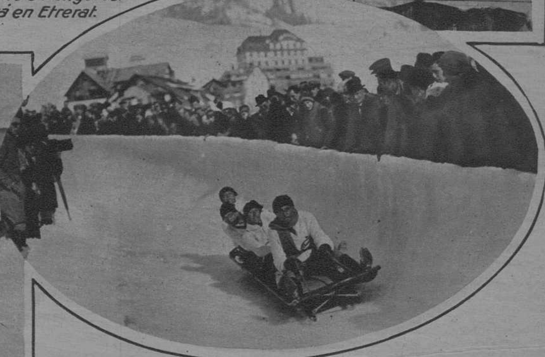
Los concursos de deportes de invierno en Davos. En camino de las pistas. - El concurso de bolsleigh.