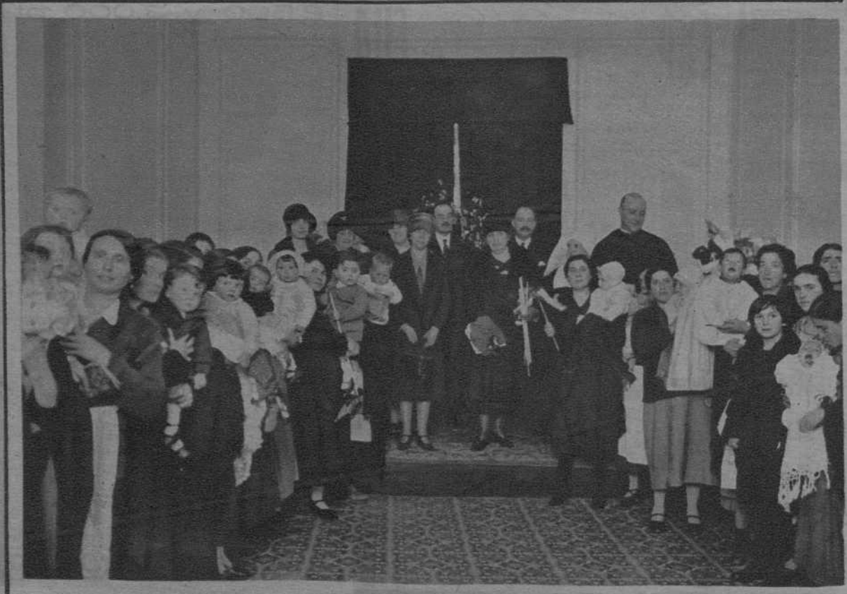
Reparto de ropas y juguetes de las acogidas en el Dispensario de Niñas de Pecho y Gota de leche.