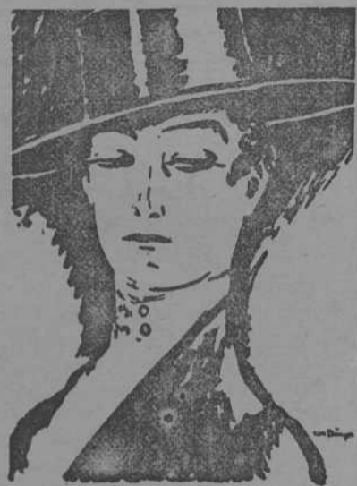
VICENTE ESCUDERO (Por Van Dongen)

Un bailarín español de la clase de "castizos", gitano de pura cepa y, además, natural de Valladolid, no es cosa fácil de encontrar todos los días... Sin embargo, ese ser casi fantástico, es una figura popular en París, donde ya hace años que reside y en donde se le admira y se le quiere. No hay gran fiesta ni "soirée" de alguna importancia en cuyo programa no figure ese mago de la danza. Escudero ocupa un puesto, y un puesto distinguido, en esa primera fila de artistas españoles que se llaman "La Argentina", Falla, Picasso y algún otro... Y conste que incluimos en la lista al gran pintor malagueño a título de renovador, naturalmente, pero sin que su arte tenga nada que ver con el de la gran bailarina o el del insigne compositor.