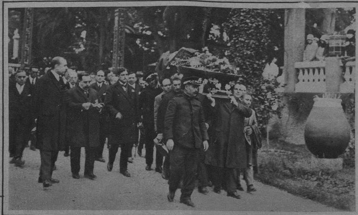
El entierro de Blasco Ibañez en Menton. - Momento de sacar el féretro de "Fontana Rosa"