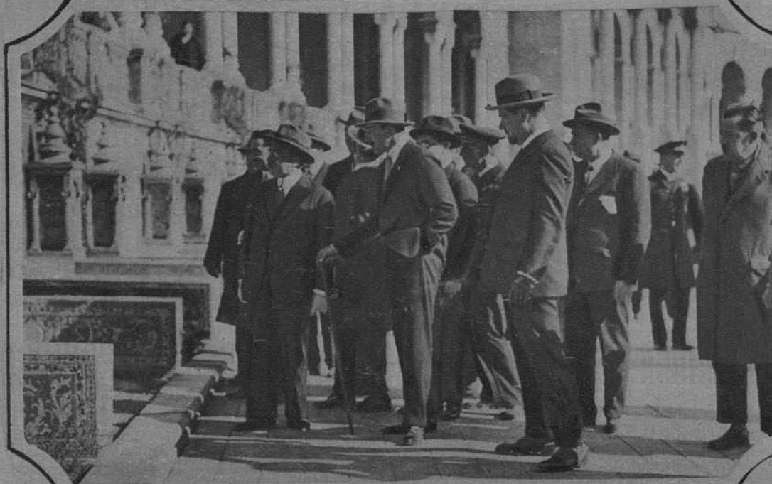
El viaje del Rey a Sevilla S. M. visitando la Plaza de España en la Exposición Ibero-Americana