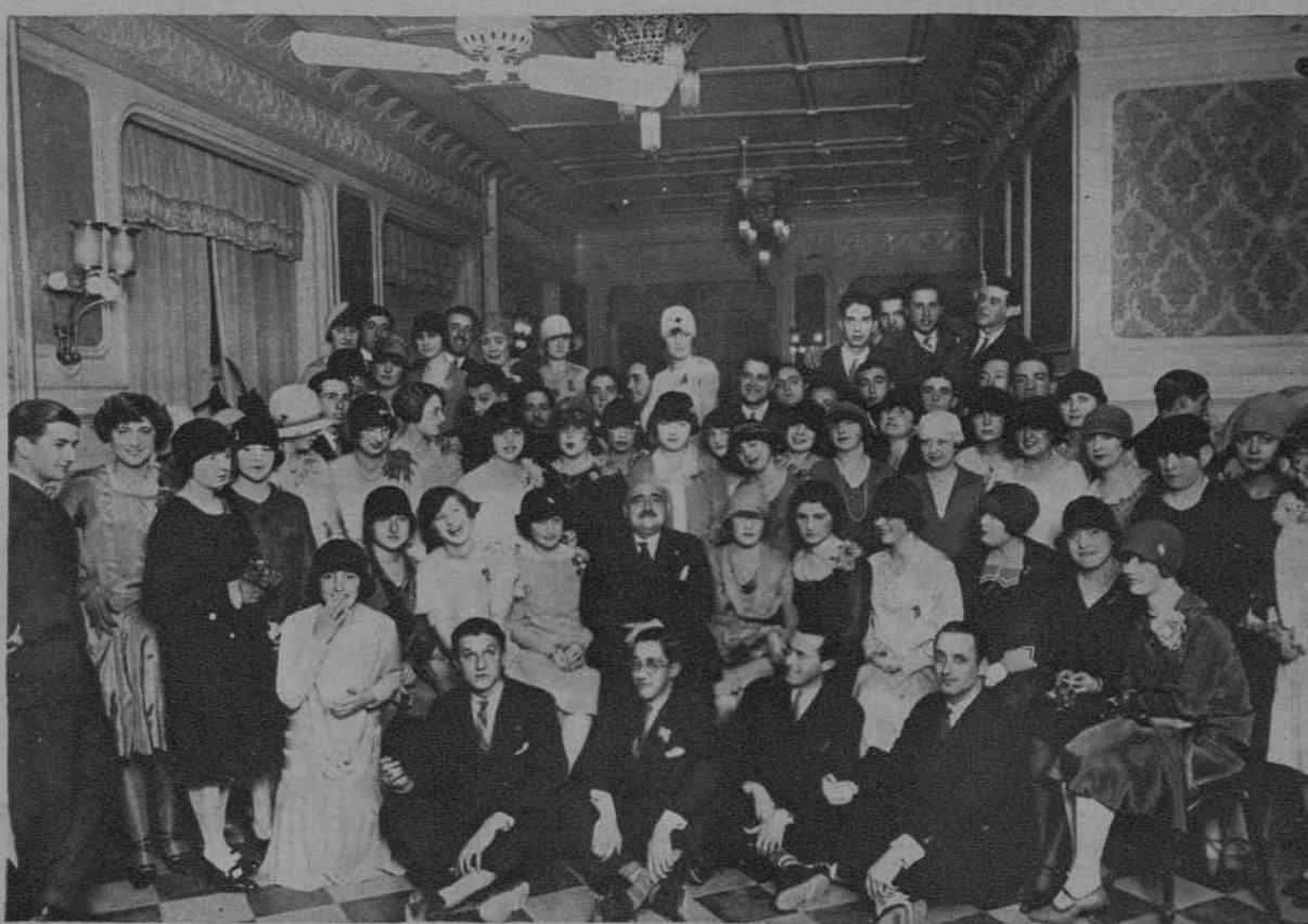
Té con que obsequió el Ayuntamiento de Valencia a las jóvenes que sirvieron la comida a los pobres el día del santo del Rey