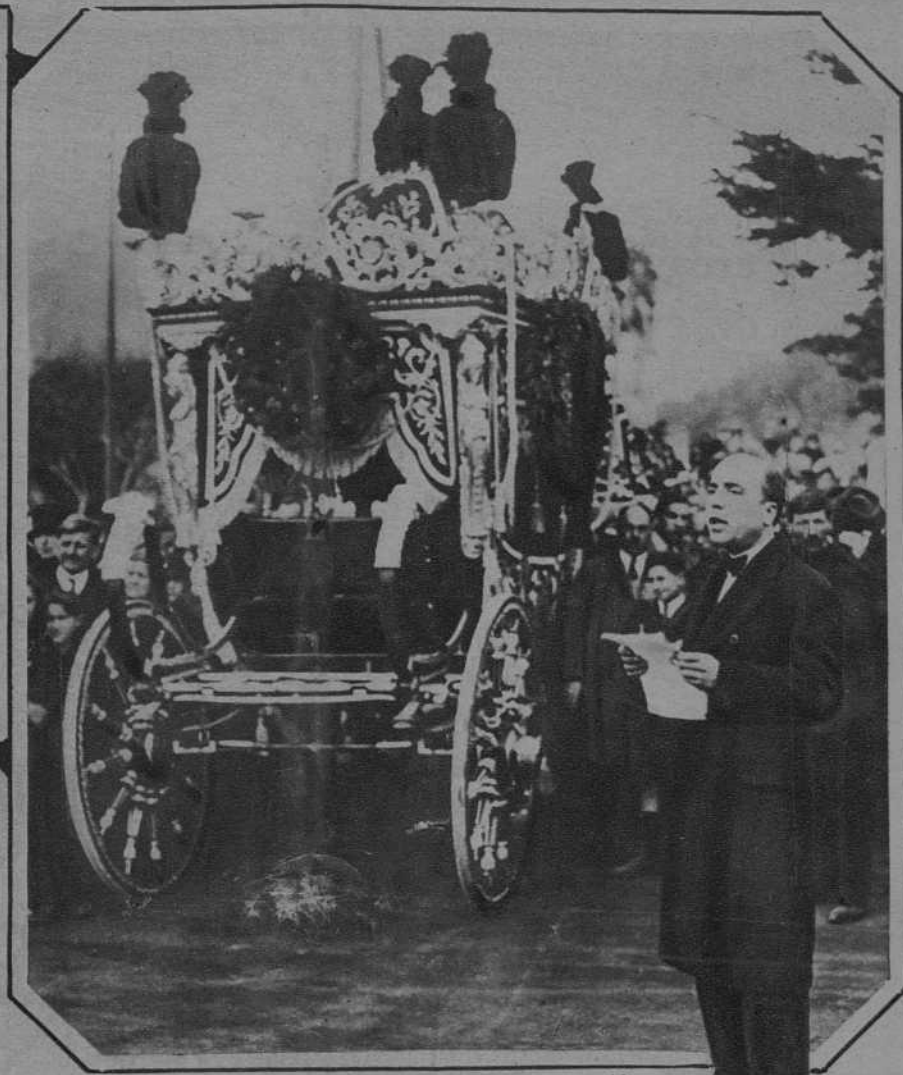
El Sr. Ortega Gasset leyendo unas cuartillas al llegar la comitiva al Cementerio.