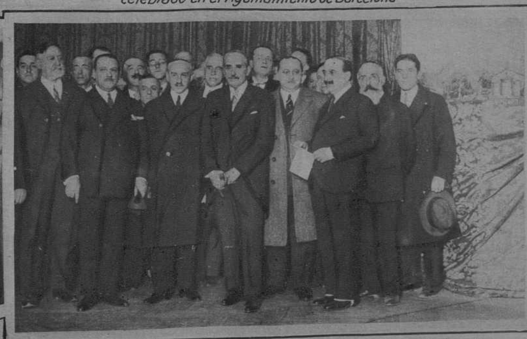
Inauguración en el Círculo de Bellas Artes de Madrid de la Exposición escenográfica de D. Salvador Alarma.