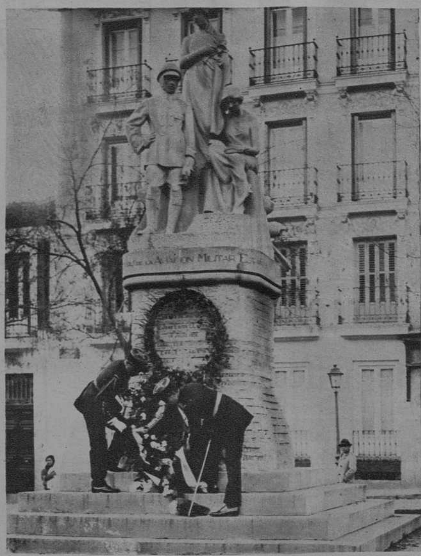
Comisión de militares peruanos depositando una corona en el monumento a los aviadores muertos en Africa en Madrid.