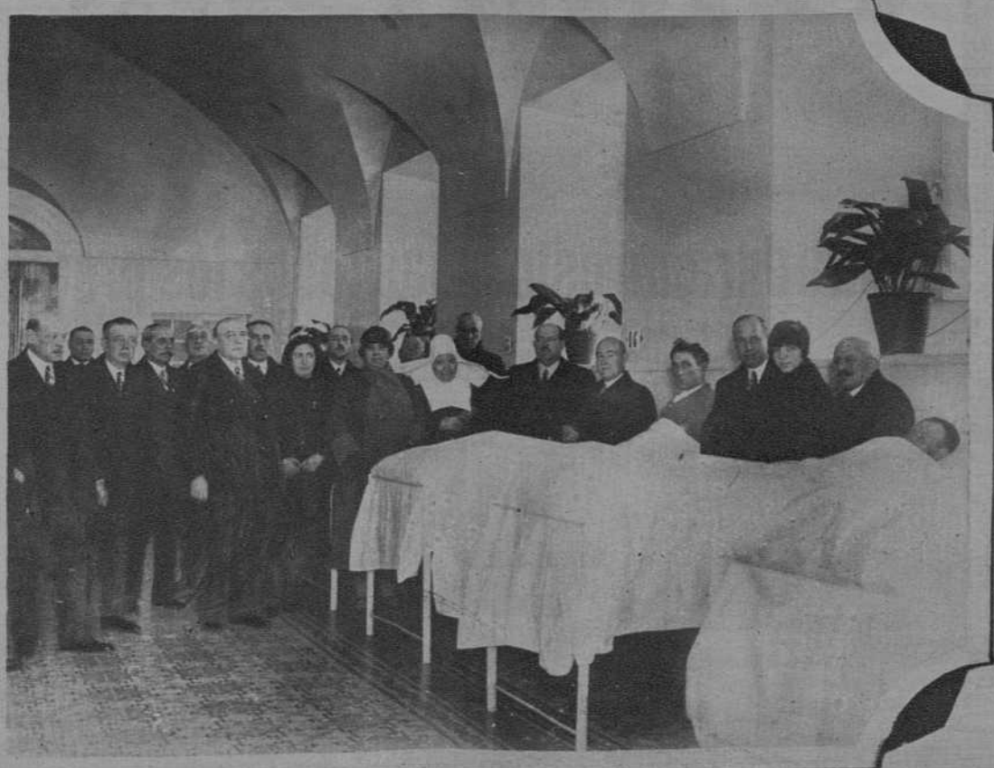
Visita a los enfermos