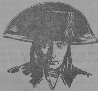
El film más grande que se ha filmado hasta la fecha

A. M. S.—Mi mayor deseo desde que se inauguró este artístico arte mudo, es poder llegar a ser uno de los simpáticos actores de la pantalla, para poder gozar de tan bello arte.