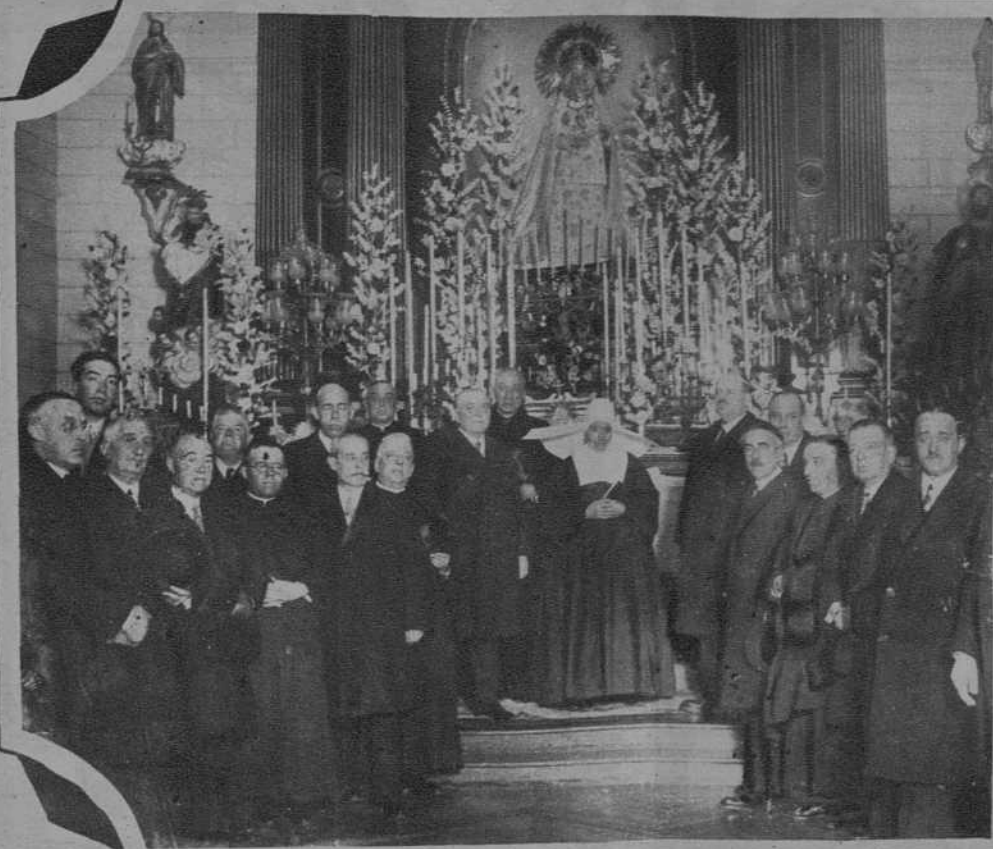
MADRID La fiesta de la Virgen en el Hospital Provincial La fiesta religiosa