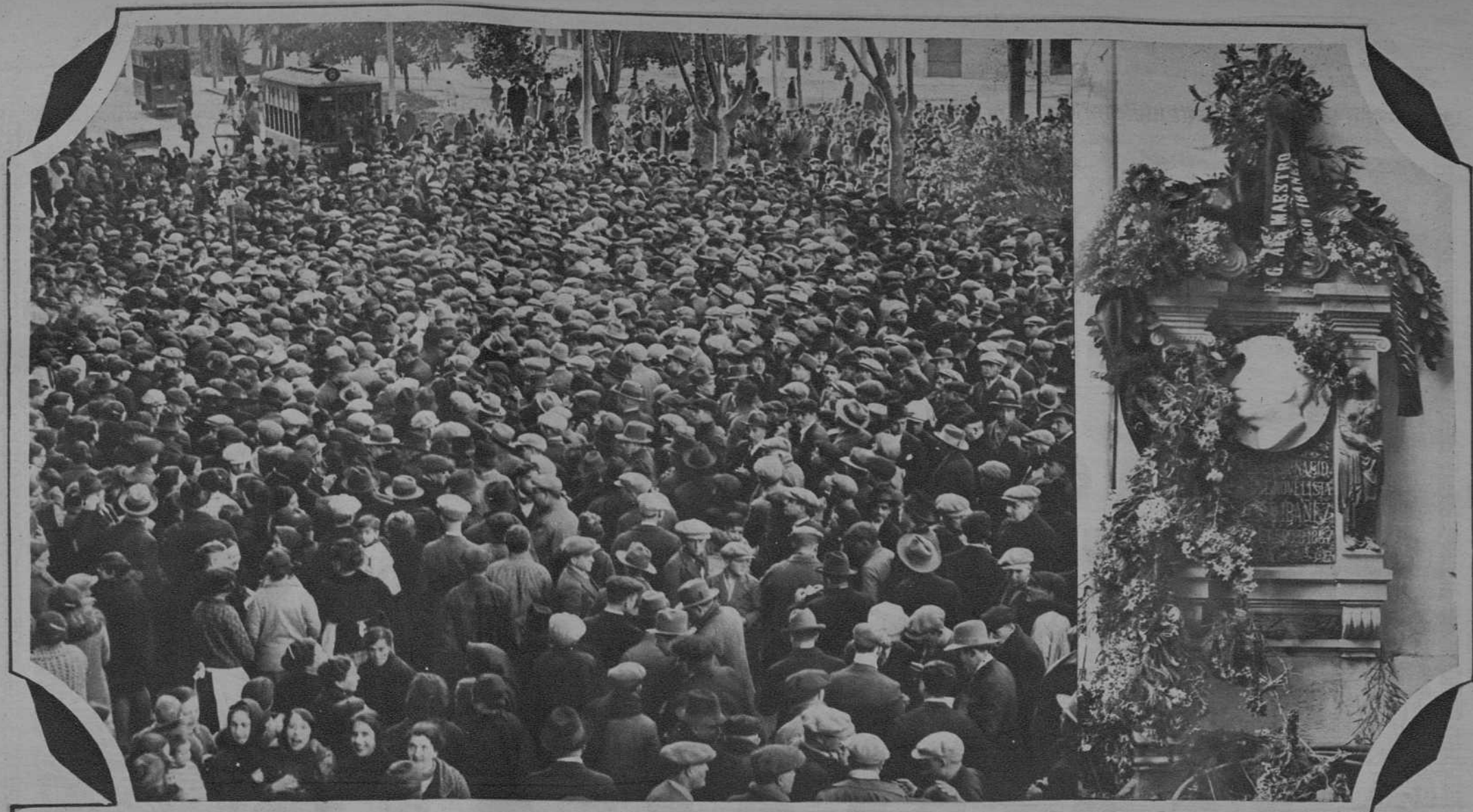
Manifestación de duelo en Valencia por la muerte de Blasco Ibañez. - El público ante la "Editorial Prometeo". - La lápida colocada en la casa natal de Blasco Ibañez cubierta de flores.