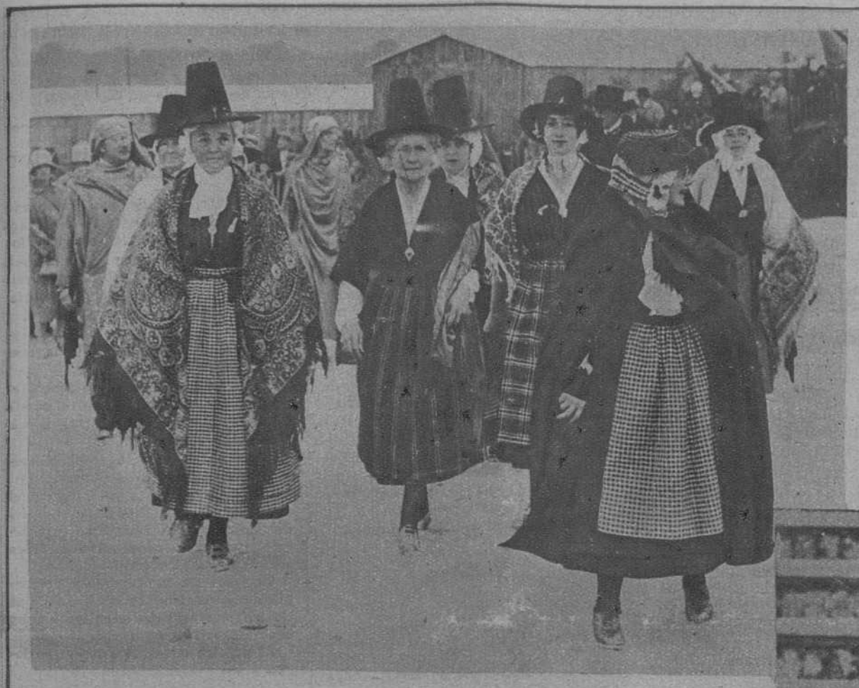
RIEC (Bretaña francesa).—Grupo de mujeres de Gales en las fiestas célticas que acaban de celebrarse.