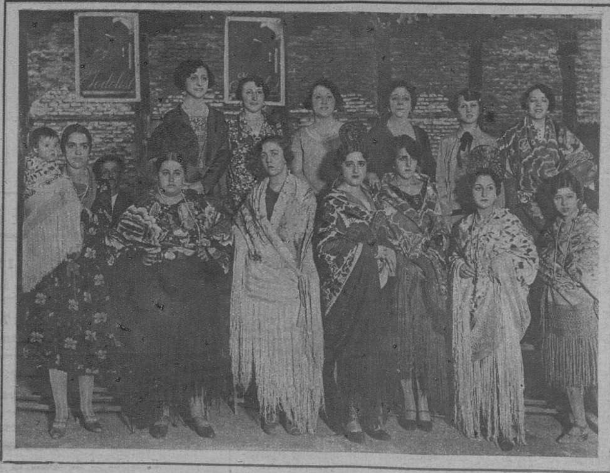
MADRID.—Jóvenes premiadas en el concurso de mantones celebrado en el Puente de Vallecas.