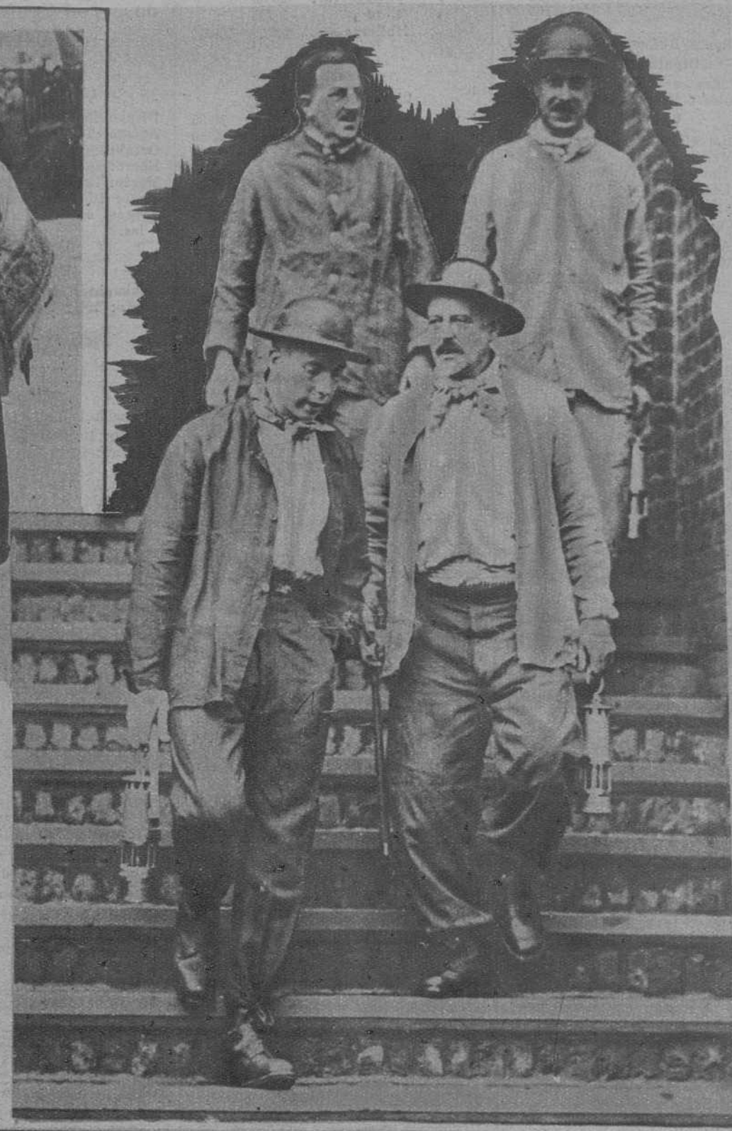
MONS (Bélgica).—El príncipe Carlos estudia personalmente el problema de las minas de carbón.