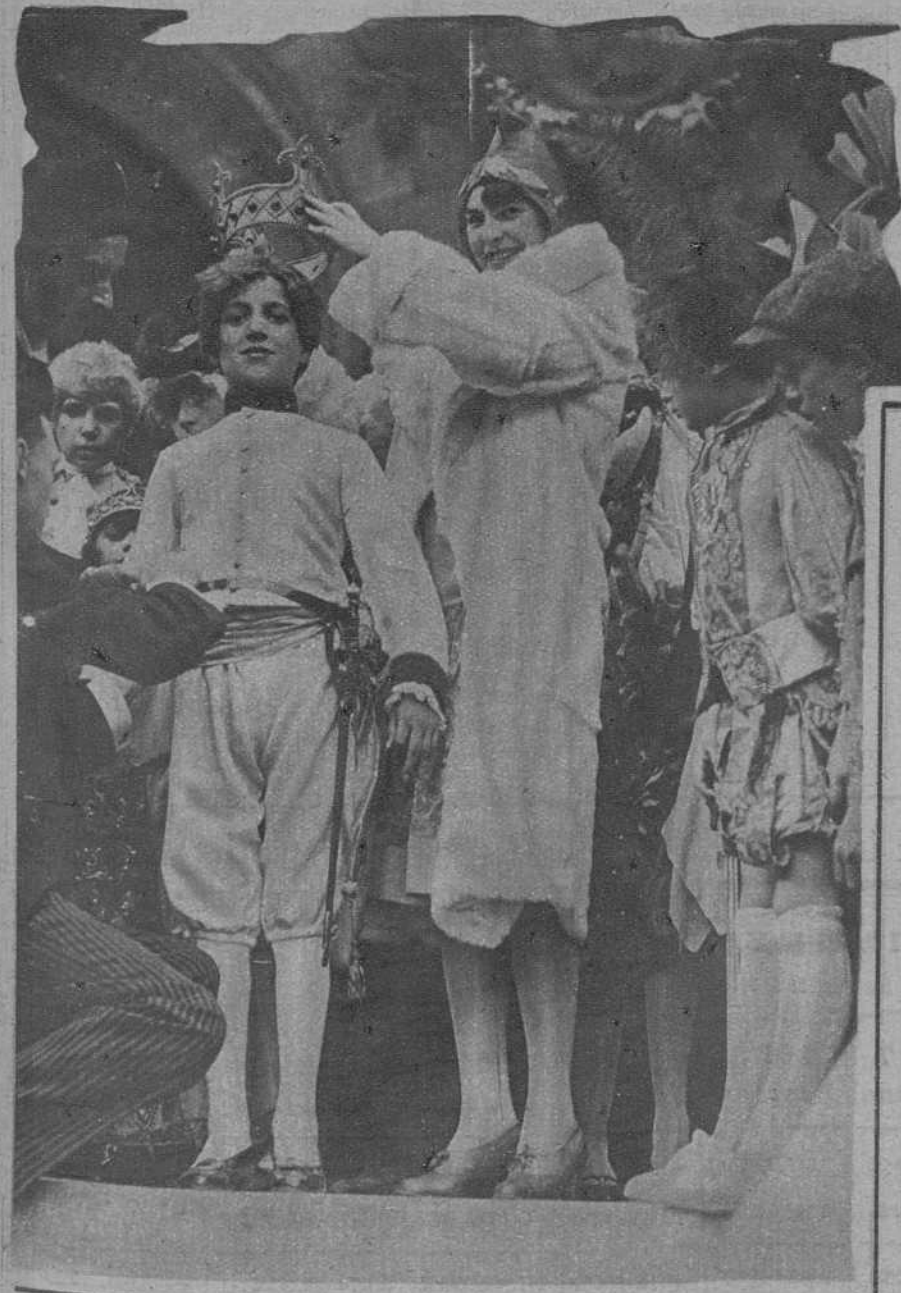
PARIS.—La coronación de «Titi I», rey de los «trinxeraires», en la plaza de la Opera.