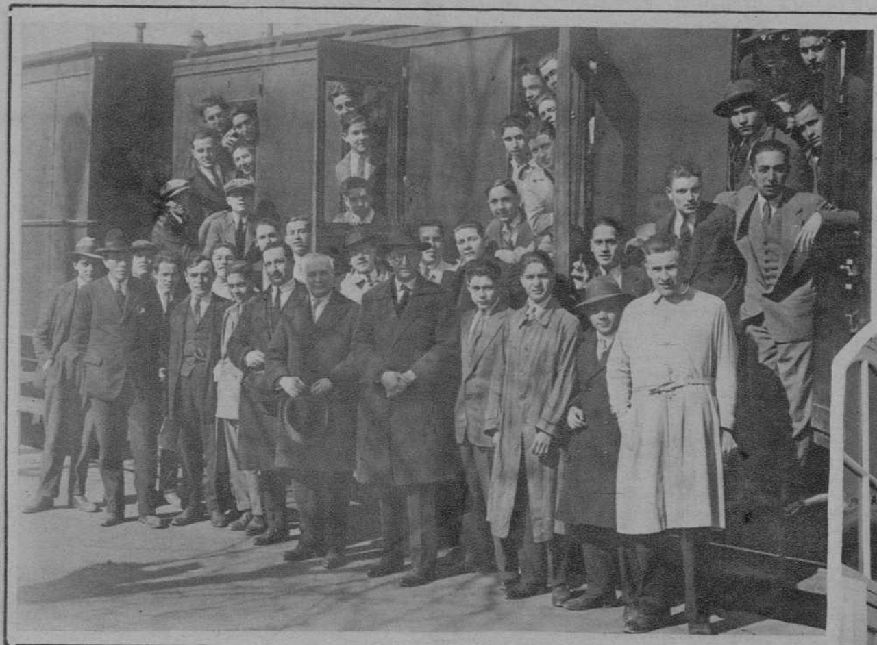
CORDOBA.—Alumnos de la Escuela Normal de Maestros que han marchado a Málaga y Granada en viaje de prácticas