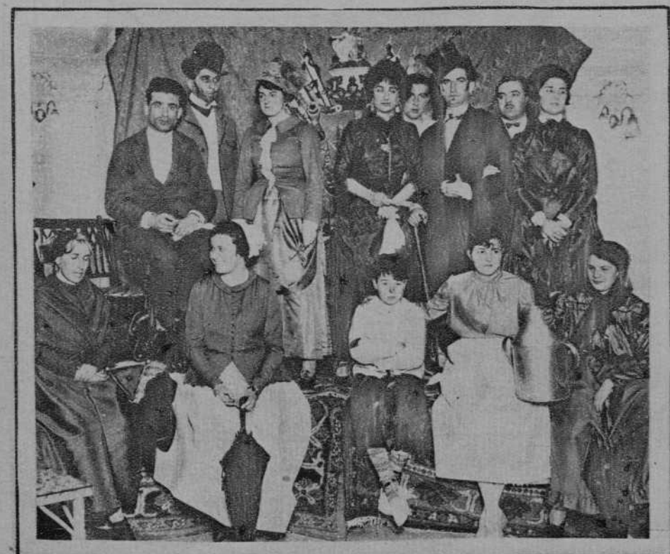
BILBAO.—Aristócratas que tomaron parte en la velada a la memoria del pintor Guard.