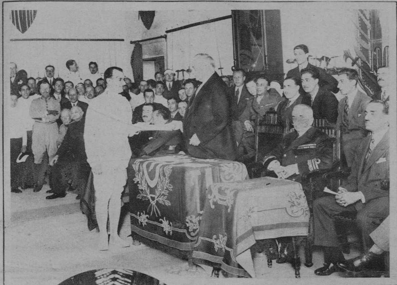
MADRID.—El presidente del Consejo entregando los premios de la «Asociación de esgrimidores de Madrid» a los vencedores en los torneos celebrados durante el año último.