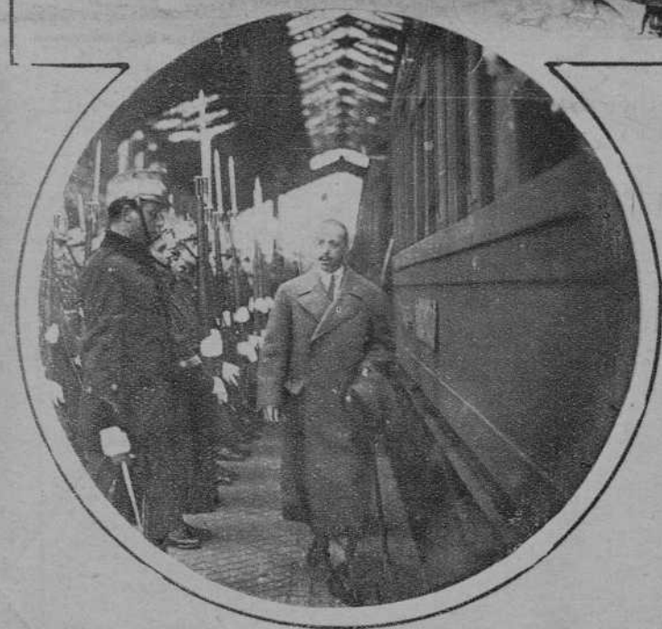
SAN SEBASTIAN.—S. M. el rey revistando las fuerzas que le rindieron honores a su llegada a la estación. (Fot. Marin).