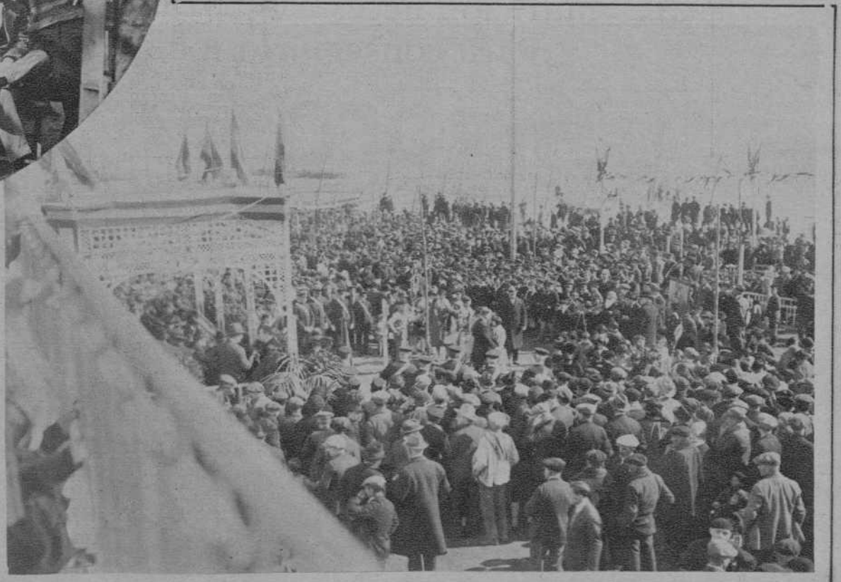
MATARO.—Un aspecto de la fiesta del árbol celebrada junto a la playa.