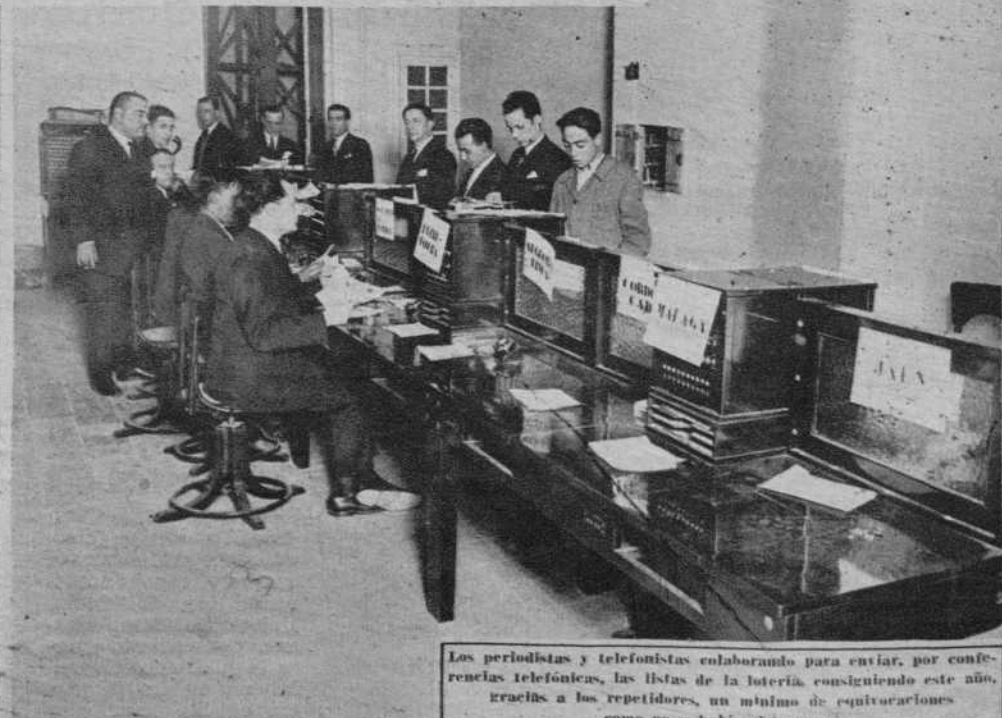
Los periodistas y telefonistas colaborando para enviar, por conferencias telefónicas, las listas de la lotería, consiguiendo este año, gracias a los repetidores, un número de equitativaciones como no se había visto nunca