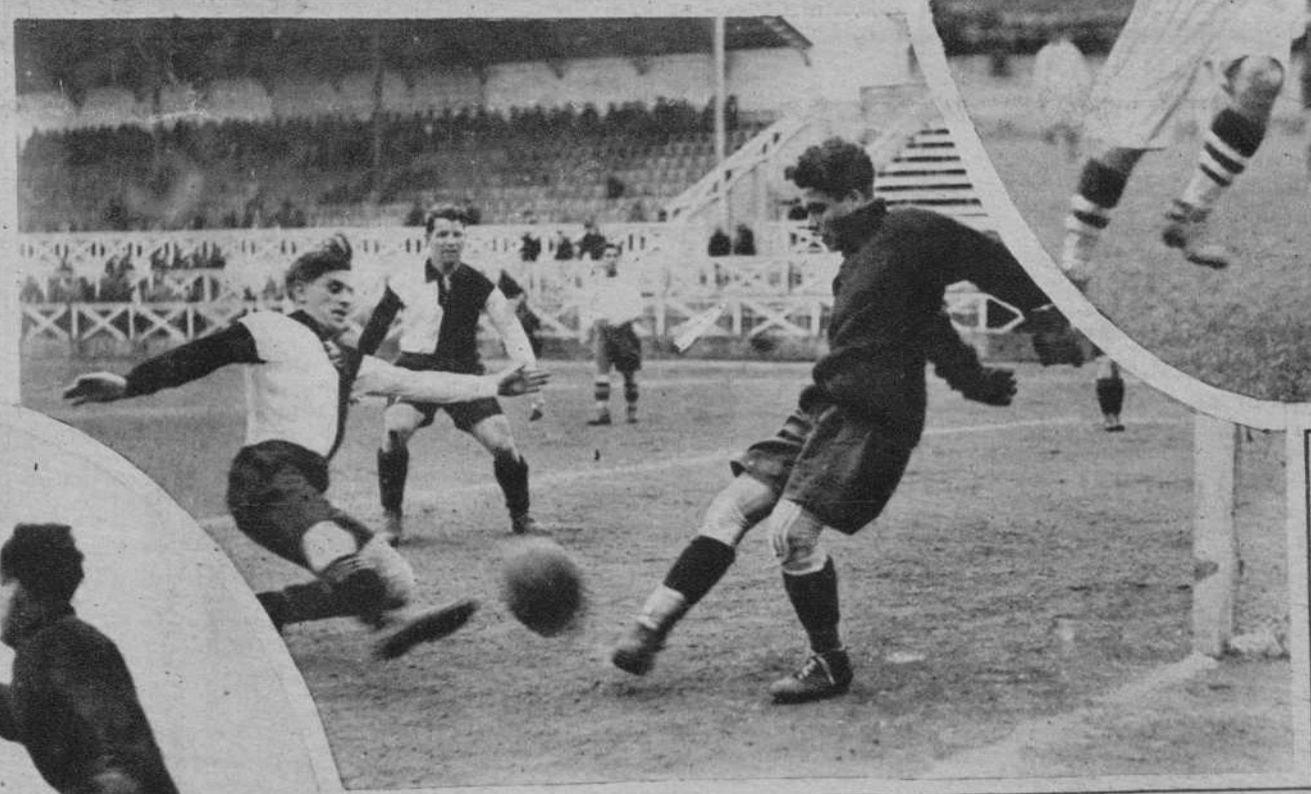
«Europa»-«Admira de Viena»-Un avance de los austriacos