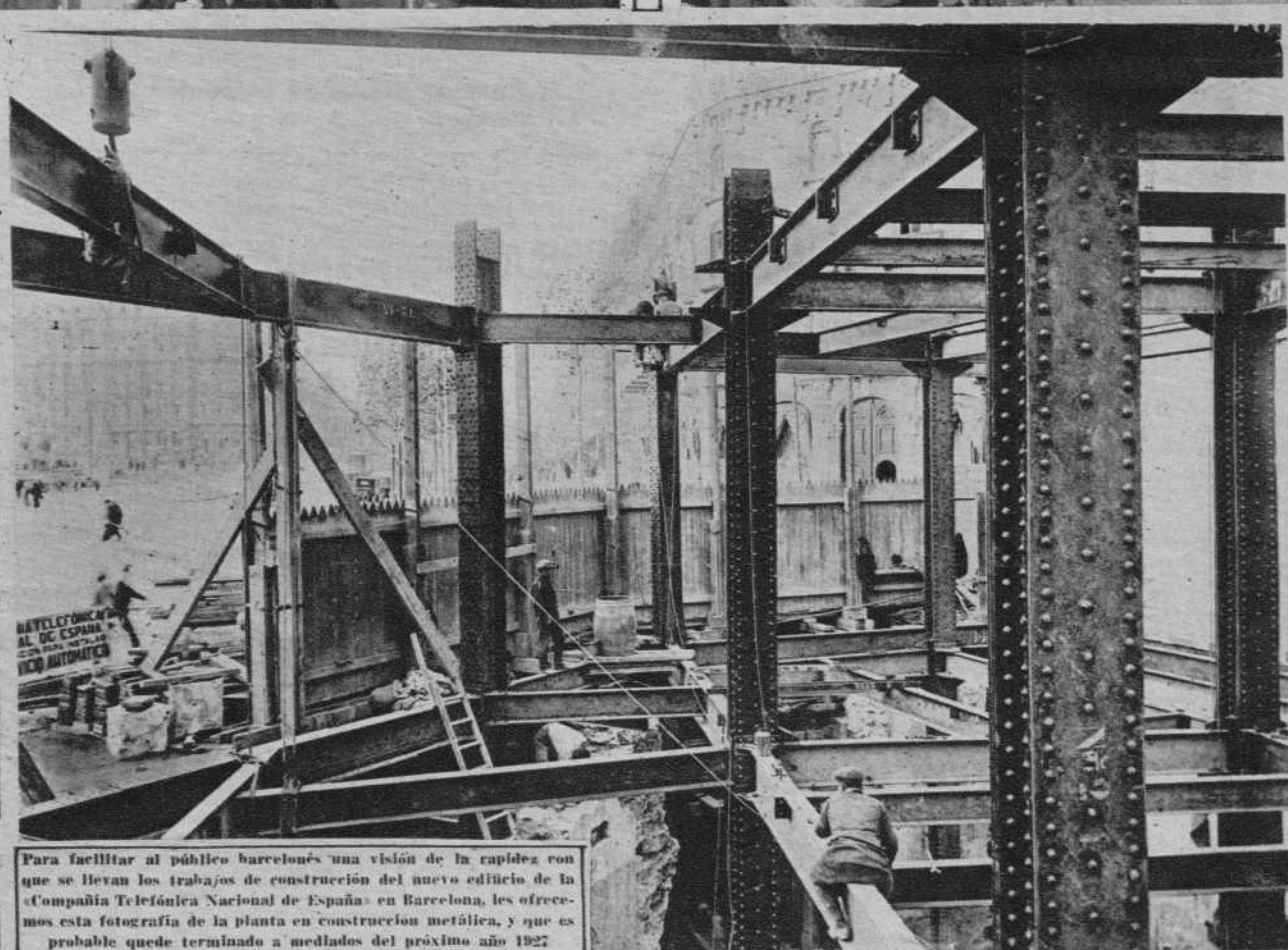
Para facilitar al público barcelonés una visión de la rapidez con que se llevan los trabajos de construcción del nuevo edificio de la Compañía Telefónica Nacional de España en Barcelona, les ofrecemos esta fotografía de la planta en construcción metálica, y que es probable quede terminado a mediados del próximo año 1927