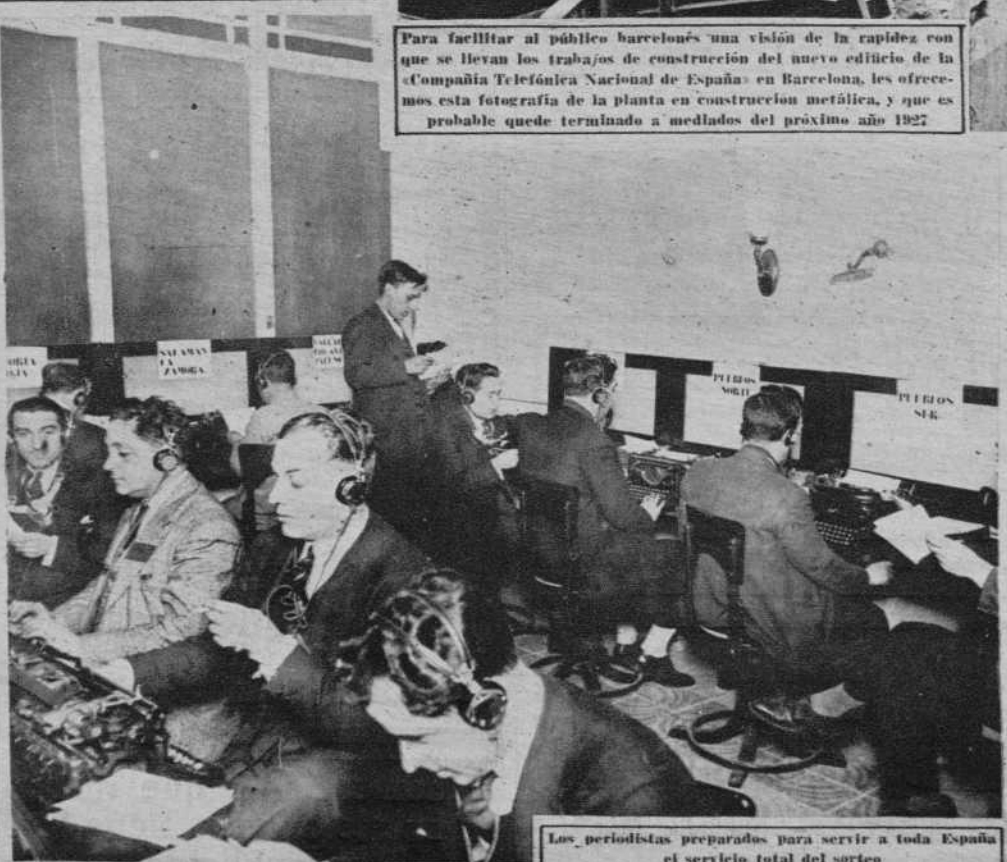
Los periodistas preparados para servir a toda España el servicio total del sorteo