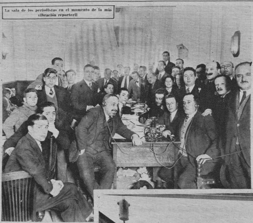
La sala de los periodistas en el momento de la más vibración reporteril