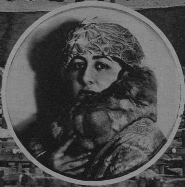
La ilustre Diva Española Mercedes Capsir y demás artistas que hoy inauguran el Gran Teatro Natural en las Arenas de Barcelona.