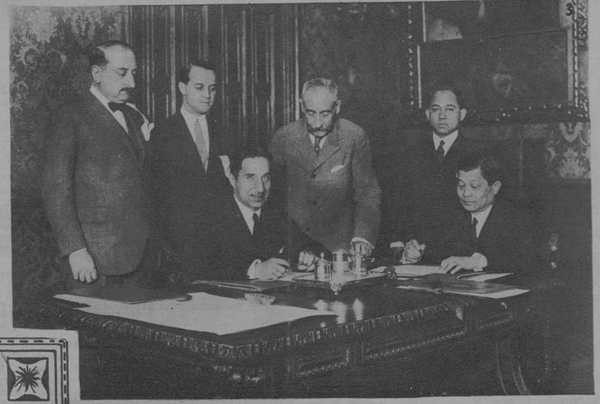
Paris.- I.- El Sultán de Marruecos acompañado de altas personalidades, visitando la Torre Eiffel. II.- El Sultán en una de las tiendas de la Torre Eiffel, adquiriendo diferentes objetos. III.- Madrid.- El Ministro de Estado, y el Ministro de Siam, firmando el Tratado entre España y Siam.