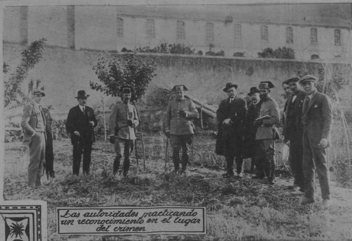
Las autoridades practicando un reconocimiento en el lugar del crimen