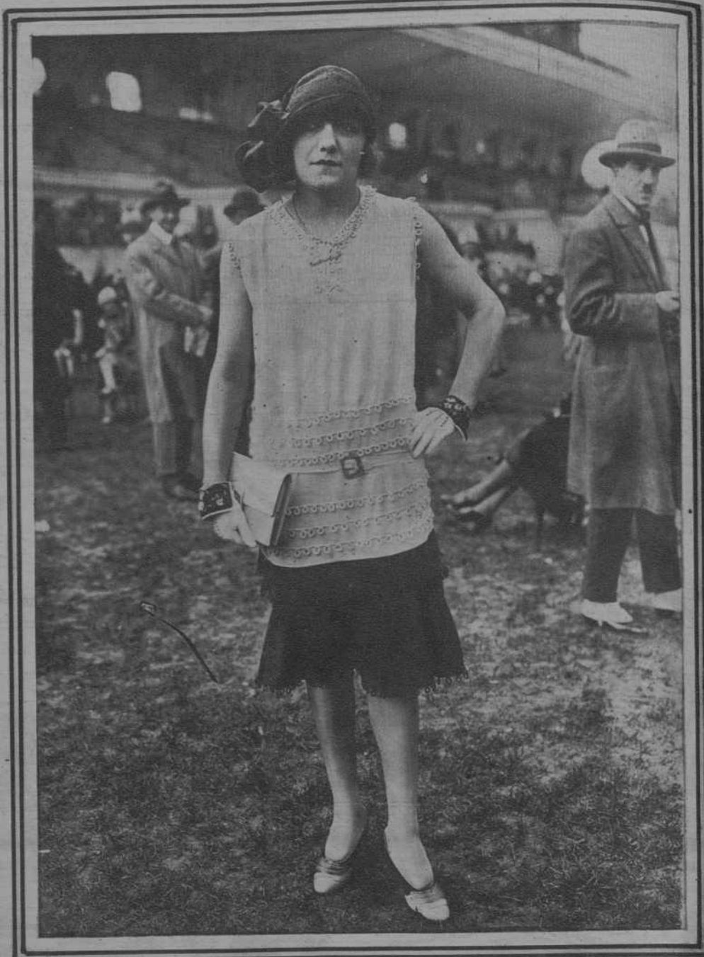
Paris.- La Moda en las Carreras.- Las faldas se acortan cada vez más; si sigue así la Moda, pronto se llevará por encima de las rodillas.