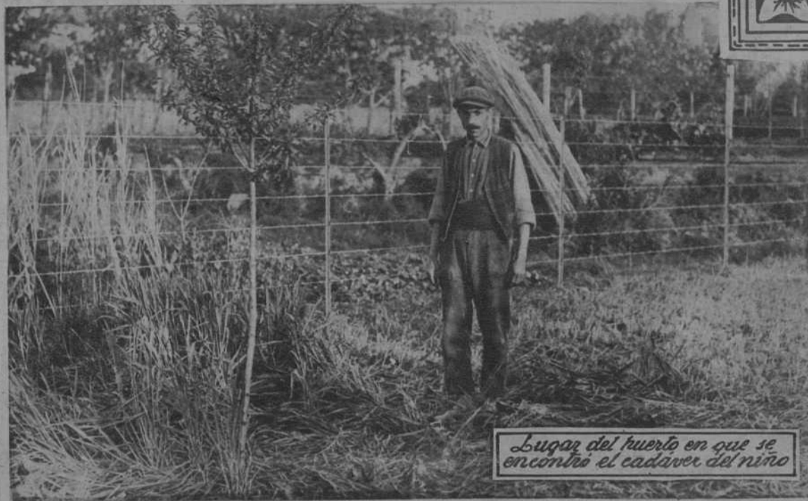
Lugar del huerto en que se encontró el cadáver del niño