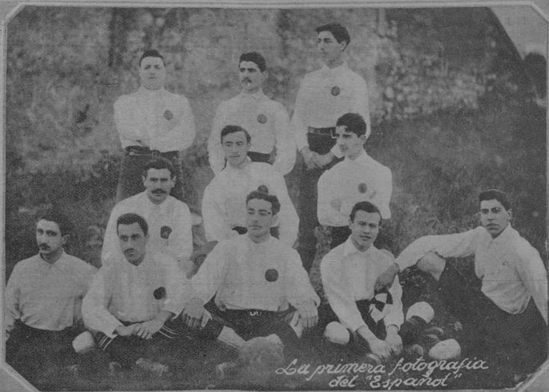
La primera fotografía del "Espanol"