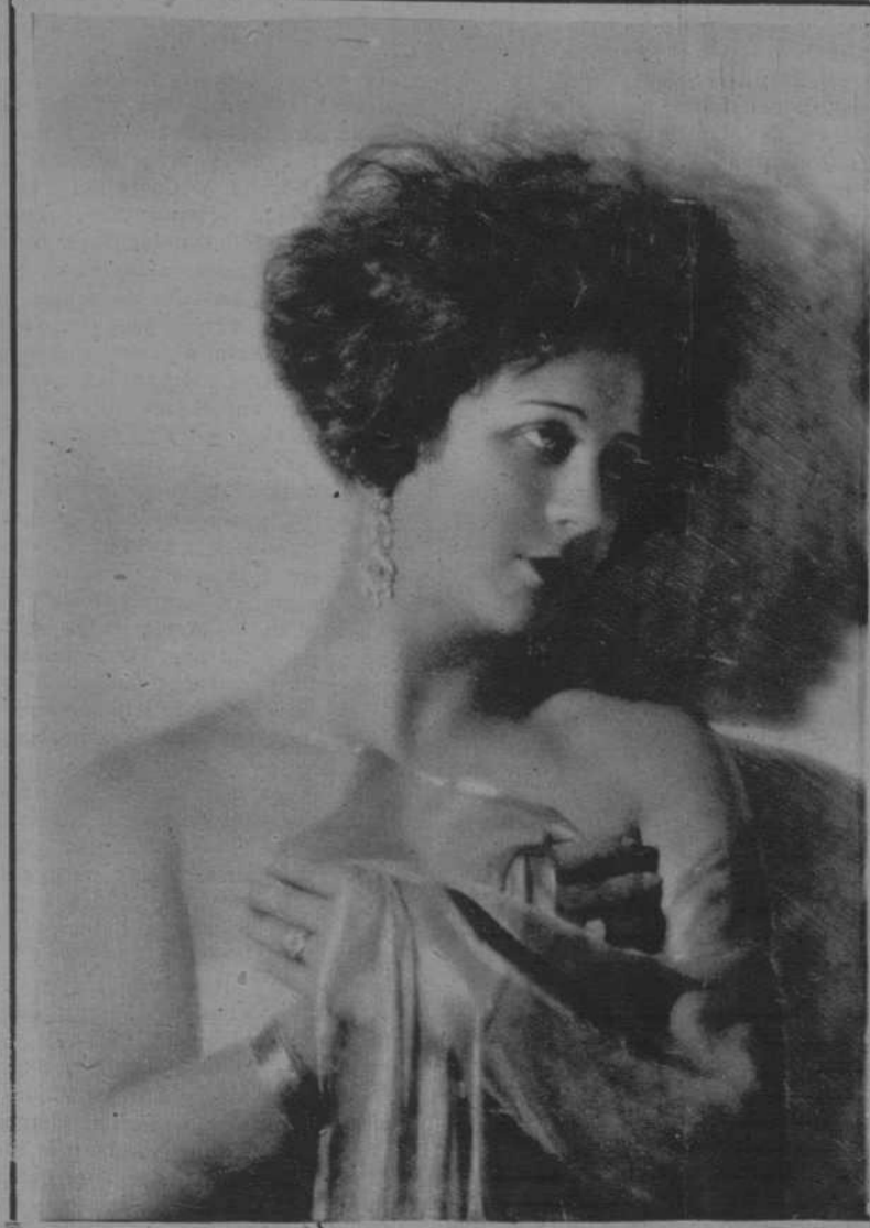
La genial canzonetista Elvira de Amaya que se despide el domingo del público de Barcelona