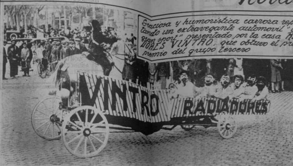
Sarcástica y humorística carroza representando un extravagante automóvil "tipo 1919" presentado por la casa "RAMA SONS VINTRO", que obtuvo el primer premio del grupo tercero