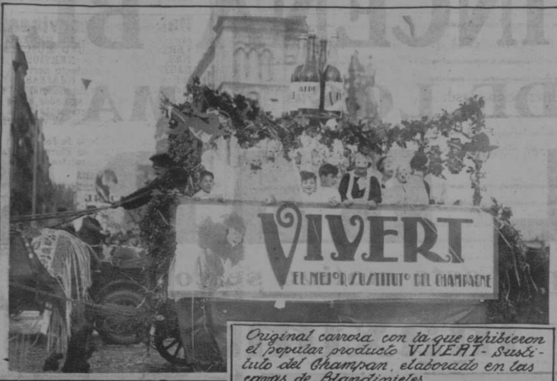
Original carroza con la que exhibieron el popular producto VIVERT- Sustituto del Champagne, elaborado en las caves de Blandinielles