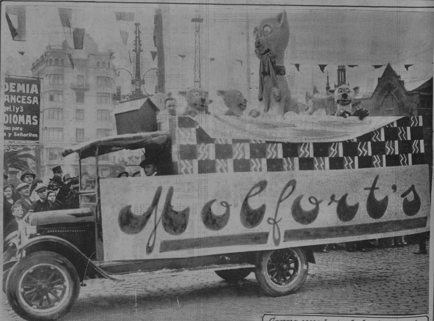
Carroza reproduciendo las figuras y los elementos decorativos del ya popular y famoso cartel anunciador de los Caramelos Molfort's