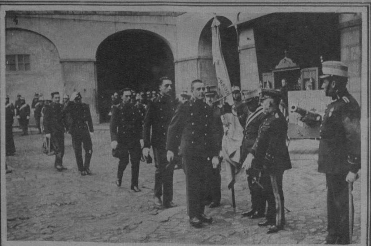
De fútbol: Héctor Scarone, el notable jugador olímpico, que el domingo se presentó en Las Cortes. - 2. Osasuna-Barcelona: Uno de los goles que obtuvo Alcantara, ejecutado magistralmente. - 3. Asamblea celebrada por la Unión de Delegaciones de Cataluña en el Teatro Poliorama. - 4 y 5. La Jura de la Bandera celebrada el domingo en los Cuarteles de Artillería y Jaime I.