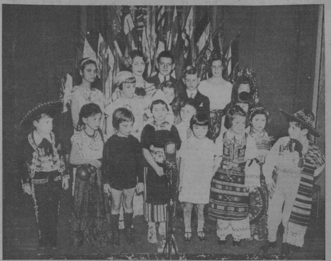
Los niños de los principales diplomáticos acreditados en Nueva York se han reunido en una fiesta para transmitir, en nombre de los niños de su respectivo país, su felicitación de Pascuas a los niños del mundo. Helos aquí ataviados algunos con los trajes nacionales, como ese mejicano pinturero y la graciosa nicaragüense que está junto a él. En cambio, la japonesa se viste con sencillas galas europeas.