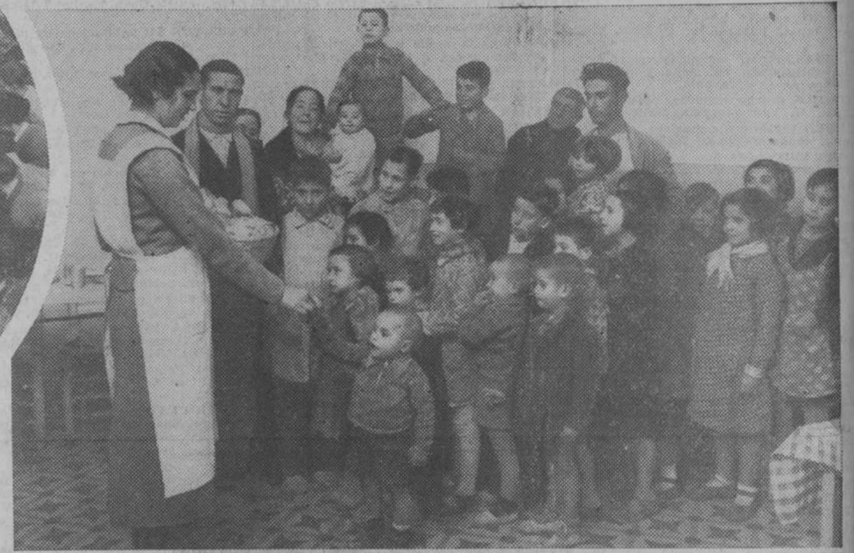
Reparto de pan en los comedores de las Damas Apostólicas de Valencia