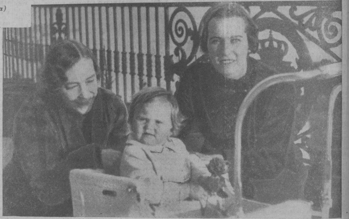
Desde la trágica muerte del rey Alberto de Bélgica, ésta es la primera «foto» en que aparece la reina Isabel en compañía de su hija, la princesa María de Piamonte, y de su nieta, la princesa María Pía, en la terraza del palacio de Nápoles