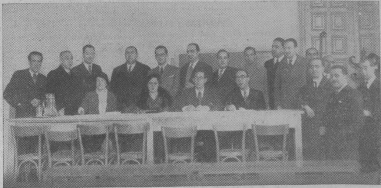
Catedráticos de Instituto que asisten a la asamblea inaugurada ayer en el Instituto del Cardenal Cisneros