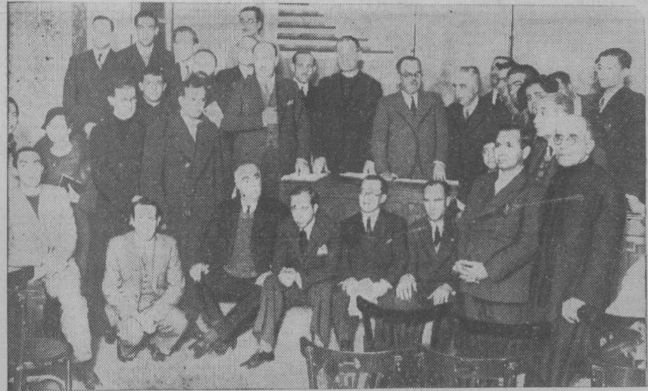
Presidencia y algunos delegados de la Asamblea de la Federación de Maestros Católicos, inaugurada ayer con gran concurrencia