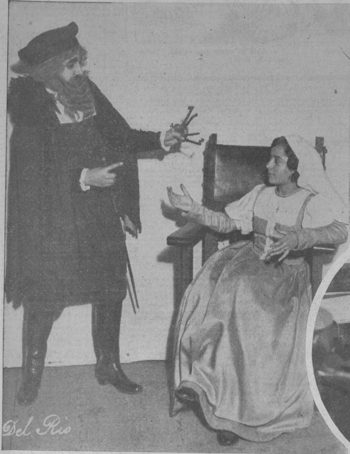
Los pequeños grandes artistas de la compañía infantil «B. A. T.», que en estos días realiza en el Calderón la «Semana de Jeromin»