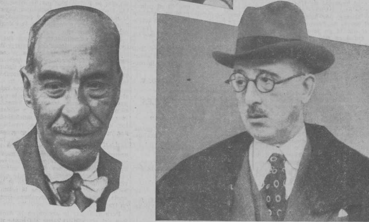
Arriba, a la izquierda, don Joaquín Chapaprieta, ha sido constituido el nuevo Gobierno; a la derecha, don Juan Usabiaga, a quien se le ha encomendado la cartera de Agricultura. Abajo, a la izquierda, el presidente de la Audiencia de Barcelona, don Manuel Alonso y Alonso, que se ha hecho cargo de la presidencia de la Generalidad; a la derecha, el nuevo ministro de Instrucción pública y Bellas Artes, don Luis Bardají