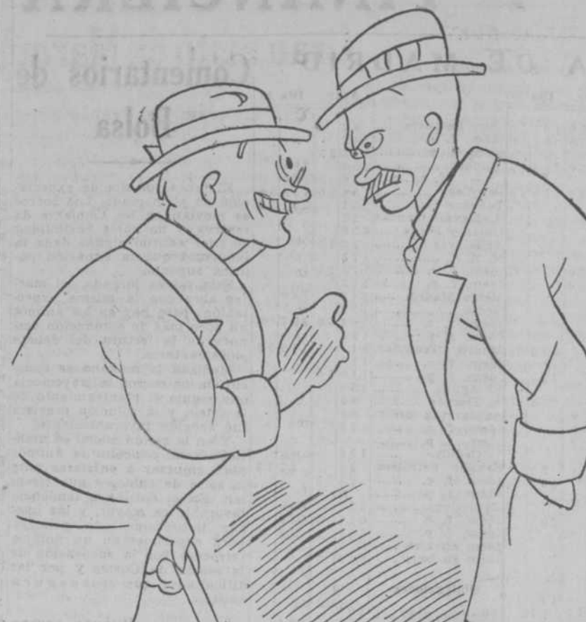
—Pesqué en una ocasión en alta mar un pez tan grande que no pude llevarlo a casa, porque la lancha se hubiera hundido con el peso. —Lo creo, porque lo mismo me ocurrió a mí en un viaje a bordo del «Normandie».