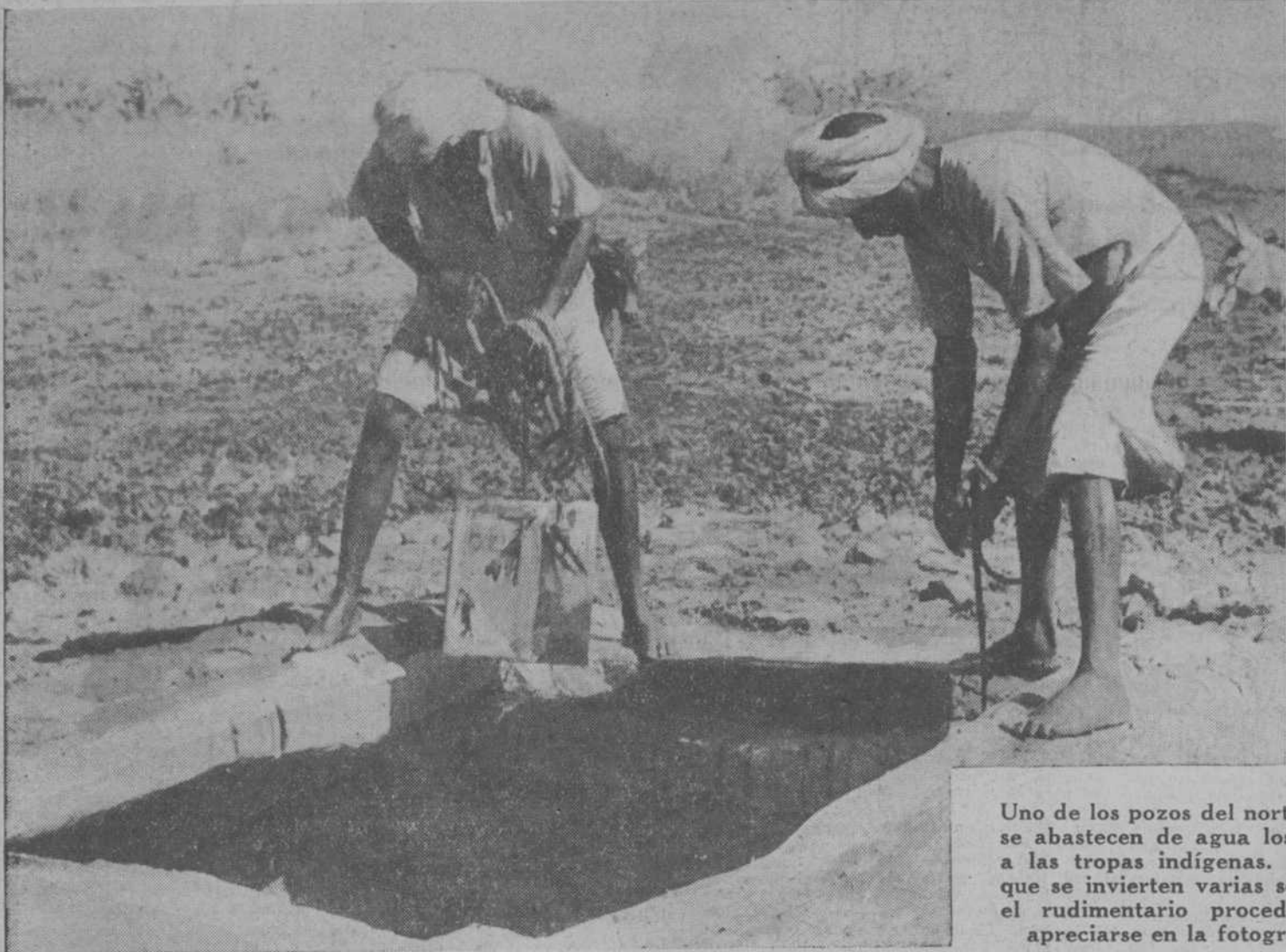
Uno de los pozos del norte de Abisinia en que se abastecen de agua los que la suministran a las tropas indígenas. El transporte, en el que se invierten varias semanas, se hace por el rudimentario procedimiento que puede apreciarse en la fotografía de la derecha