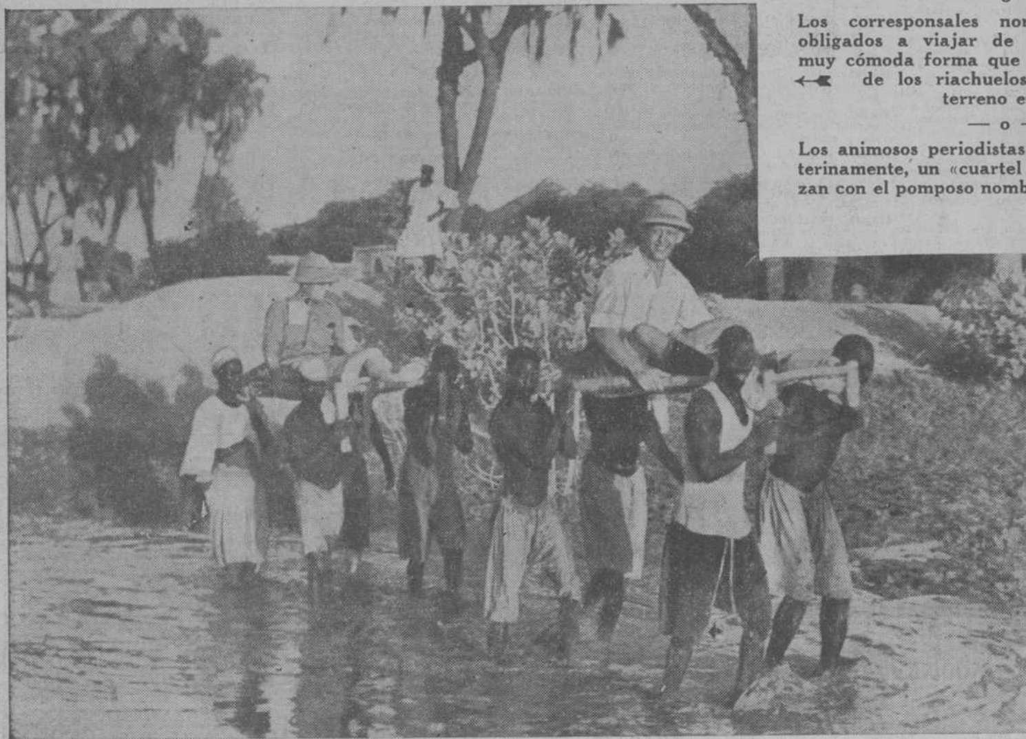
Los corresponsales norteamericanos están obligados a viajar de la pintoresca y no muy cómoda forma que aquí se ve, a través de los riachuelos y del accidentado terreno etiope