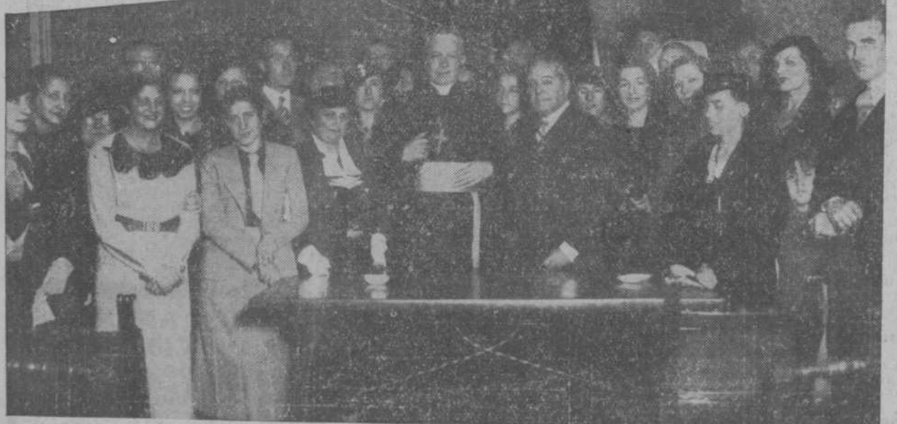
Acto inaugural en la Casa de Italia del curso de lengua italiana, que presidió el embajador, señor Pedrazzi, y al que asistió el Nuncio de Su Santidad, Monseñor Tedeschini