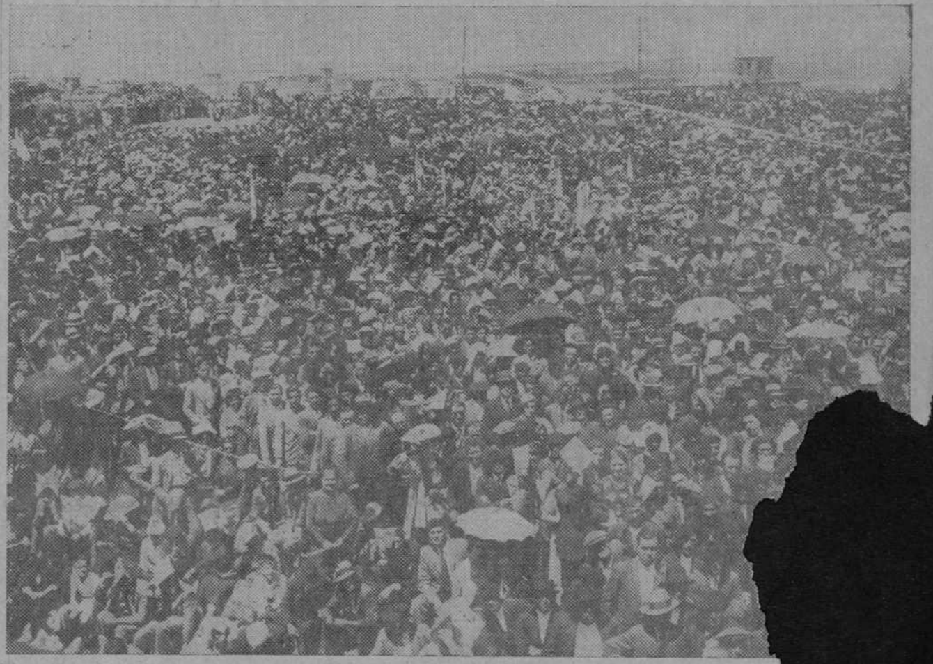
He aquí a la muchedumbre ante el castillo de La Mota. Desde las torres del puente dominaba esta multitud entusiasmada, de pie sobre campos de sembradura, ante un sol abrasador causó veinte insolaciones. Un entusiasmo más vivo llenó cincuenta mil pechos frente al castillo y el recuerdo de Isabel de C...

A la izquierda, la plaza de toros de Valencia dura nte el discurso de Gil Robles. Dos perspectivas. Lo que pudo alcanzar el objetivo en dos direcciones, que quedan bien señaladas por las figuras de pie junto al orador y la bandera y la mesa de los taquígrafos. En todos los lugares es la misma multitud, apretada hasta lo imposible en un intento generoso y, para ellos asfixiante, sin duda, de ensanchar el espacio