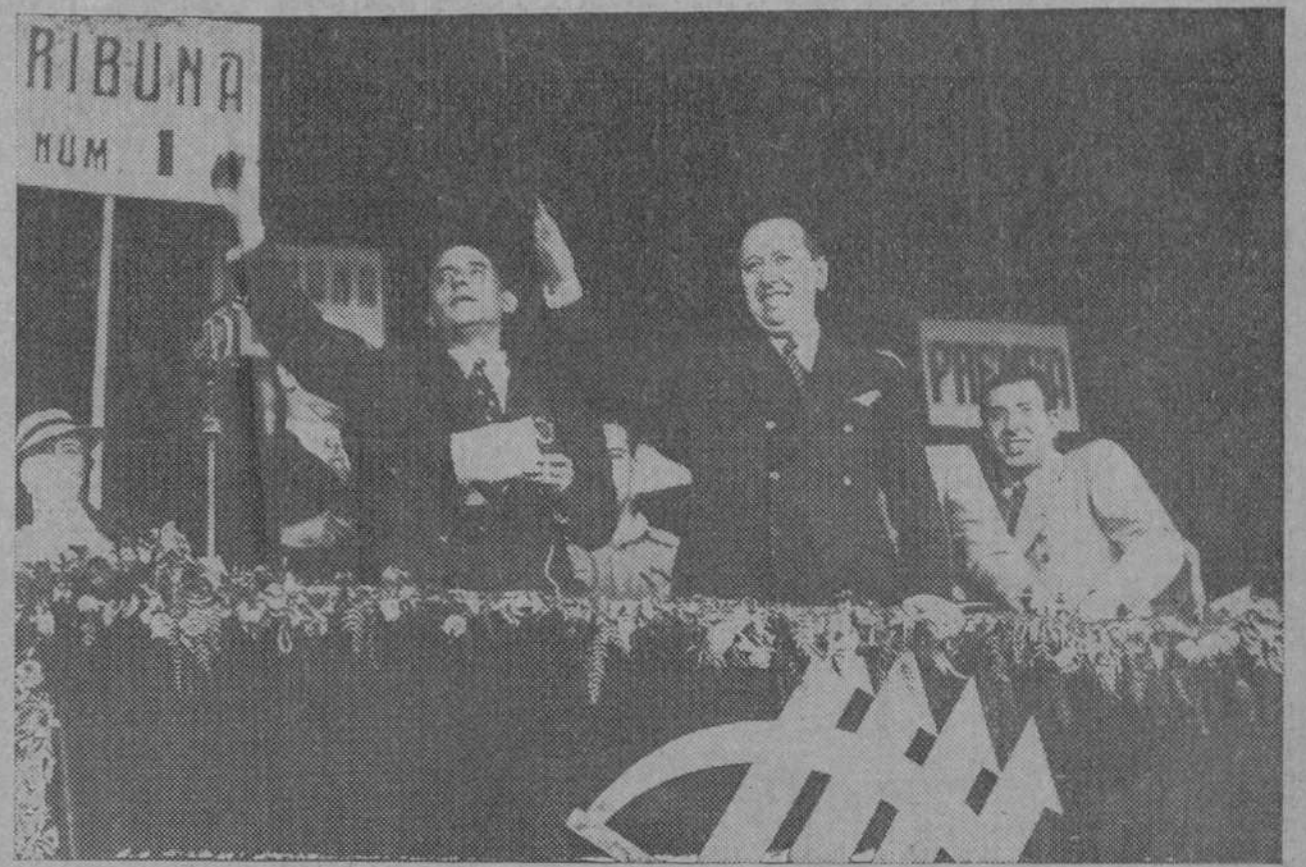
Los señores Gil Robles y Lucia saludan a la multitud al llegar al campo de Mestalla