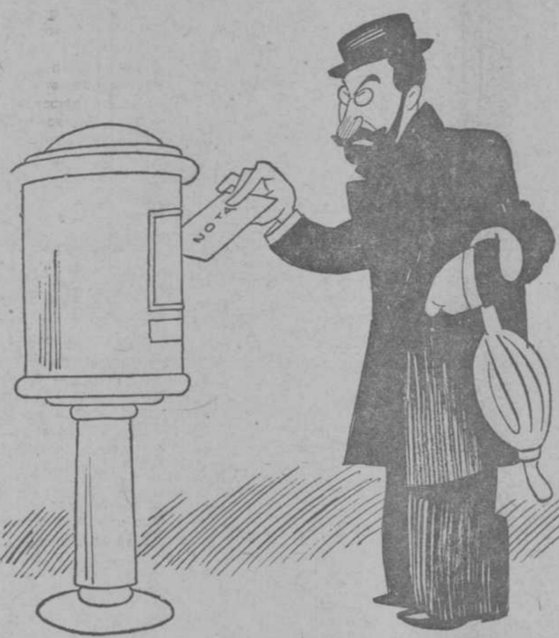
El último "jipio".