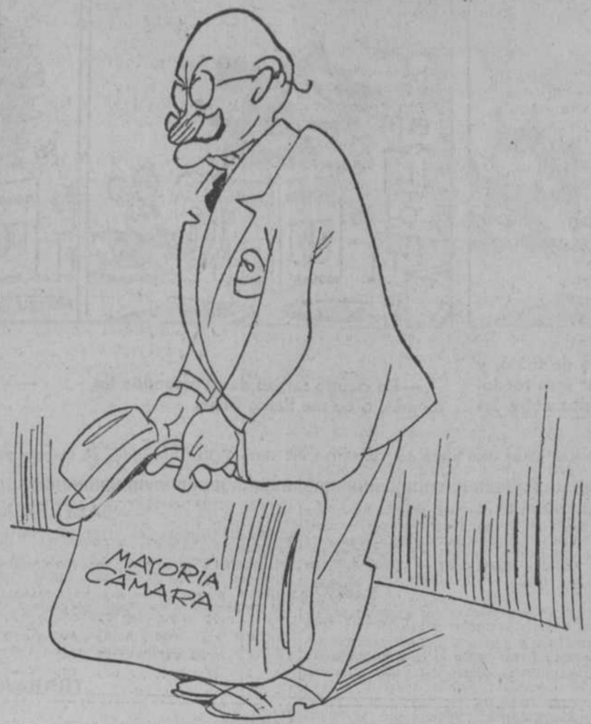
—;Pesa esto mucho para que yo me aleje!