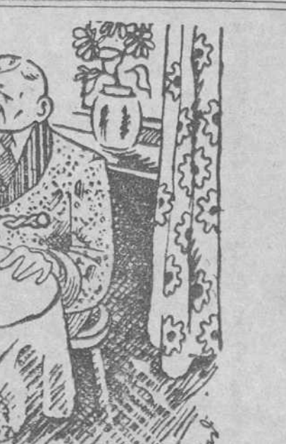
—Muy bien. Quédate otros quince días.