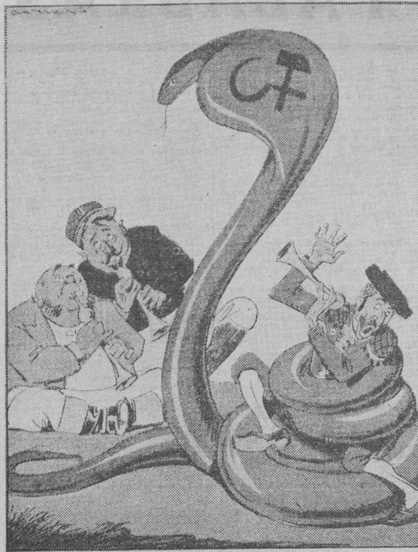
UNO QUE SE DESCUIDA...