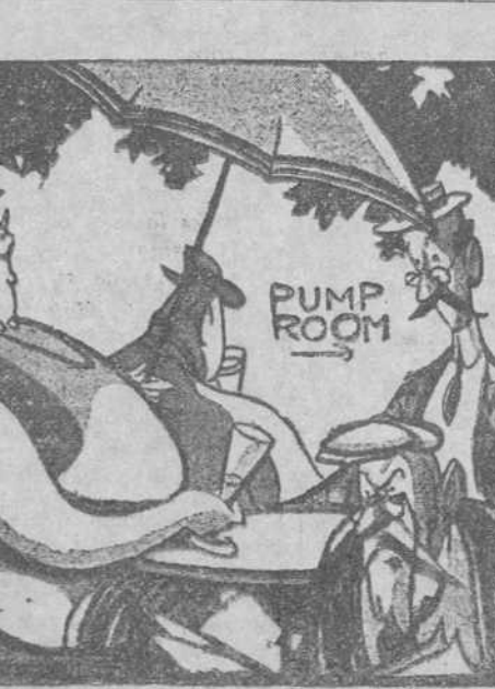
—Muy bien. Quédate otros quince días.