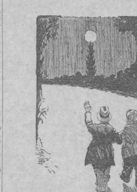
—O, ¡fíjate! el surtidor de gasolina más alto que he visto en mi vida.