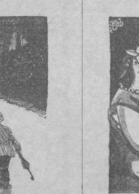
—Estas aguas me han ido muy bien. He perdido en quince días la mitad de mi peso.