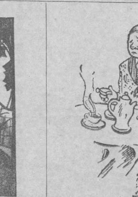
—Pues, señor, la patrona dice que pone mantequilla en el pan. Lo que yo me pregunto es cómo se arregla para quitarla después.