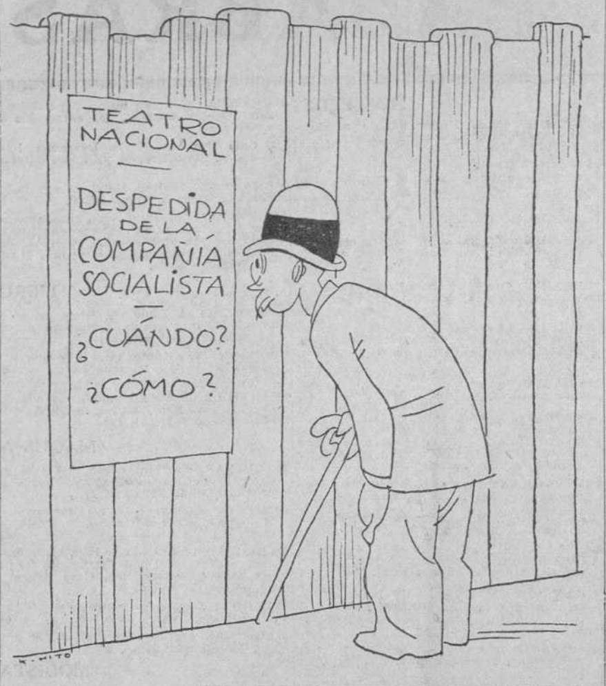
—;Dios nos libre de las malas compañías!