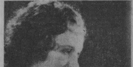
Douglas Fairbanks, en tanto, se interesa tanto se parece a Valentino—fué bo-

Mary Pickford ha desistido de hacer la película que encargó a Frances Marion y salió para Nueva York en busca de otro asunto. (Aunque no precisamente para filmarlo.)