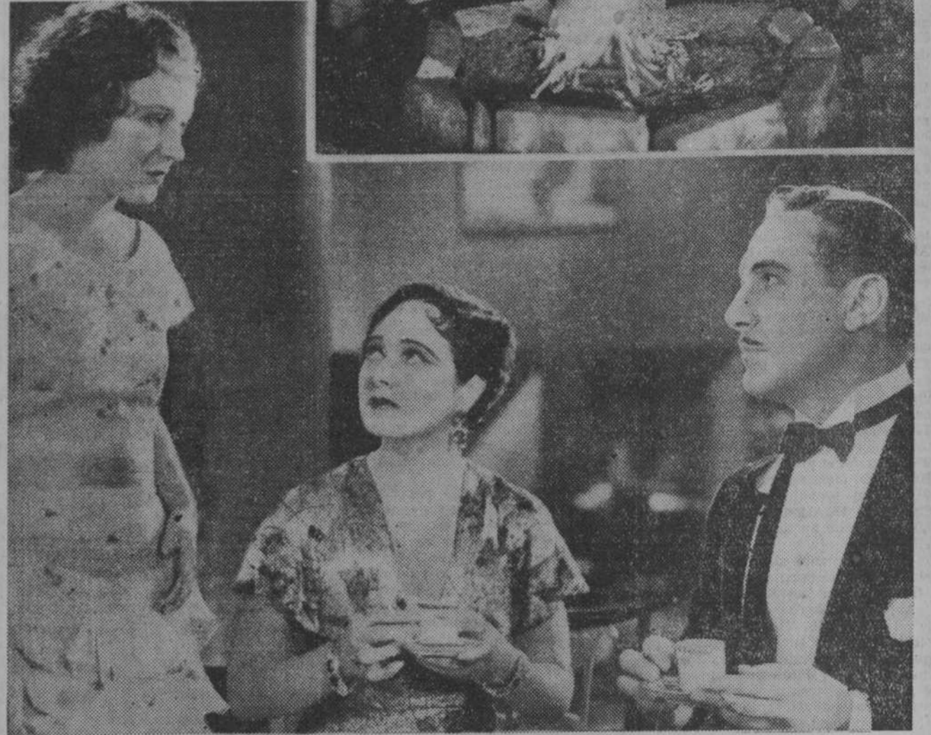
Una escena de "La conquista de papá", "film" Paramount que interpretan Dorothy Jordem y Paul Lukas