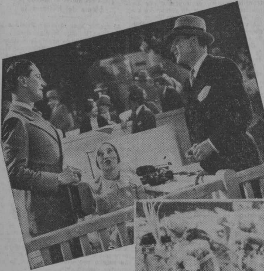
Kate de Nagy y Jean Murat en un momento de la película "El vencedor", que próximamente se estrenará en el Cine de la Opera