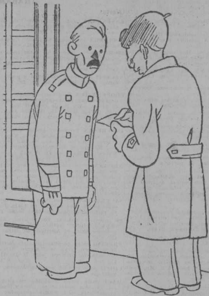
¡Oh! Al señor presidente de la Generalidad le gusta mucho bajar. ¡No sabe usted cuánto siente que llegue un Domingo!