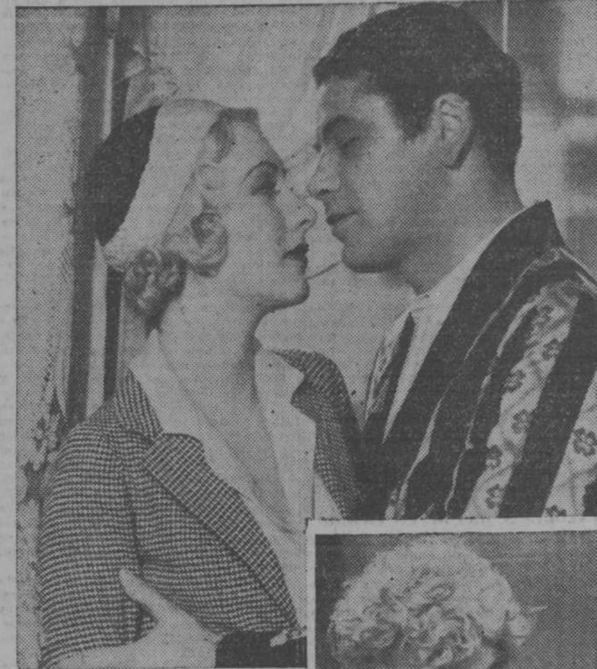
Una escena de "Scarface", que próximamente se presentará en Madrid

Un momento de "Erase una vez un vals", la deliciosa opereta que con tanto éxito se proyecta en el cine del Callao