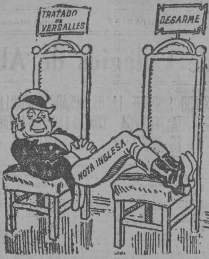
UNA ACTITUD CONFORTABLE ("Krasnaia Zvezda", Moscú.)

El señor GIL ROBLES: Ya hablémos de todo eso.