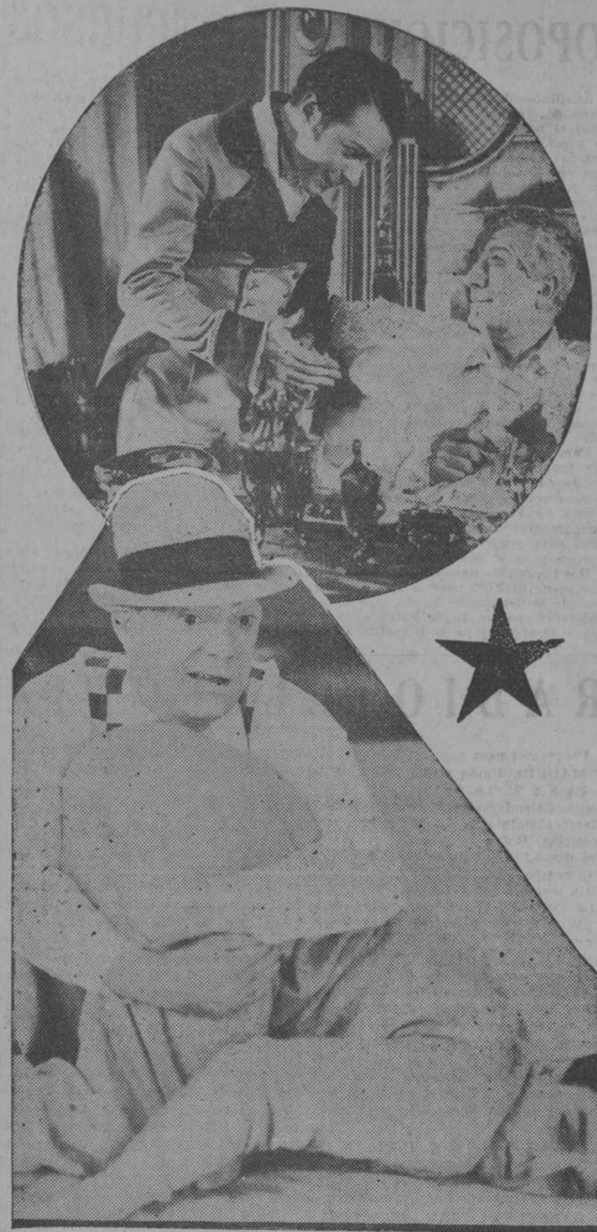
Arriba. Una escena de "El Congreso se divierte", que se estrena hoy en la Opera