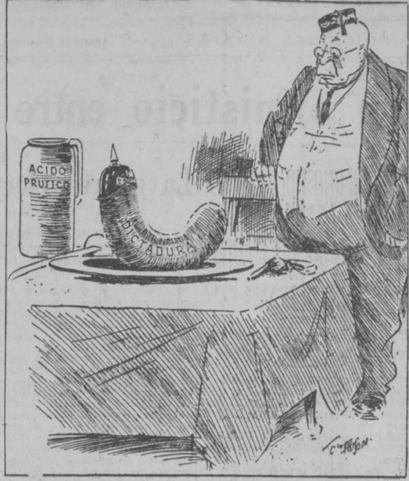
EL "PAN COTIDIANO" ("Birmingham Mail")