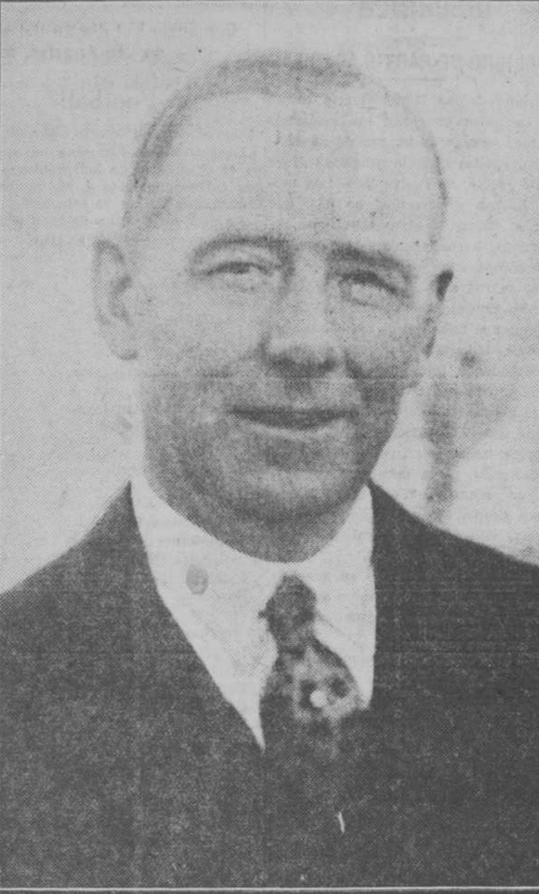
Mr. Lamont, secretario de Comercio de los Estados Unidos, que ha dimitido por divergencias con el presidente Hoover