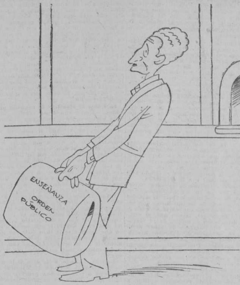
COMPANYNS.—Esta semana tendré que pagar exceso de equipaje.