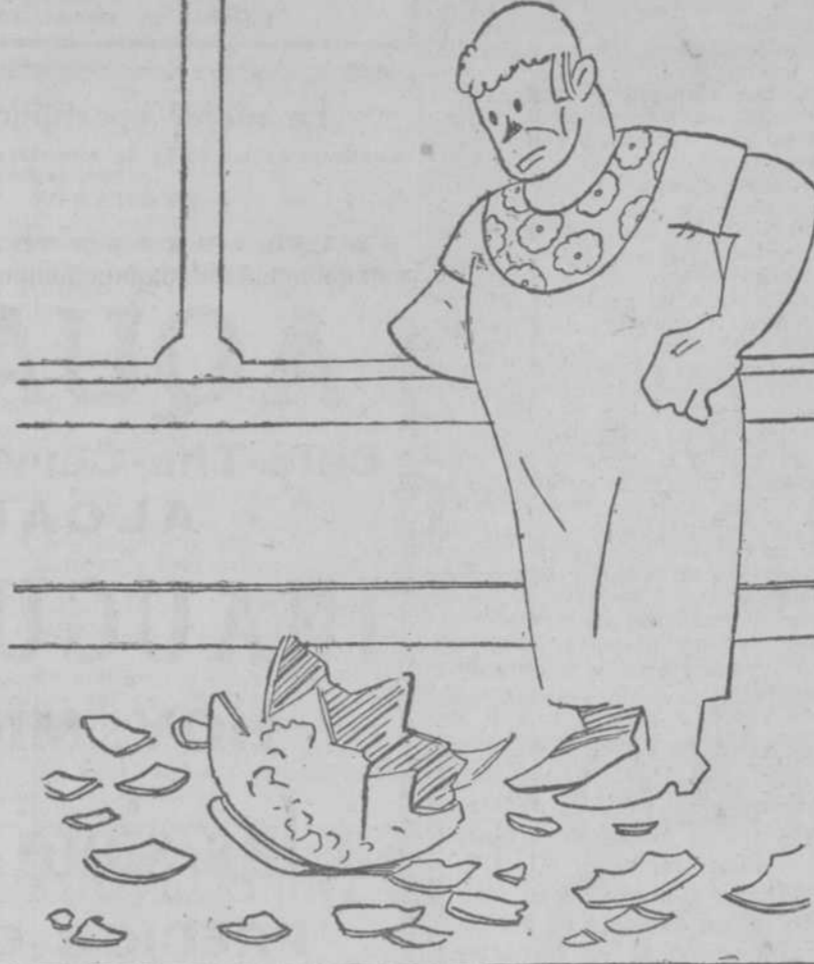
—¡Está hecho migas!