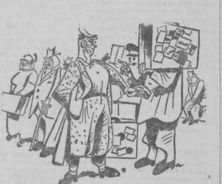
EL BOXEADOR.—¿Y quién le ha dicho a usted que esa es mi malaeta? EL MOZO.—La he sacado por el parecido, caballero. ("Il Travasso", Roma.)