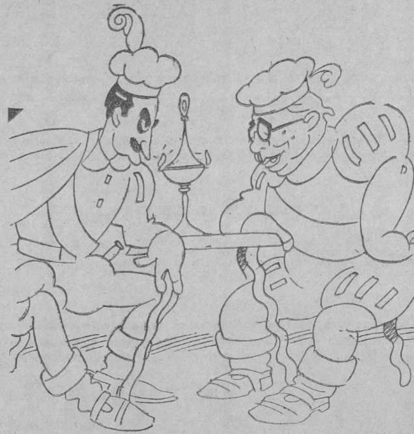
...y siendo contradictorio al nuestro mi parecer...