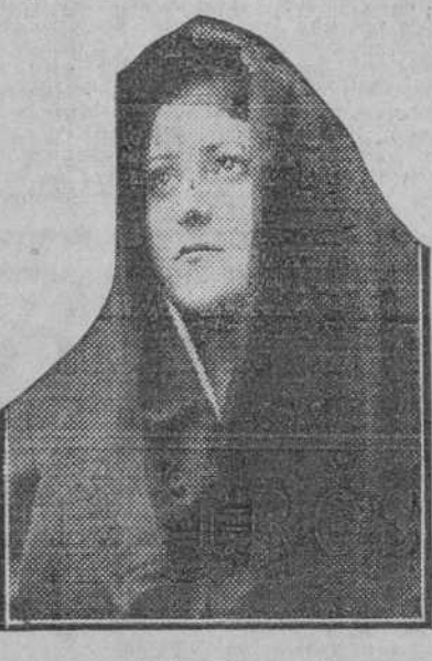
Textos de "La Voz" en diciembre de 1930.

Hoy hace un año que dejó de existir una gran artista, Ofelia Nieto. Una operación malograda puso fin a la vida de la gran cantante, en todo el apogeo de sus facultades. Persona ejemplar, en el sentido de familia y sociedad, su pérdida dejó un hueco en el arte lírico dramático, difícilmente reemplazable. Sopranos y contraltos ligeros, quedan aún en España con suficientes títulos de gloria, pero las sopranos dramáticas parecían haber encarnado en Ofelia, intérprete insuperable de las heroínas de ópera, familiares a nuestros aficionados, que llenaban la sala del teatro Real para escuchar la bellísima voz, la voz única de Ofelia, ya suave, ya exaltada, admirable siempre, a través de los diferentes personajes. "Aida", "Tosca", "Manón", "Africana", son otros tantos recuerdos imborrables de su actuación. Pero Ofelia, además de cantar las óperas de su repertorio, creó personajes nuevos de compositores españoles, de Conrado del Campo, de Arregui, de Ercell, de quien hizo algunas representaciones brillantísimas de "Los Dolores". Aunque en sus últimos años volvió retirada de los escenarios, nos quedaba siempre la esperanza de oír, alguna que otra vez, en funciones y conciertos de carácter benéfico, en donde hubiéramos admirado su espléndida voz y su arte inimitable. Dios lo ha dispuesto de otra manera y solamente nos resta recordarla en esta fecha de aniversario, ofreciendo a sus familiares nuestro recuerdo de admiración y simpatía a la malograda artista.