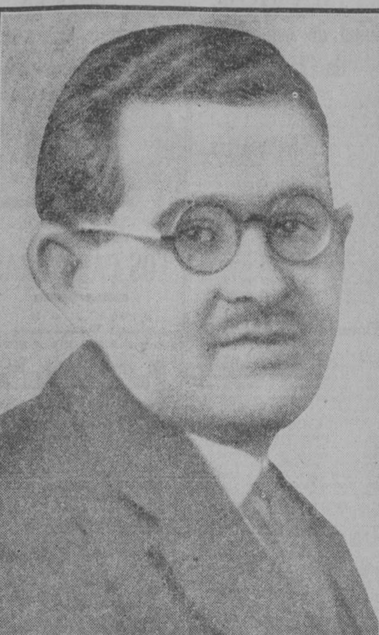
El compositor Salvador Bacarisse, a quien ha sido concedido el premio nacional de música

Bacarisse es madrileño y discípulo de Conrado del Campo. Es seguramente el más destacado de los jóvenes vanguardistas españoles. Su técnica firme y segura, le hacen avanzar por los más inexplorados caminos de la música, produciendo obras rudas y disonantes, pero leales y francas. Cuando quiere, como en el "ballet" "Corrida de Fénix", sabe agradar a los públicos. Su carrera culmina ahora con el premio nacional que le ha sido concedido por el Estado. Bacarisse es director artístico de Unión Radio.