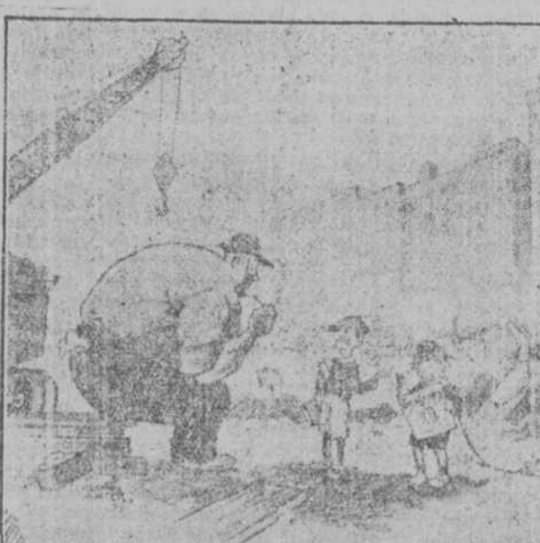
—Haga usted el favor de ponerse de pie, que quiero enseñarle a éste lo que es el Ecuador. ("Berlingske Tidende", Copenhague)