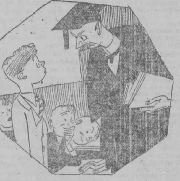
—¿Conque no sabe usted dónde y cuándo desembarcó Guillermo el Conquistador? Pues, aquí lo dice bien claro: "Hastings 1066". —Es que yo creí que esa era el número de su teléfono. ("Passing Show", Londres)