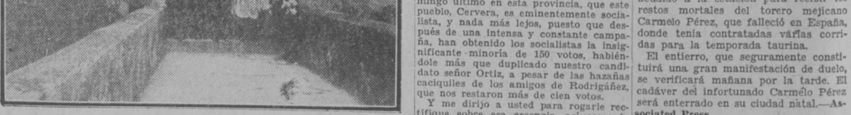
Este monumento grandioso se yergue en el Pico de Torcovado. Mide 40 metros de altura. Su construcción fué costeada por suscripción pública, que organizó el propio Gobierno brasileño. En el acto de la inauguración Marconi iluminó la estatua desde Roma