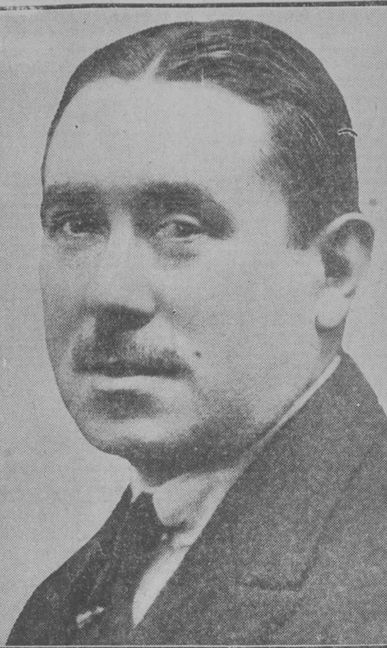
Don Joaquín Turina, ilustre maestro compositor y crítico musical de EL DEBATE, que fué obsequiado anoche con un banquete por su reciente nombramiento de profesor del Conservatorio

La figura de Joaquín Turina tiene el relieve artístico suficiente para que su inclusión en esta galería esté no sólo justificada, sino aparece como un subrayado del aplauso público, que anoche se concretó en un homenaje cordial, entusiasta y merecido. Merecido porque el ilustre compositor español, que sabe dar valores universales a las esencias líricas del florecido y luminoso rincón de España que es Sevilla, su patria, es, a un tiempo, un artista popular y un elevado artista; esto no puede decirse sino de las minervas de excepción; merecido, porque Joaquín Turina, músico de su tiempo, no ha renegado de los elfluvios tradicionales que han henchido siempre los corazones de los artistas dignos de ese nombre; merecido, además, porque es un hombre limpio de intención y sano de alma. Muchos discípulos han preparado la vocación pedagógica que ahora realizará nuestro querido e ilustre compañero oficialmente en el Conservatorio, donde no podrá esquivar, ni querrá, la representación nacionalista, que es una de sus facciones artísticas más destacadas. EL DEBATE se honra, pues, trayendo a sus páginas como figura actual la de su crítico musical, Joaquín Turina, un gran músico español.