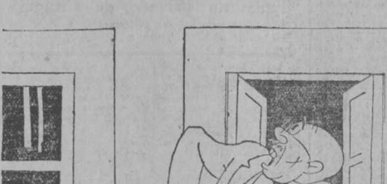
Atiza, dónde me lo han puesto!

Señor director de EL DEBATE. Muy señor mío: Le ruego de acordada en su periódico a estas líneas de protesta que le envío en nombre de la J. O. N. S. (Junta de Ofensiva Nacional Sindicalista).