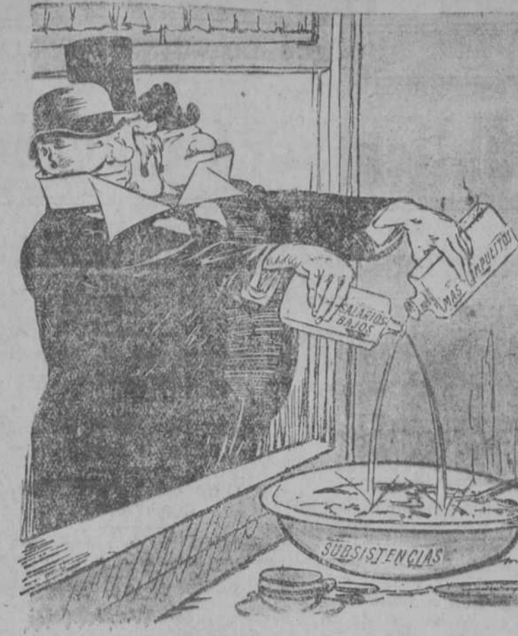
PERO NO HAY MAS REMEDIO QUE TOMARLA