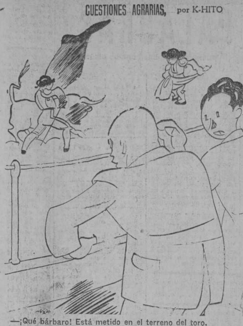
—¿Qué bárbaro! Está metido en el terreno del toro. —No tiene importancia. Con esto del reparto de tierras...

Adscritas a los conventos y colegios de pago siempre hay una sección gratuita para los niños pobres, y en muchos sitios sólo para éstos, como en Ocaña, La Felguera, Ujo y Santa María de Nieva. Hay círculos para obreros con escuela gratuita nocturna, como las de Atocha y Santo Domingo el Real, de Madrid, que están bajo la dirección del P. Perancho y del P. Gato.