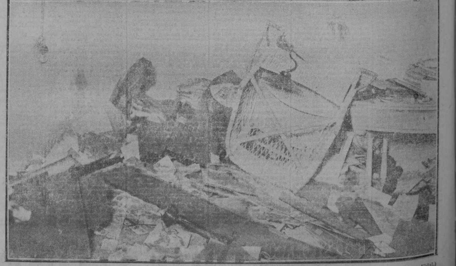
Estado en que quedó el despacho del señor embajador después de la explosión de la bomba