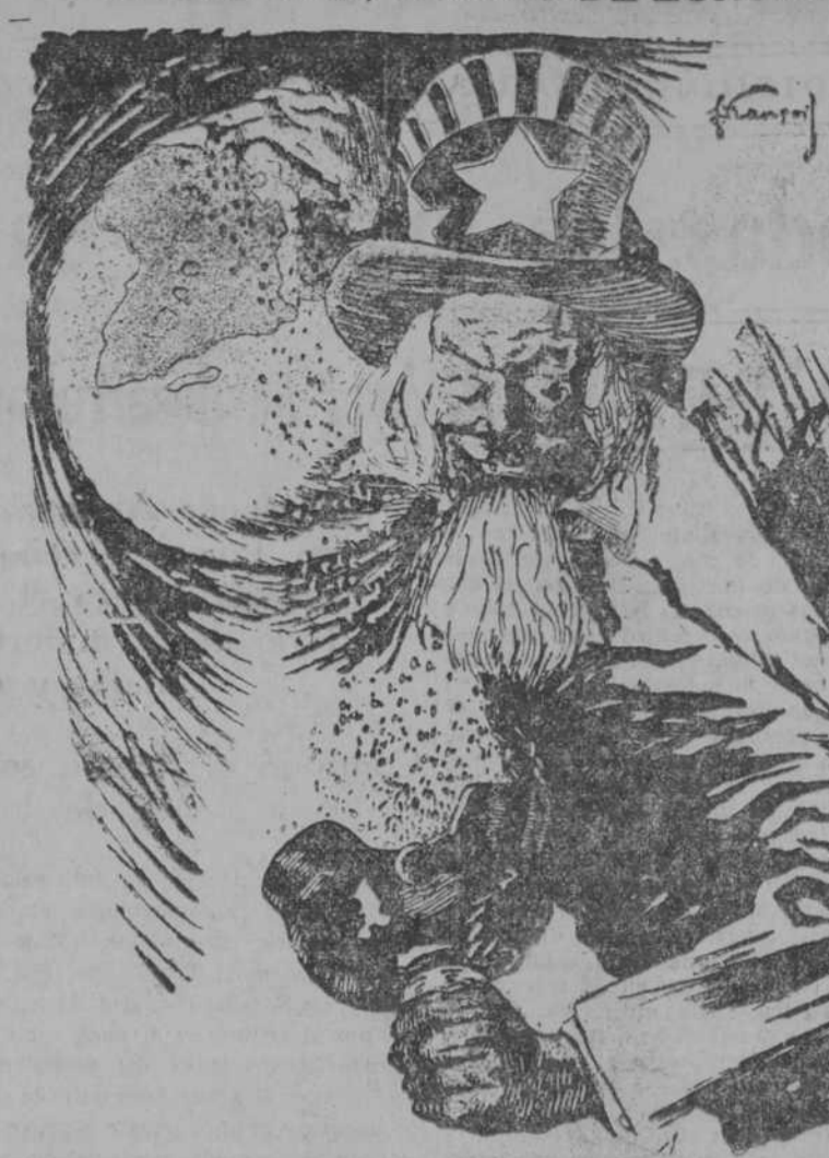
ANTE TODO, UNA BUENA SANGRIA ("The Hollit Press", Washington)