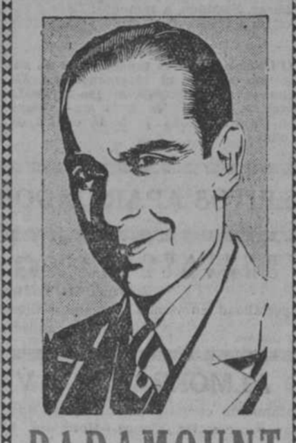
Portrait of a man in a suit, likely a representative of the financial institution.

PREMIOS MENORES (Continued). Lists smaller prize amounts and winning numbers.