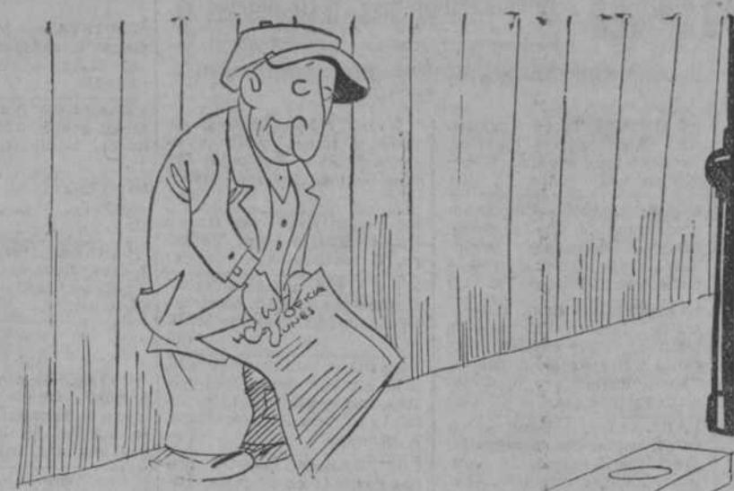
MARZO.—¡Vaya, vaya! ¿A que me quedo con el papel en la mano?