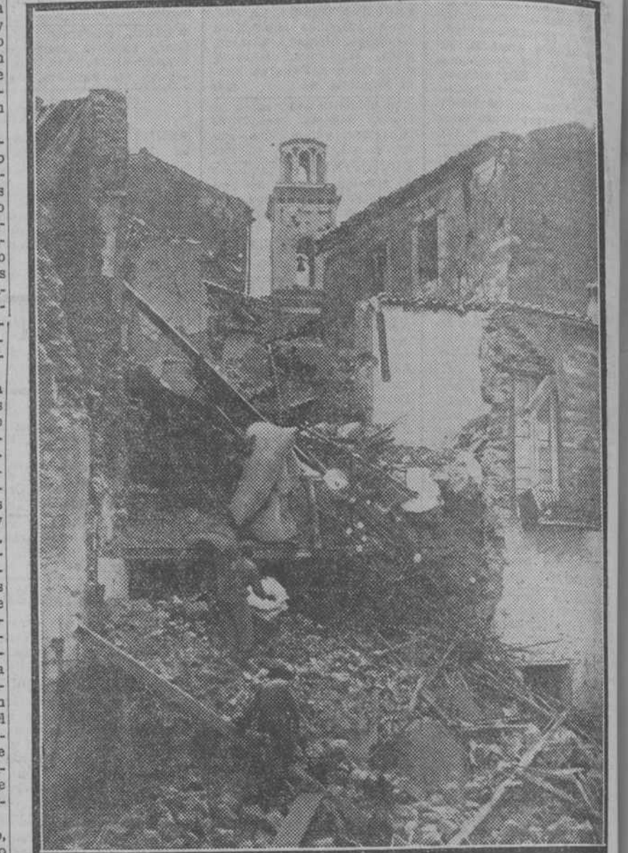
Los soldados buscan las víctimas entre los escombros a que quedaron reducidas las casas