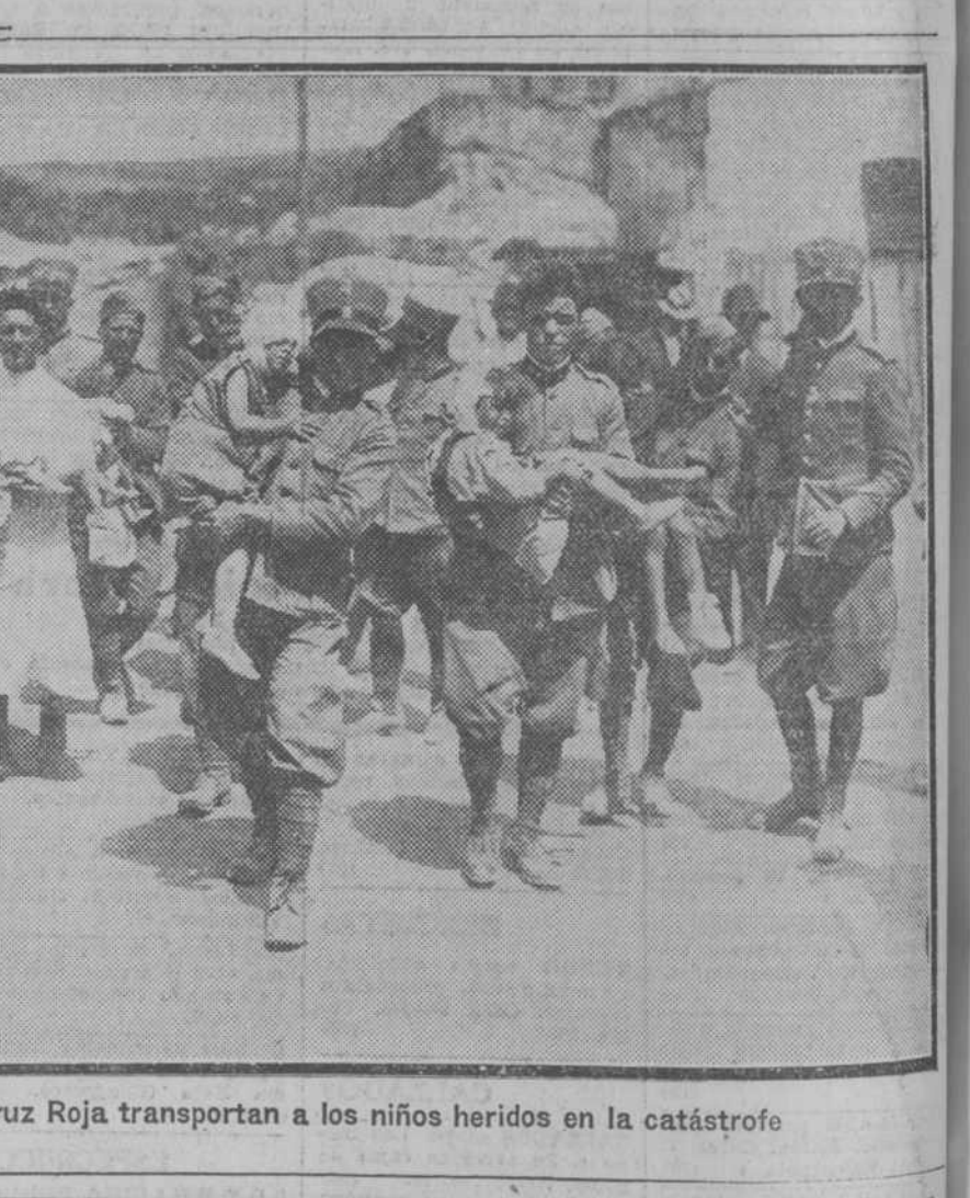
Los soldados y la Cruz Roja transportan a los niños heridos en la catástrofe