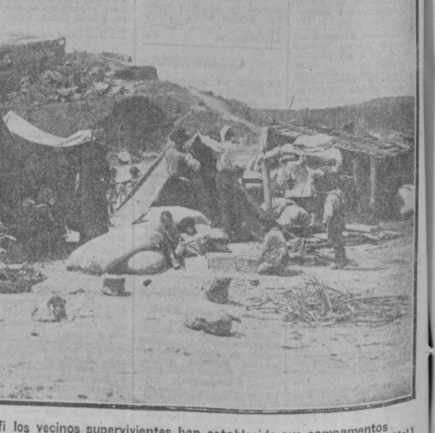
En los alrededores de Melfi los vecinos supervivientes han establecido sus campamentos

Vertical text in the right margin containing various fragments of text and words from the main articles.