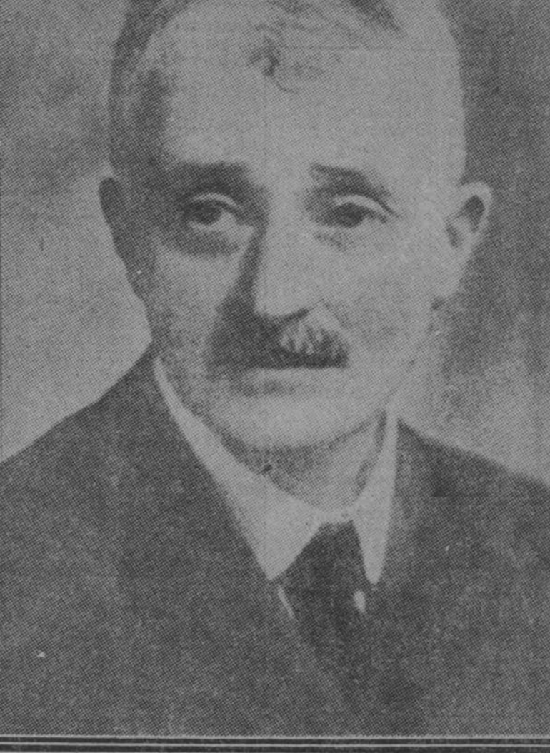
Mr. John Masefield, nuevo poeta laureado de la corte inglesa

Podría decirse que Masefield es el último trovador, más libre todavía que los trovadores antiguos, porque ni siquiera tiene la obligación de vivir en la Corte ni de seguir a la corte.