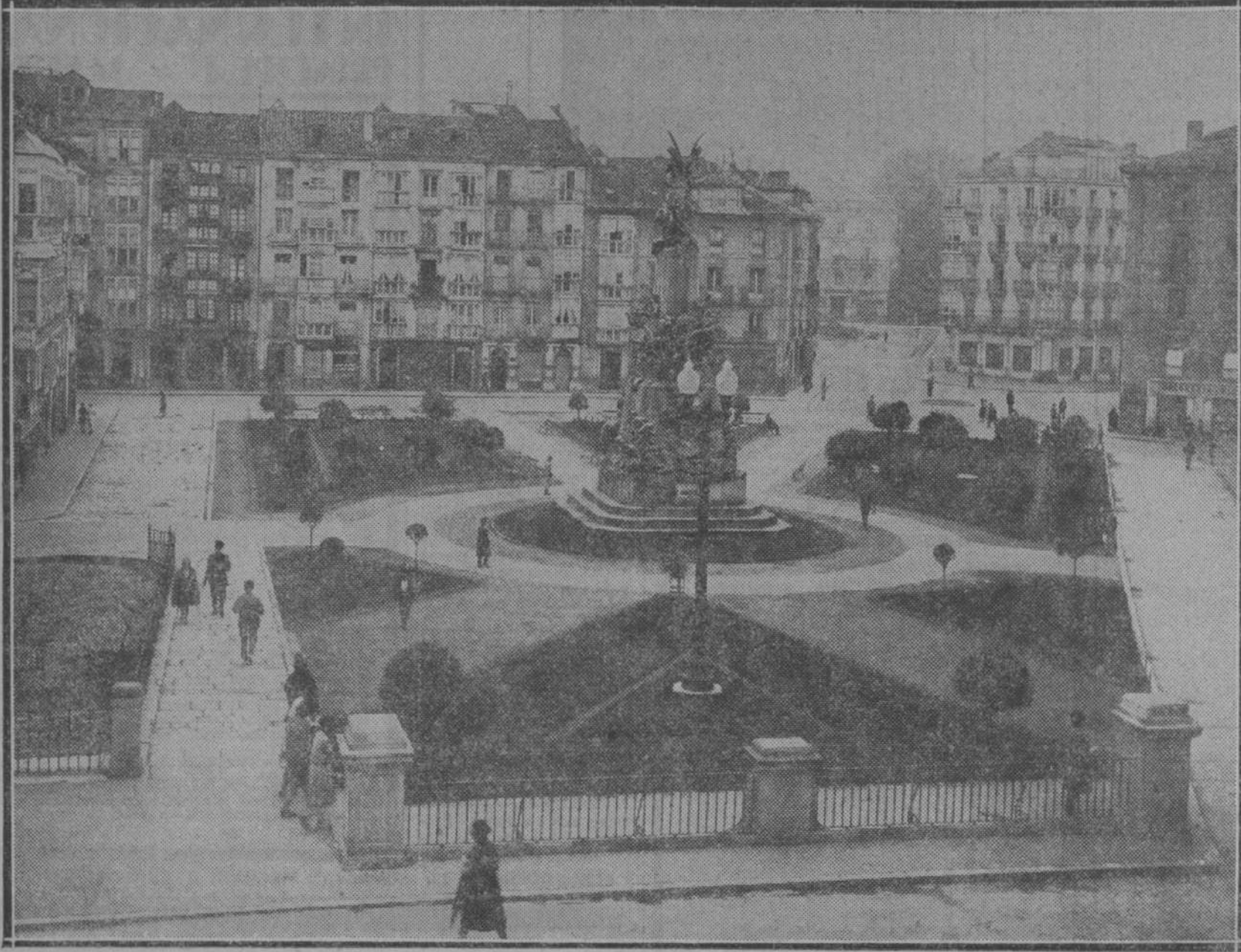
La bella y armónica plaza de la Virgen Blanca en Vitoria

En la bellísima plaza de la Virgen Blanca se dan la mano la población vieja y la nueva. Desde la iglesia de San Miguel, con sus grandes y magníficos arcos, se divisa un magnífico panorama de la ciudad.