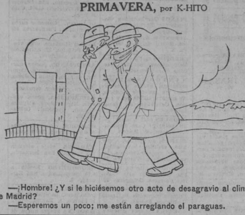
—¡Hombre! ¿Y si le hiciésemos otro acto de desagravio al clima de Madrid? —Esperemos un poco; me están arreglando el paraguas.