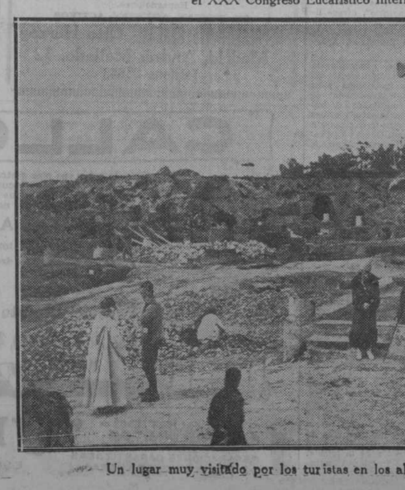
Un lugar muy visitado por los turistas en los alrededores de Cartago