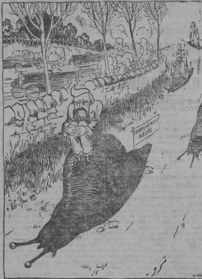
Últimas fotografías de la marcha de las negociaciones