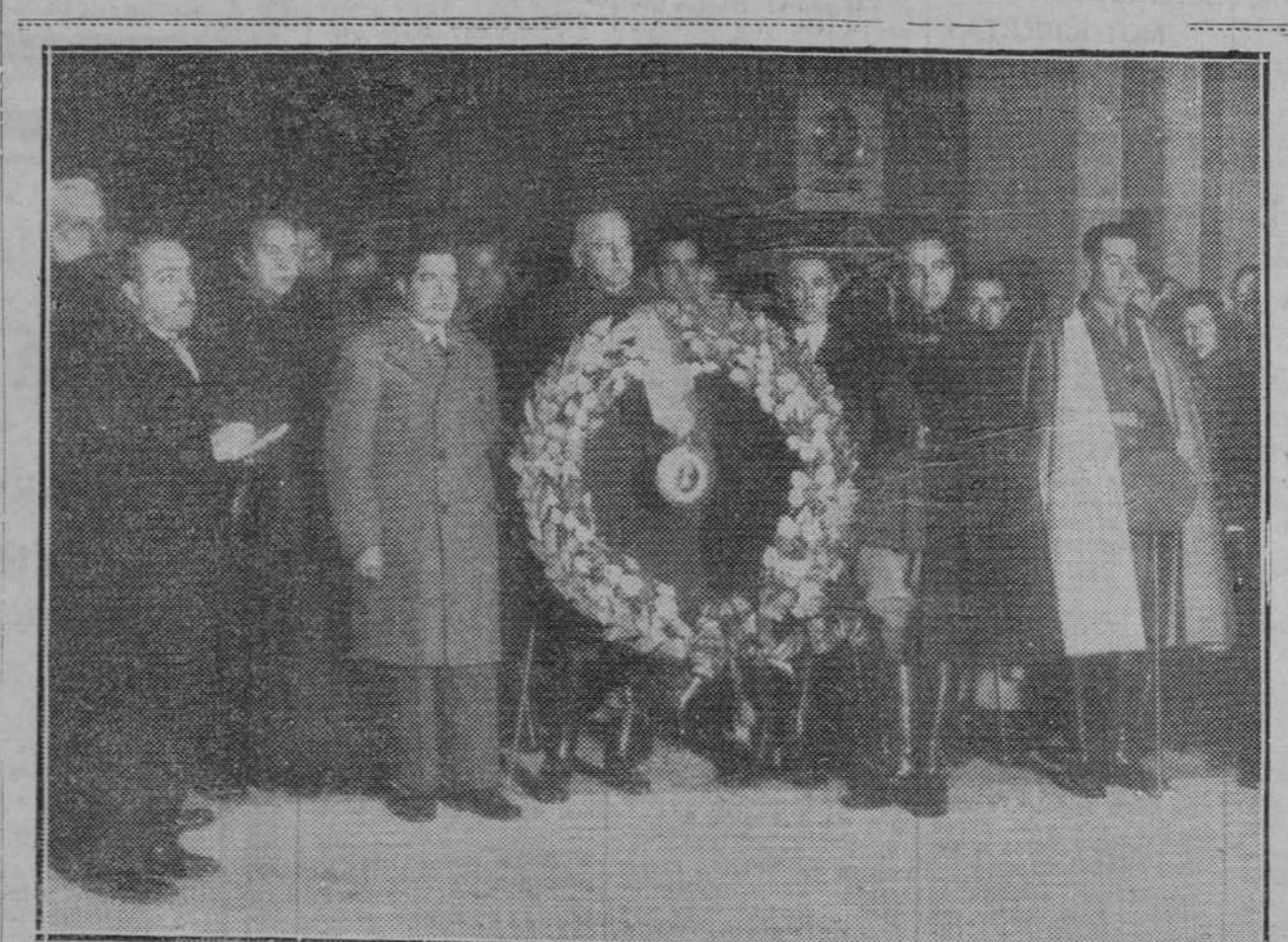
El general Primo de Rivera en el Monasterio de El Escorial llevando la corona que dedicaron a la reina María Cristina, con motivo del aniversario de su muerte, los inválidos de la guerra de África.

FERNANDO VI, 17.-GRAN VIA, 8.-SEVILLA, 16