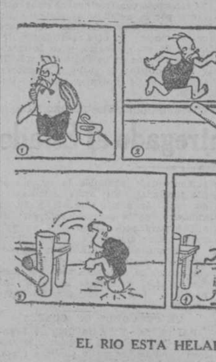
EL RIO ESTA HELADO (Historieta de Jacobson.)

que es el combustible más práctico y más económico