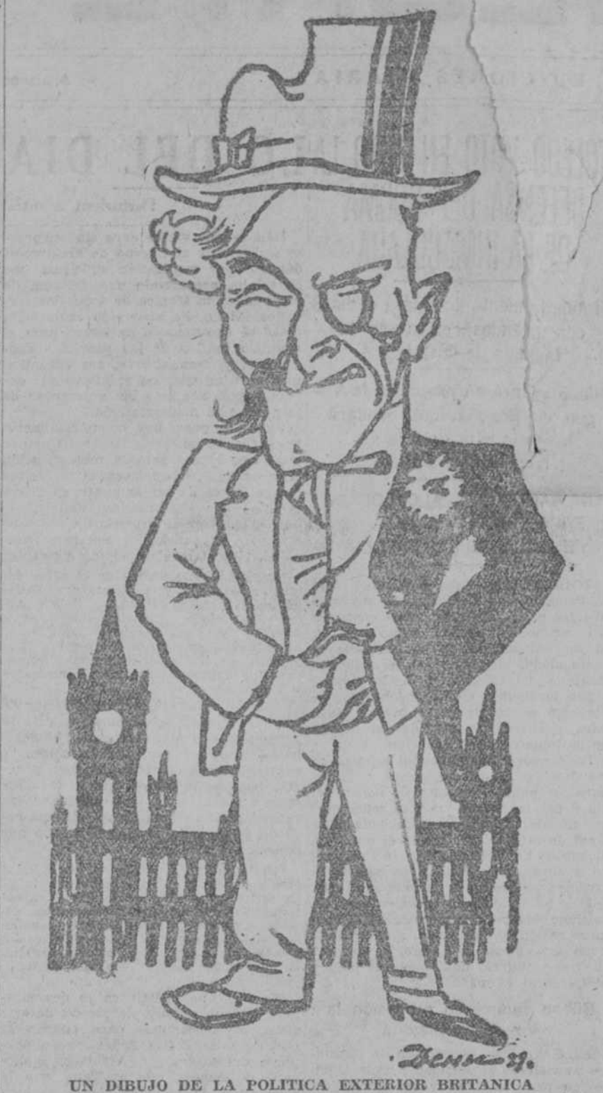
UN DIBUJO DE LA POLITICA EXTERIOR BRITANICA ("Pravda", Moscú.)