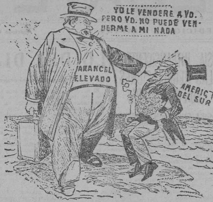
EL EMBAJADOR DE LA MALA VOLUNTAD