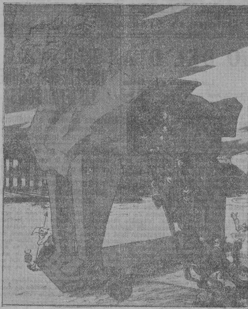
Alude a la propaganda inconsciente que se hace del comunismo con motivo del destierro de Trotski.