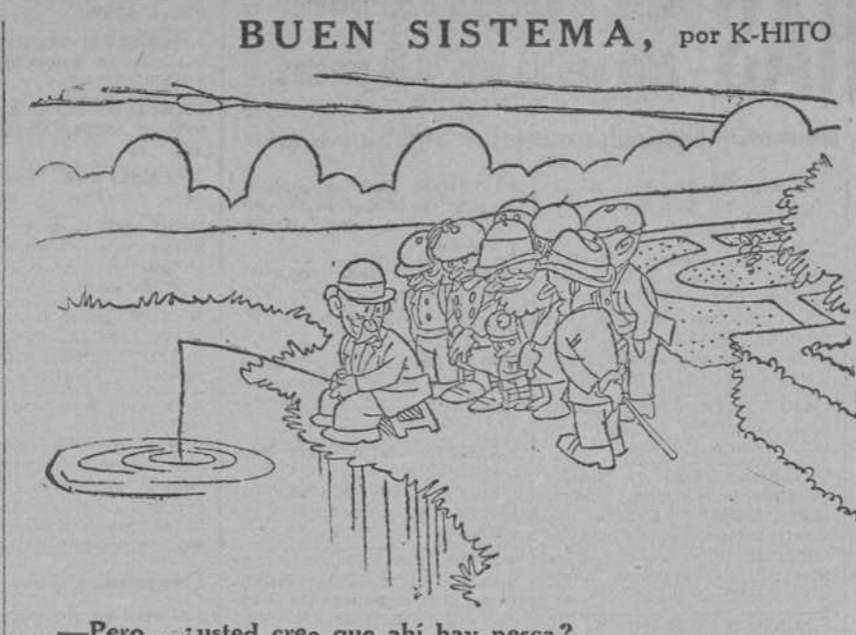
—Pero... ¿usted cree que ahí hay pesca? —¡Ah! No sé decirle; se trata de una caña y una guita. Hago esto porque soy un hombre que no le gusta nunca estar solo.

A todo esto la borrasca se había desatado, la lluvia caía a torrentes y las detonaciones eléctricas se