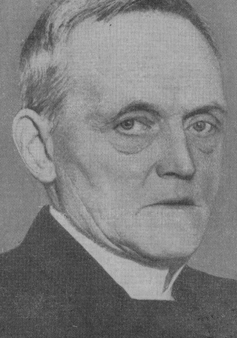
Philip Snowden, ex ministro de Hacienda laborista, que ha impugnado en la Cámara los acuerdos de las deudas interaliadas