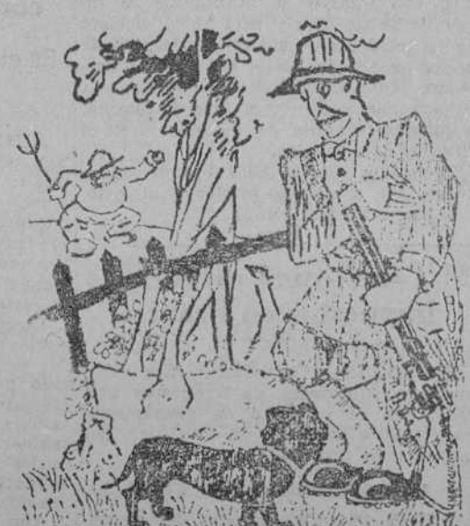
¡Es raro! Le tiro a un conejo, mato un becerro y mi perro me trae una pulga... ("Le Rire", París.)