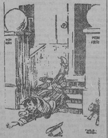
Ya tengo al padre en un bolsillo. La primera vez del puntapié fui a mitad de la calle. ("Punch", Londres.)