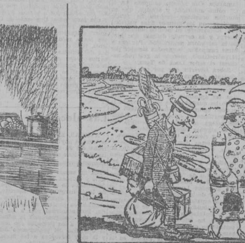
LA ESPOSA.—A mí que no me digan: se ha adelantado mucho. Acuérdate cuando tenías que trabajar los domingos.