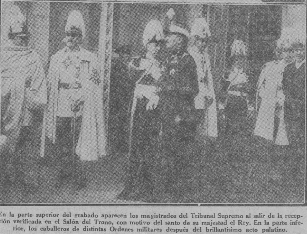
En la parte superior del grabado aparecen los magistrados del Tribunal Supremo al salir de la recepción verificada en el Salón del Trono, con motivo del santo de su majestad el Rey. En la parte inferior, los caballeros de distintas Ordenes militares después del brillantísimo acto palatino.