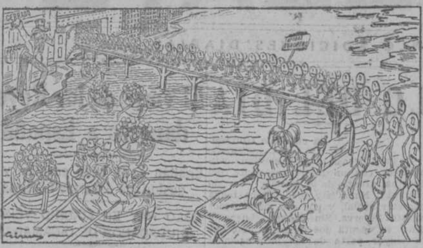
LA EMIGRACION NO PROHIBIDA