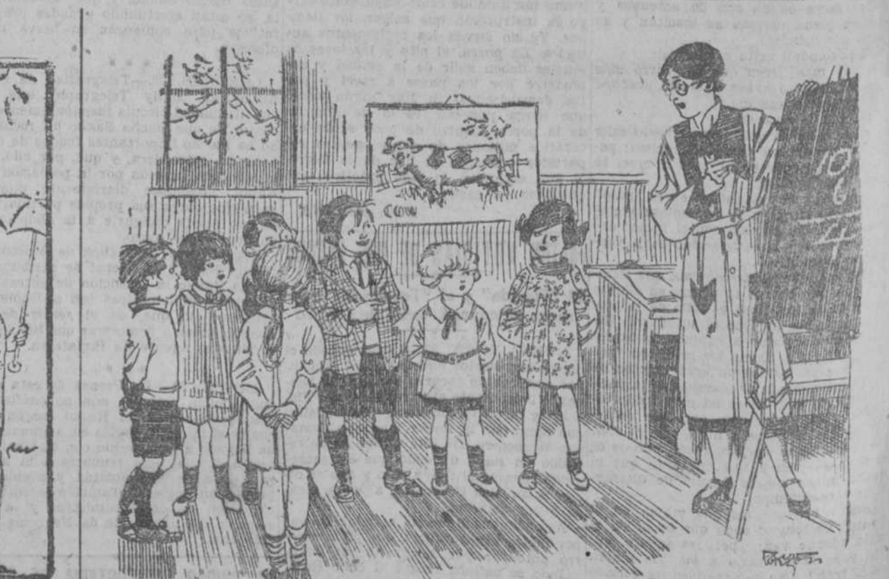
LA PROFESORA.—No se pueden obtener cosas distintas de unidades iguales. Por ejemplo, no se pueden obtener tres pasteles de cuatro queso. EL HIJO DEL GRANJERO.—Pero se pueden obtener tres litros de leche de cuatro vacas.