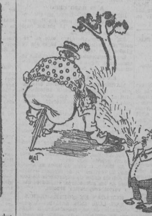
—Es la primera lección que le da este maestro. —Y será la última si se le cae encima. (De "Le Rire", Paris.)