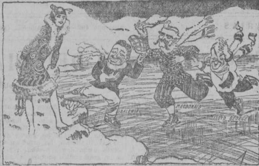
LOS TRES AL TIEMPO.—¿Quiere usted patinar, miss?

DENTISTA Hortaleza, 38. Trabajos en porcelana. Últimos adelantos.