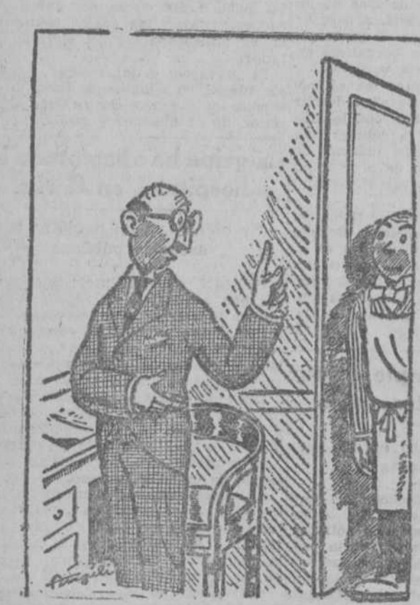
—¿Quién es el idiota que limpió mi mesa? —La señora, señor. (De "Le Rire", Paris.)

Secretario del Consejo de Minería.—Se anuncia a concurso entre Ingenieros Jefes de Cuerpo de Minas en servicio activo, la provisión de la plaza de secretario especial del Consejo de Minería. Profesor de Lengua francesa.—Se anuncia a concurso la provisión de la plaza de profesor de Lengua francesa del Instituto de Segunda enseñanza de Vigo. Podrá acudir a él los catedráticos y profesores numerarios que desempeñen o hayan desempeñado igual asignatura. Jefe del distrito minero de Santander.—La Dirección general de Minas sesa a concurso entre Ingenieros Jefes de servicio activo la provisión de la plaza de Ingeniero jefe del distrito minero de Santander.