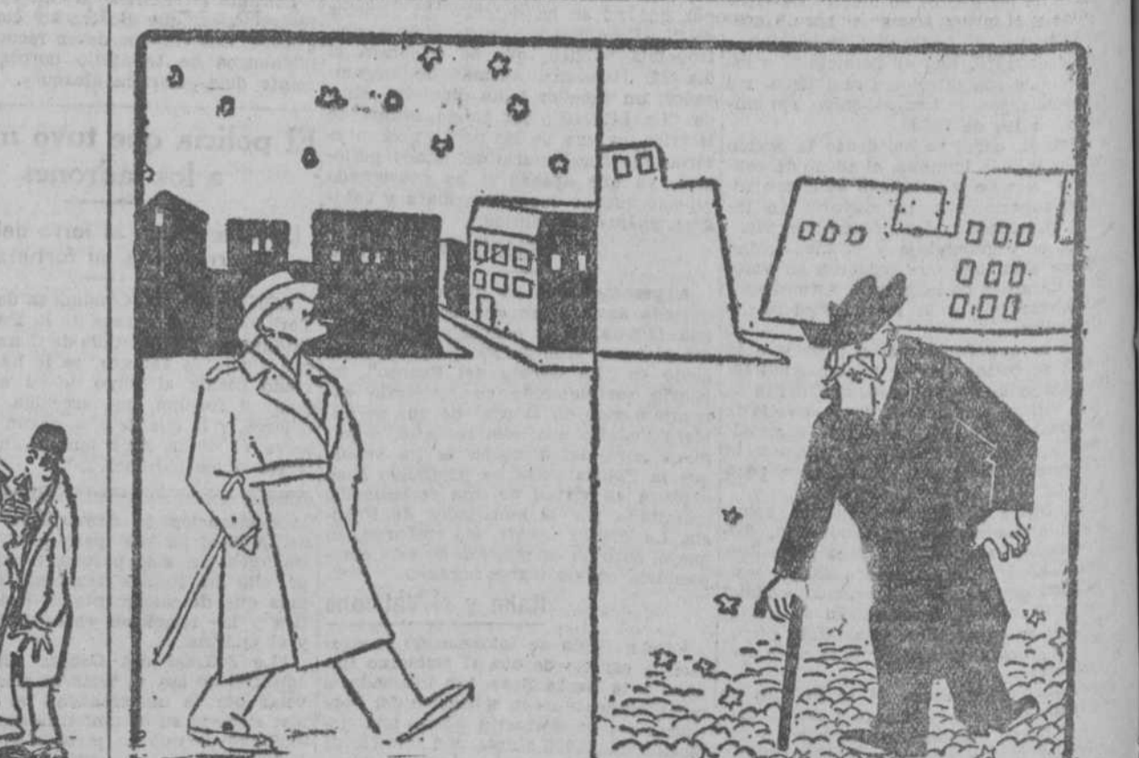
Diferentes maneras de ver las estrellas. (De "Pasquino", Turin.)