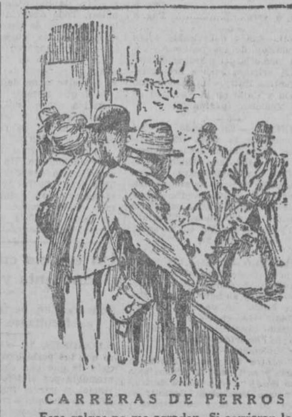
CARRERAS DE PERROS —Esos galgos no me agradan. Si corrieran los dueños apostaría a ese que me está mirando con cara de perro. (De "Punch", Londres.)