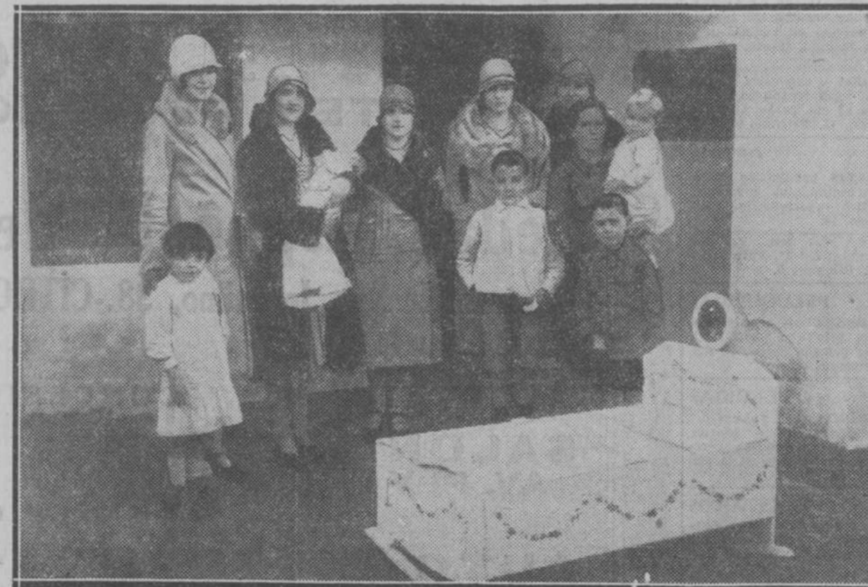
Un grupo de distinguidas señoritas hacen donación de una cuna a una familia obrera. Entre las múltiples y laudables actividades sociales de las Damas Catequistas, ocupa por su simpatía un lugar preferente la del Ropero Obrero, en las que intervienen las distinguidas señoritas de las respectivas ciudades donando a un grupo de señoritas cordobesas entregando a una familia obrera la ropa de una cuna para un chiquitín nacido el día de Navidad, que una de aquellas sostiene en sus brazos.