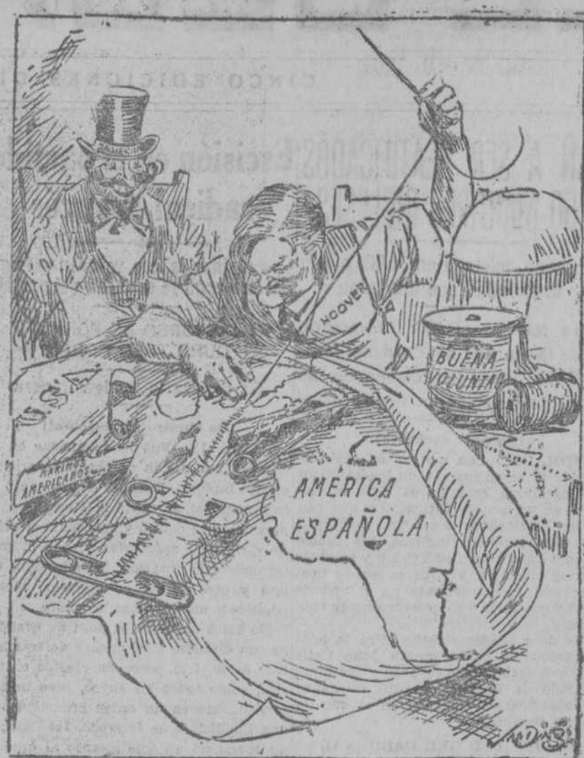
¿Habrá conseguido quitar esos molestos alfileres? "New York Herald Tribune"