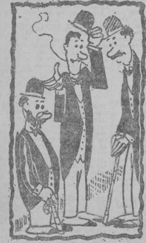
Querido señor: tengo el gusto de presentarle a mi gran amigo... ("Cri-Cri", París.)

Jarabe de HIPOFOSFITOS SALUD Cercos de medio siglo de éxito creciente Aprobado por la Real Academia de Medicina