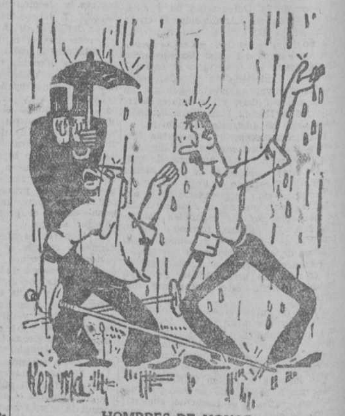
HOMBRES DE HONOR —¿Para qué batirnos? Yo creo que la mancha está suficientemente lavada. ("Le Rire", París.)