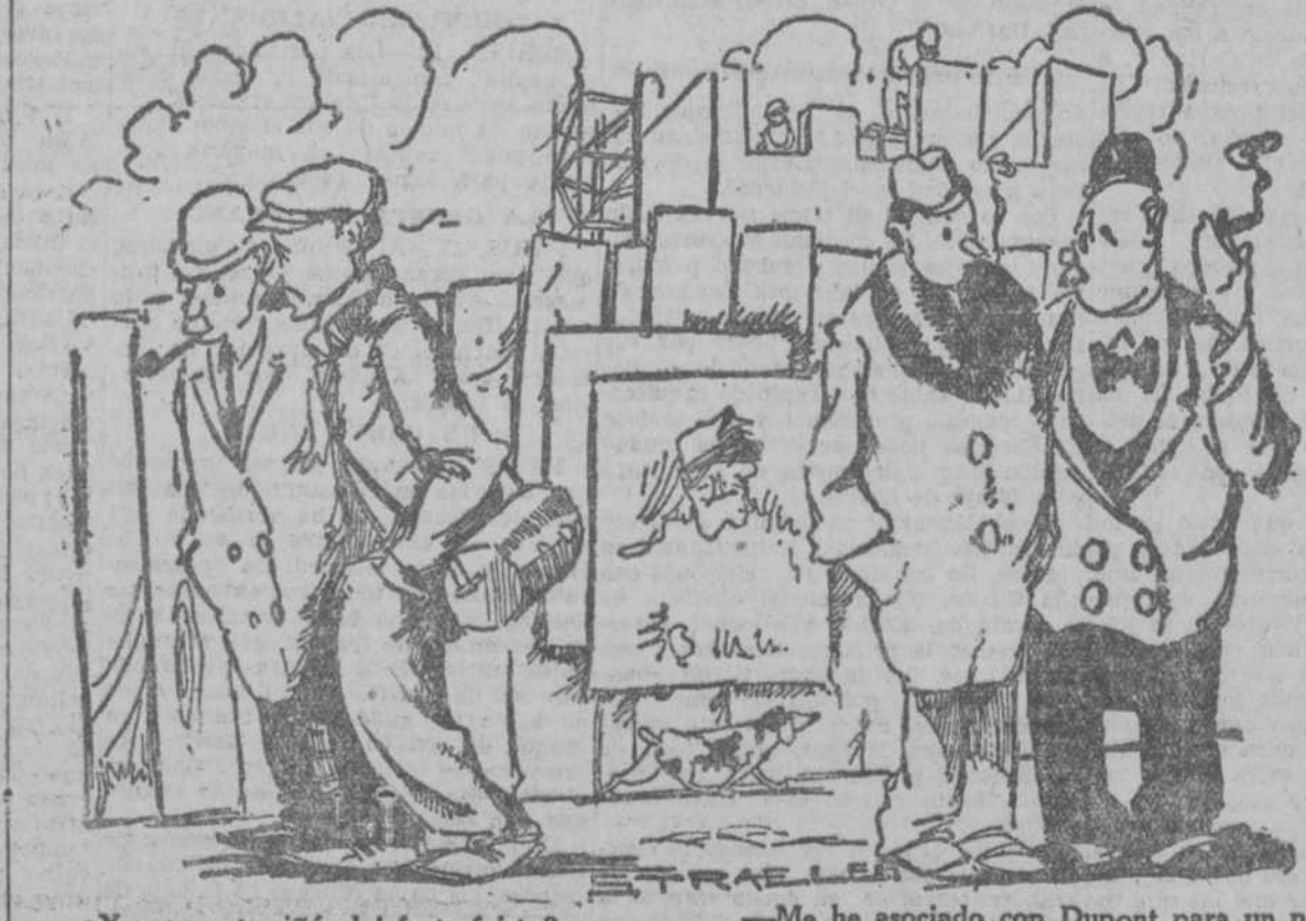
—¿Y porque te riñó el jefe te fuiste? —Si; me dijo: "Majadero, ahora mismo se larga usted de aquí". —Me he asociado con Dupont para un negocio de limpieza por el vacío. El aporta los cuartos. —¿Y tú? —Yo hago el vacío. ("Dimanche Illustré", París.)