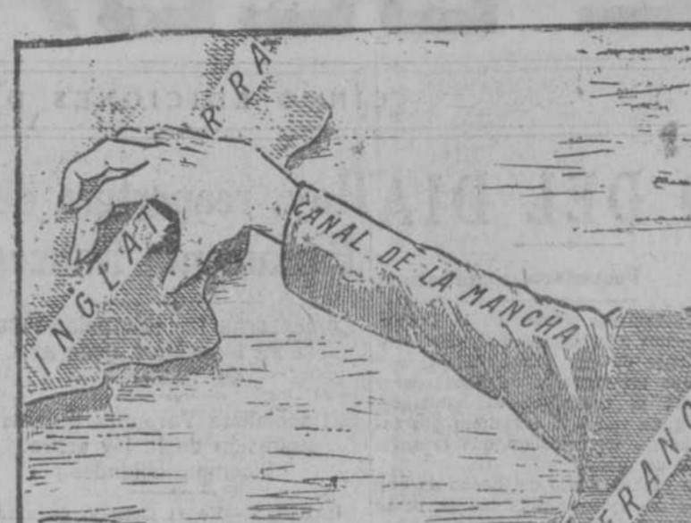
COMO LO VEN ALGUNOS EN INGLATERRA ("El Trabazo", Roma.)