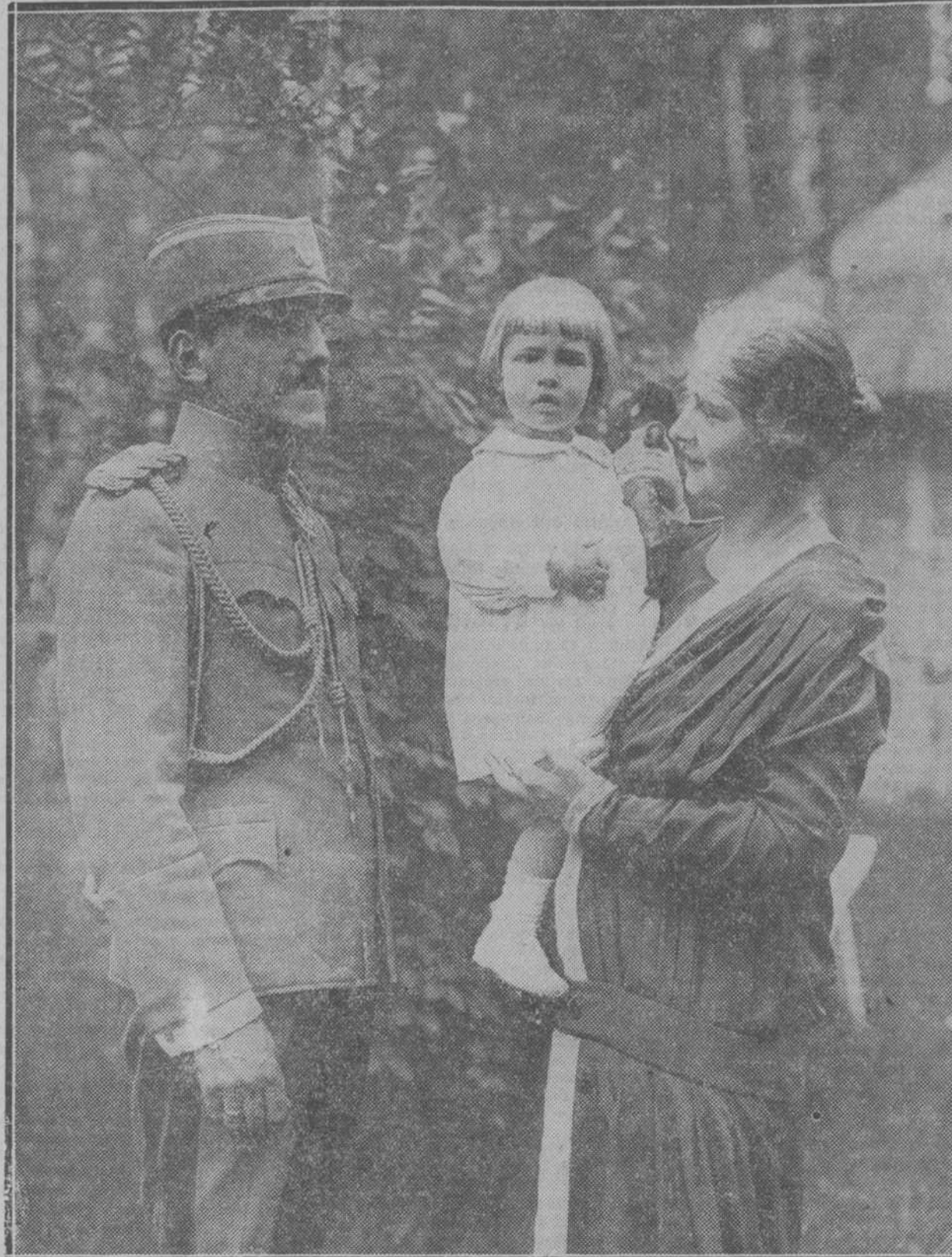
El rey Alejandro I de Yugoslavia, que ha proclamado y asumido personalmente la dictadura en su país.

La caída del Gobierno Korochetz sorprendió al rey Alejandro cuando se hallaba enfermo; su dolencia le obligó a dimitir por algunos días la crisis; mas, apenas repuesto, y después de explorar la opinión de los políticos más caracterizados de su pueblo, ha tomado esta resolución. El rey Alejandro pasa por ser un hombre de mucha sangre fría, y, en efecto, así lo ha demostrado durante la larga crisis política por que atraviesa en la actualidad Yugoslavia. Su resolución es tanto más gallarda cuanto que sabe que con ella se juega la última carta. Porque es el Monarca el único hombre que conserva por igual un prestigio político entre los diversos pueblos que hoy forman aquélla joven nación, y un fracaso suyo no sólo agravaría la añeja cuestión planteada entre serbios y croatas, sino que podría incluso precipitar la ruina del Estado. Mucho habrá meditado el Rey antes de dar este paso definitivo. Le acompañan en la fotografía su esposa, la ex princesa María de Rumania, y el hijo mayor de entrambos, príncipe Pedro, heredero de la Corona.