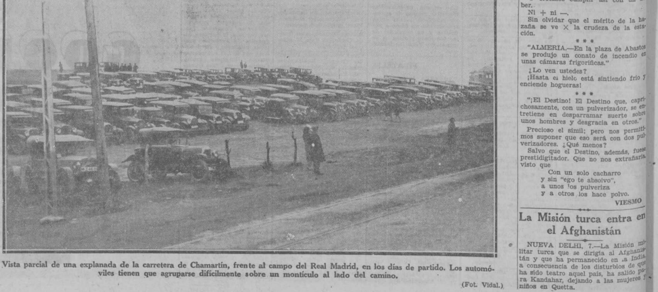
Vista parcial de una explanada de la carretera de Chamartin, frente al campo del Real Madrid, en los días de partido. Los automóviles tienen que agruparse difícilmente sobre un montículo al lado del camino.

Al efectuar sus compras, haga referencia a los anuncios leídos en EL DEBATE.