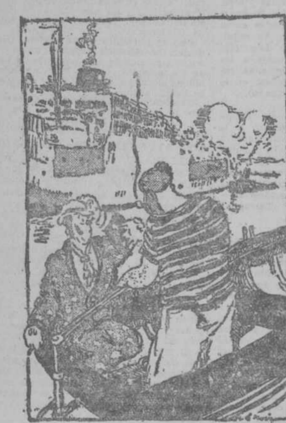
—Hay que ser marino para saber lo que supone 25 nudos por hora durante siete días. —Me hago cargo, amigo. ¡Qué dificultades para desatar la cuerda! ¡Y yo que para abrir un paquete tengo que cortar el hilo!

COMENTANDO el hecho, el periódico añade que estos robos, que tan frecuentemente se vienen repitiendo desde hace algún tiempo, son ejecutados, equivocadamente, según todas las probabilidades, por mujeres que se dedican al tráfico de estupefacientes.