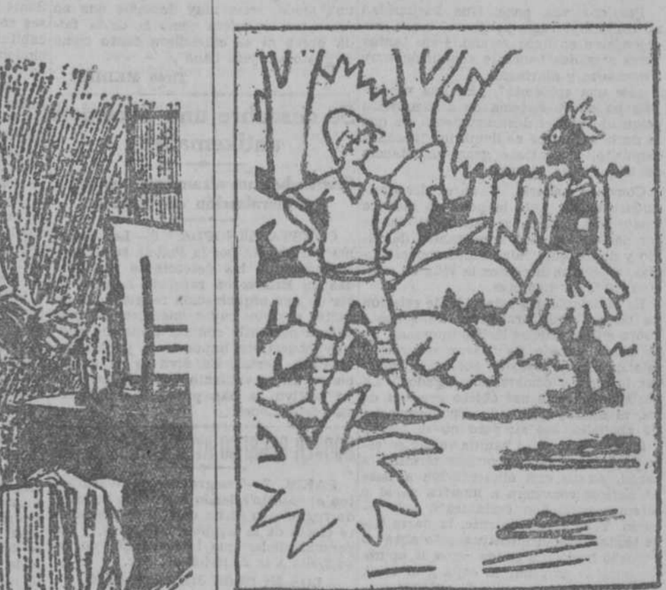
—Dime, ¿no has visto a un compañero mío que pasó por aquí hace unos días? —Pase a ver si es él; aún nos queda un trozo de solomillo.