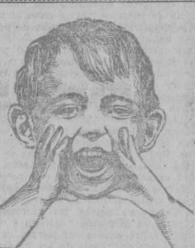
ACTIVO ABRADABLE TRATAMIENTO MODERNO DEL ESTREMIENTO HABITUAL LAXEN BUSTO