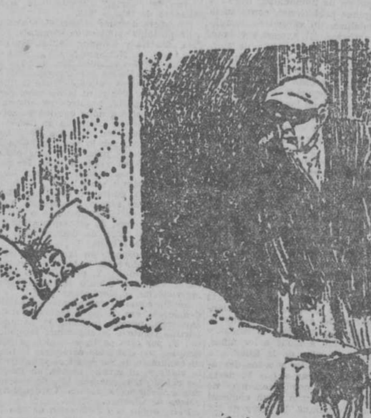
—No se asuste, señor. Yo no hago más que robar; el encargado de asesnar vendrá en seguida.