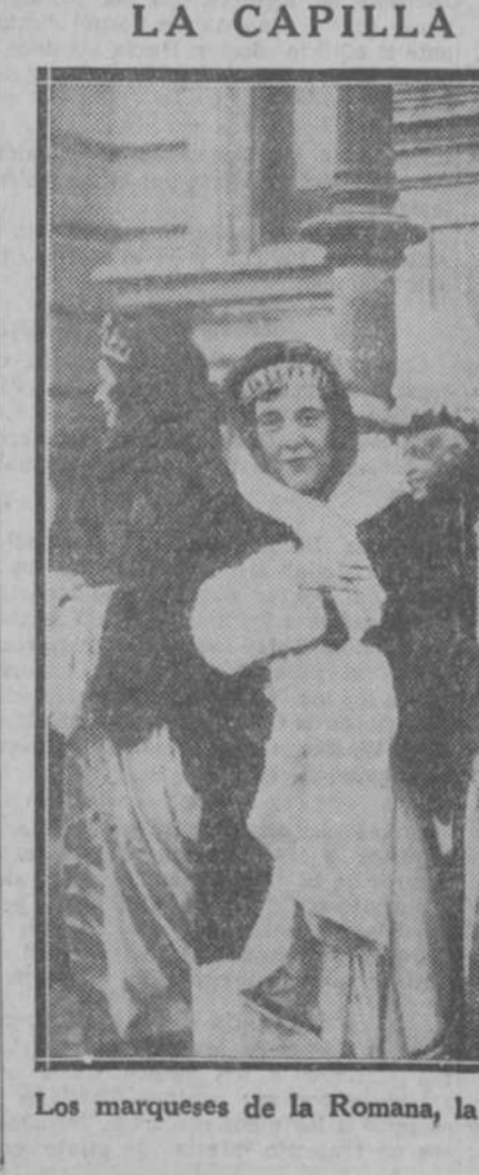
Los marqueses de la Romana, la princesa viuda Pio de Saboya y el actual Príncipe saliendo de Palacio