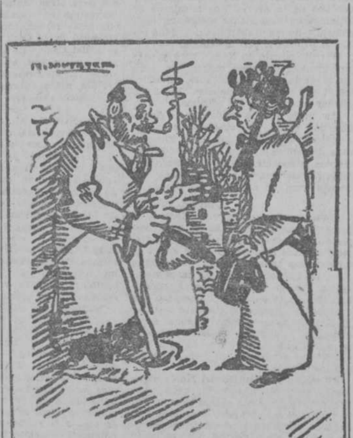
—Señora, deme usted la limosna de varias semanas, porque me voy a la Costa Azul.