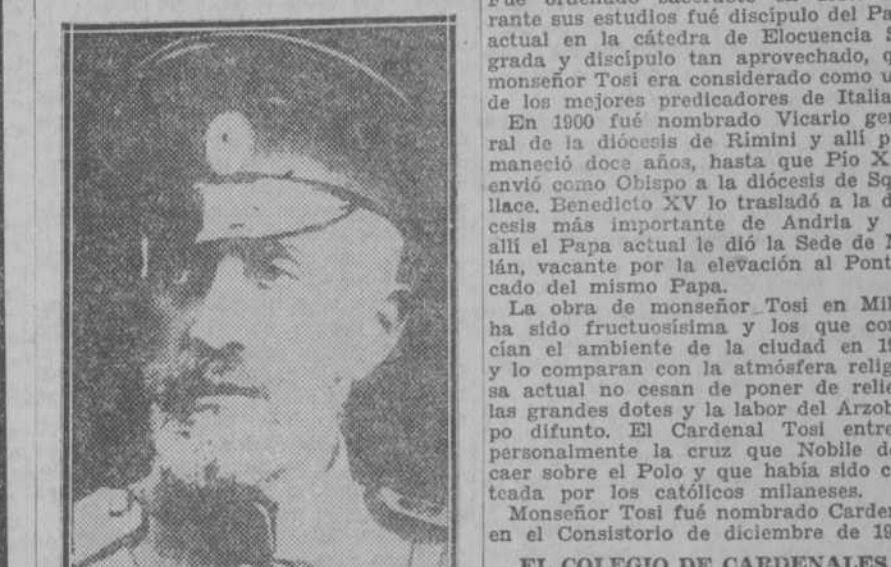
El gran duque Nicolás

PARIS, 7.—La Prensa francesa, con excepción naturalmente del sector comunista, ha vertido sus mejores necrologías sobre el cadáver del gran duque Nicolás. Hay algo más que un concepto de justicia a la figura del prócer difunto y a un tributo de actualidad en la oración fúnebre, en los artículos, tejidos de recuerdos, de capítulos biográficos, de adjetivos, incluso de esperanzas existe un motivo de gratitud. Leyendo este proceso, que no es de dolor convencional, porque, aunque la condolencia no fuera sincera, habría que evocar siempre, a través de sus ditirambos, no sólo el perfil de un gran militar, sino el resplandor de un carácter, de una conciencia recta, que de los valiosos ser-