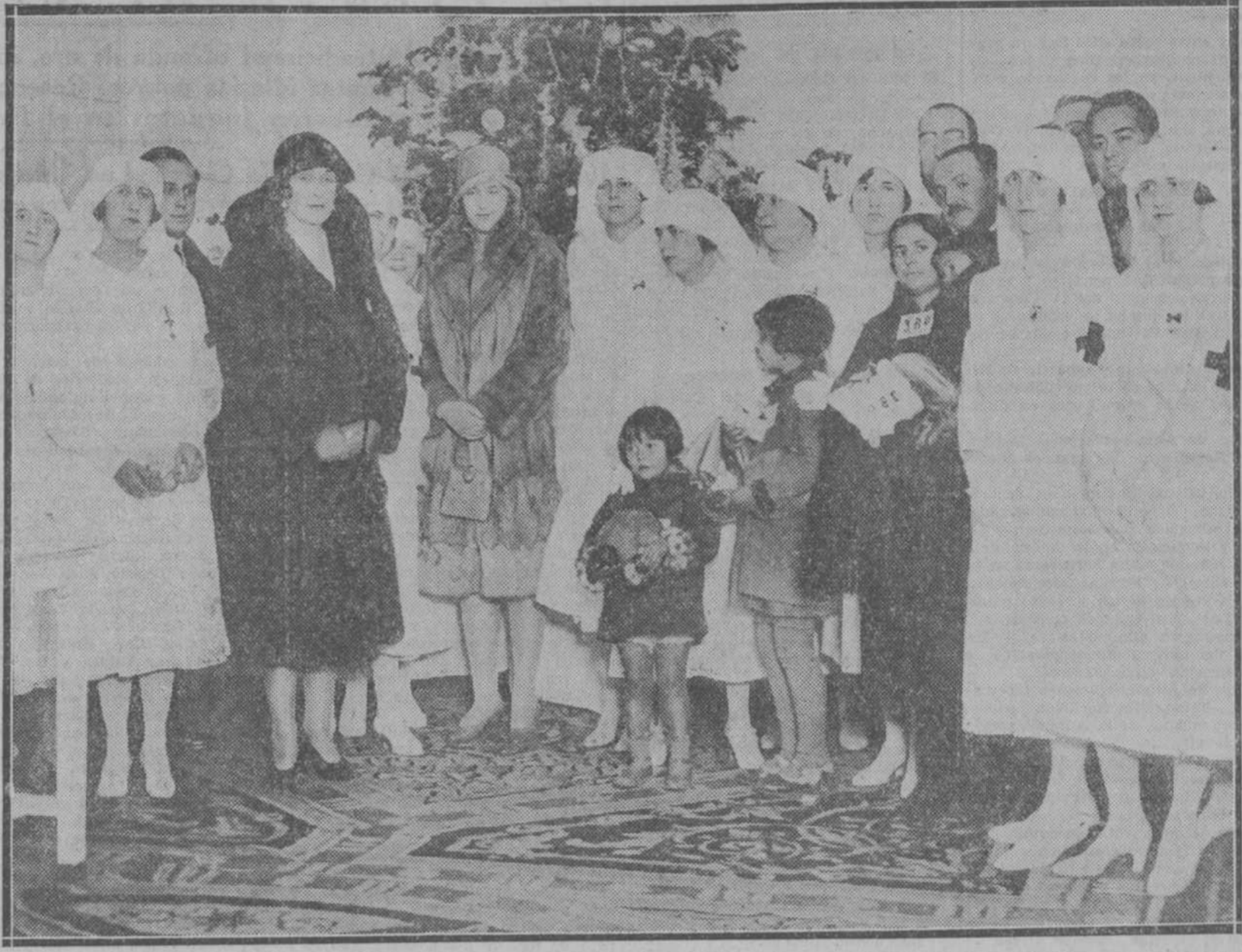
También para los niños pobres de las barriadas cercanas al Hospital de la Cruz Roja han llegado los Reyes; los han hecho llegar la caridad de una Reinas. Sus majestades doña Victoria y doña María Cristina, con las infantas Cristina y Beatriz, esta última con uniforme de enfermera...