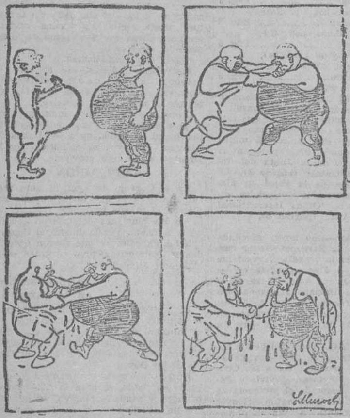
COMBATE NULO De cómo dos bravos luchadores tuvieron que abandonar la pelea después de cansarse inutilmente. ("Der Goetz", Viena.)