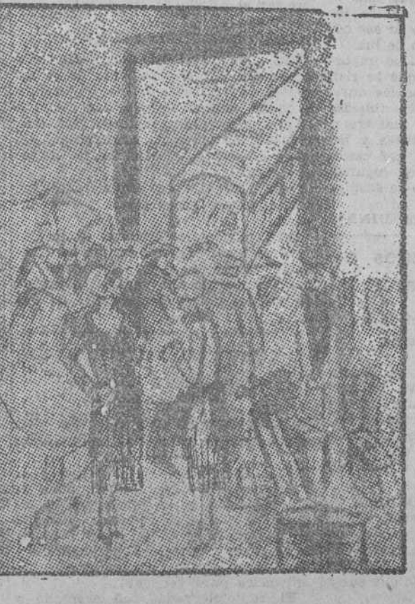
UNA. —¿En qué piensas? OTRA. —¡Ya me parecía que se me olvidaba algo! Me olvidé de sacar al niño de la bañera.