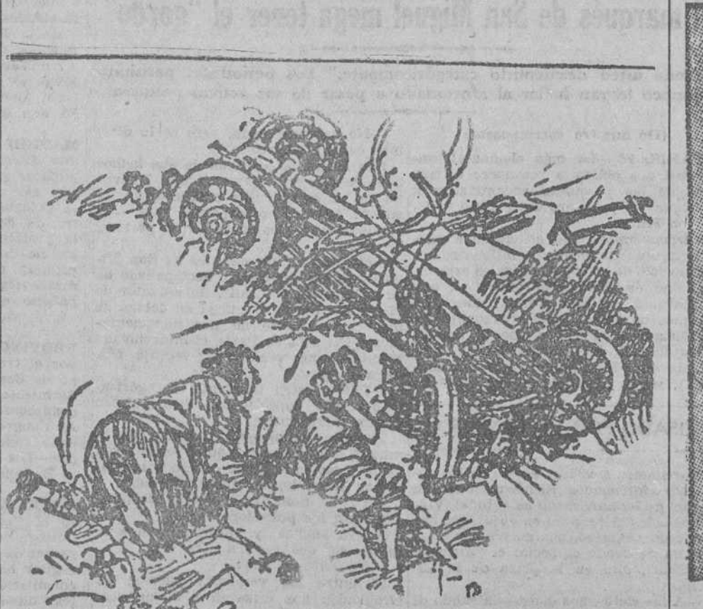
LA ESPOSA OPTIMISTA. —¡Magnífico! Así no tienes que meterte debajo para arreglarlo. ("London Opinion", Londres.)