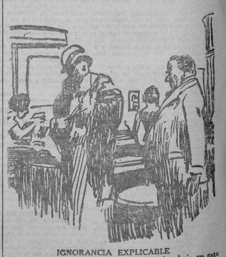
IGNORANCIA EXPLICABLE —¿Sabe usted a qué hora se empieza el trabajo en esta oficina? —No lo sé, señor jefe, porque siempre que llego están todos trabajando. ("Punch", Londres.)