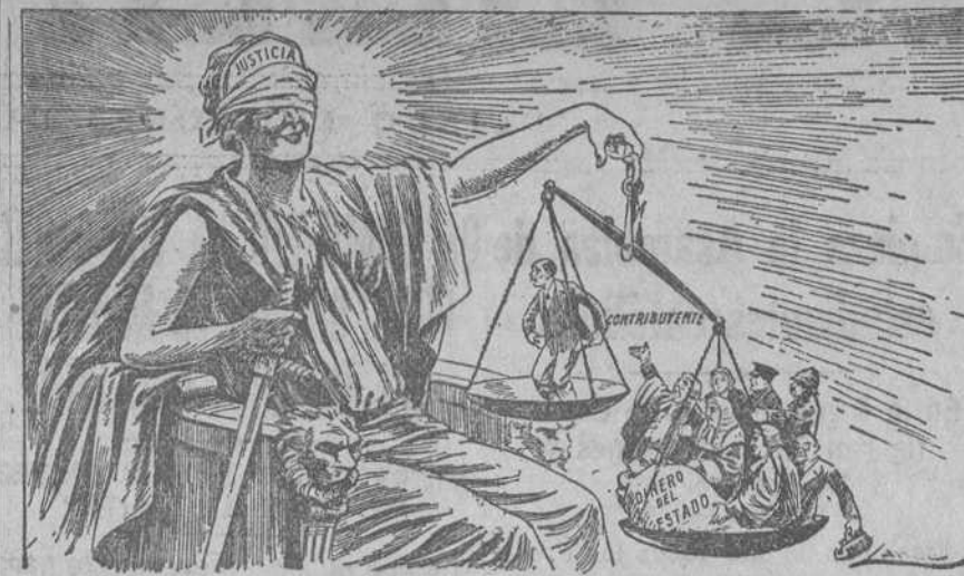
CON LOS OJOS TAPADOS ("John Blunt", Londres.)

caos a la nación, son precisas tres cosas: 1.º que se reconozca la existencia y personalidad de las distintas confesiones religiosas; 2.º que se reconozca la separación e independencia entre el Estado y las diversas confesiones religiosas y, por tanto, no legisle el Estado en materias religiosas; 3.º que esa separación no sea un régimen de hostilidad, sino de cooperación amistosa para conseguir el bien común.