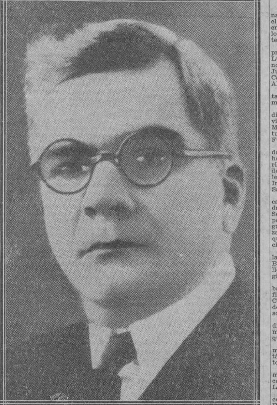
El general Machado, que ha sido reelegido presidente de Cuba.

El general Machado vuelve a la primera Magistratura de la república cubana, a la que ha sabido dirigir con fortuna y acierto como gobernante, a pesar de las dificultades que ha hecho surgir la postguerra en la principal riqueza del país. Organizador e inspector del Ejército cubano en los primeros momentos de la independencia nacional, ocupó a continuación el cargo de ministro del Interior. En 1925, como candidato del partido liberal, fue elegido presidente de la república. Machado es un buen amigo de España. En su mandato presidencial se firmó el Tratado de comercio hispanocubano, se elevó a Embajada la Legación de aquel país y se prometió la asistencia de Cuba a la Exposición Iberoamericana. El año pasado envió a España una importante suma para socorrer a los damnificados por los temporales de Marruecos, y fué él quien tuvo el delicado gesto de depositar una corona de flores sobre la tumba de los soldados españoles muertos en el Caney y en la Loma de San Juan.