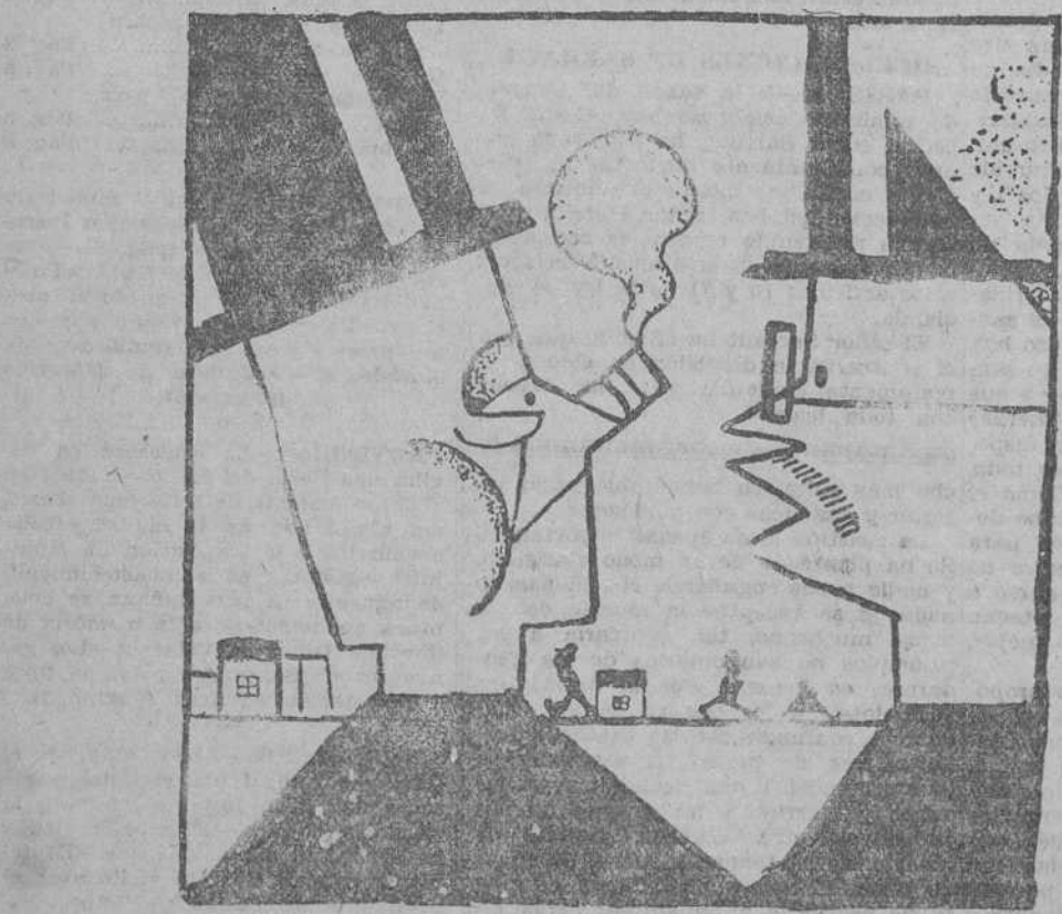
—Mi abuelo estuvo en relaciones mucho tiempo con un español y, no obstante...