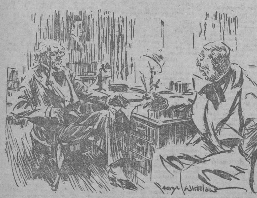
—Yo no acepto obras si no es de algún nombre muy conocido. ¿Cómo se llama usted? —Juan Pérez. ("The Humorist", Londres.)

¿Sabéis cuál es el cigarro habano que más se vende en España?