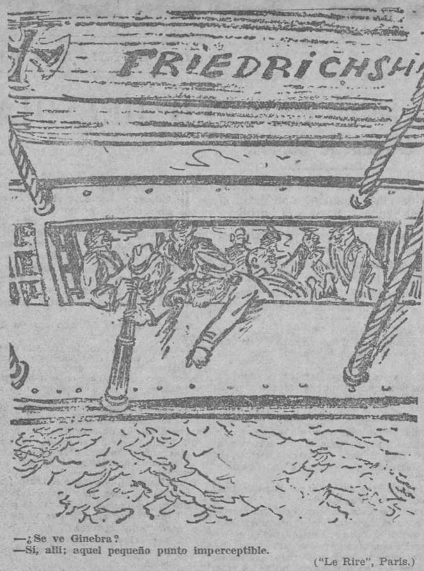
—¿Se ve Ginebra? —Sí, allí; aquel pequeño punto imperceptible. ("Le Rire", París.)