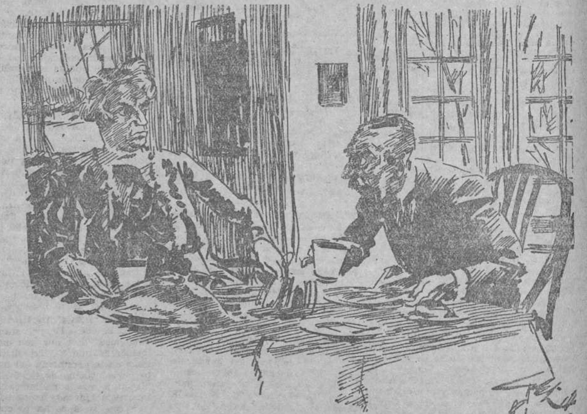
LA MUJER.—Cuando llegaste anoche a casa me dijiste que habías estado en el Casino con mister Jones. Ahora dices que fué en el Trocadero. ¿En qué quedamos? EL MARIDO.—¿Es que cuando llegué anoche no podía decir Trocadero! ("The Passing Show", Londres.)