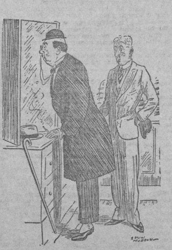
—No. Yo quiero algo más pequeño que esto... porque es para mi hijo menor. ("London Opinion", Londres.)