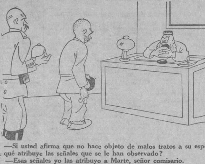
—Si usted afirma que no hace objeto de malos tratos a su esposa, ¿a qué atribuye las señales que se le han observado? —Esas señales yo las atribuyo a Marte, señor comisario.