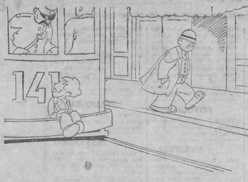
—Mira, antes de que te pongan una multa, levanta el vuelo. —¡Ca! Entonces me la ponen por volar sobre Madrid.