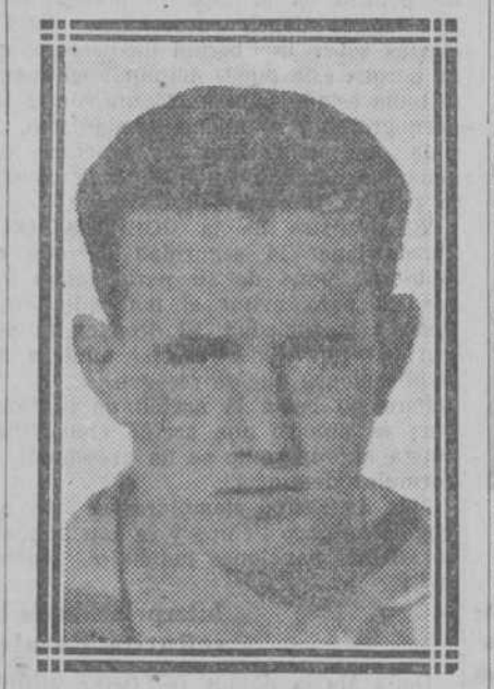
MARCULETA Uno de los mejores jugadores del partido.

(De nuestro redactor deportivo.) SANTANDER, 21. F. C. Barcelona..... 1 tanto, (Samitier) Real Sociedad..... 1 - (Mariscal)