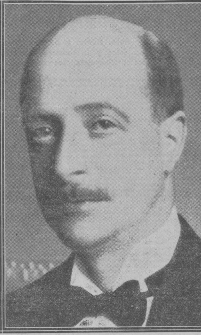
Don Eduardo Callejo de la Cuesta, ministro de Instrucción pública y Bellas Artes, autor de la reforma universitaria.

La trascendental ley que va a transformar organismos tan fundamentales como las Universidades motiva la publicación en nuestra galería de actualidades de la figura del señor Callejo. El ha puesto cima a una obra de verdadero anhelo nacional; obra al mismo tiempo erizada de dificultades que el ministro ha sabido finamente vencer. Hombre de asiduidad extraordinaria en el trabajo del ministerio, de clarísima penetración de los problemas docentes y de una excesiva modestia, que le resta el brillo de meteoro fugaz que han disfrutado otros ministros. Paso a paso, y sin reñoneos fatuas, el señor Callejo está operando una revolución en la enseñanza española. Ahora aparece evidente que cuando el ministro no cuenta sino con aquellos asesoramiento de orden técnico que en todo caso son útiles y aun necesarios, la ley de reforma sale en la "Gaceta" con suficientes garantías de éxito.